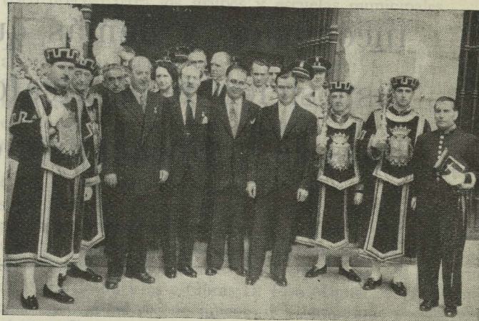
La representación municipal a la salida de la iglesia de Santa María después de oída la solemne misa en que se ratificó el Voto de Villa

Día 15. —Fallece en Madrid el que fué Concejal del Ayuntamiento e insigne compositor D. Jacinto Guerrero Torres. Puede decirse que todos los habitantes de la Villa se sintieron conmovidos por la triste noticia.