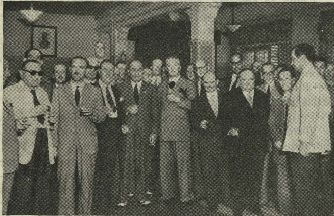
Recepción ofrecida por el Club Angloamericano a los representantes del Bussiness Club, con asistencia del excelentísimo señor Alcalde

Día 6. —En el sudexpreso de Irún llegó a Madrid un grupo de miembros del Bussiness Club, de la ciudad británica de Cárdiff, entre los que se encuentra el Segundo Alcalde de la referida ciudad. En la estación fueron recibidos por el Oficial mayor y Jefe de Protocolo, señor Górgolas, en representación del excelentísimo señor Al-