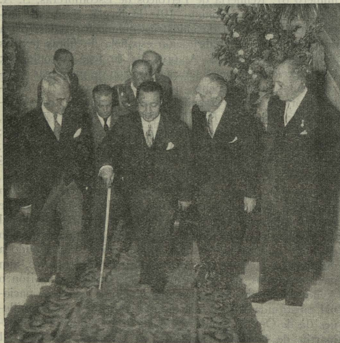
El Presidente de Filipinas, Dr. Elpidio Quirino, hace su entrada en el Ayuntamiento el día de la recepción ofrecida en su honor

En la plaza de Colón esperaban la llegada del señor Quirino el Ayuntamiento de Madrid en corporación, bajo