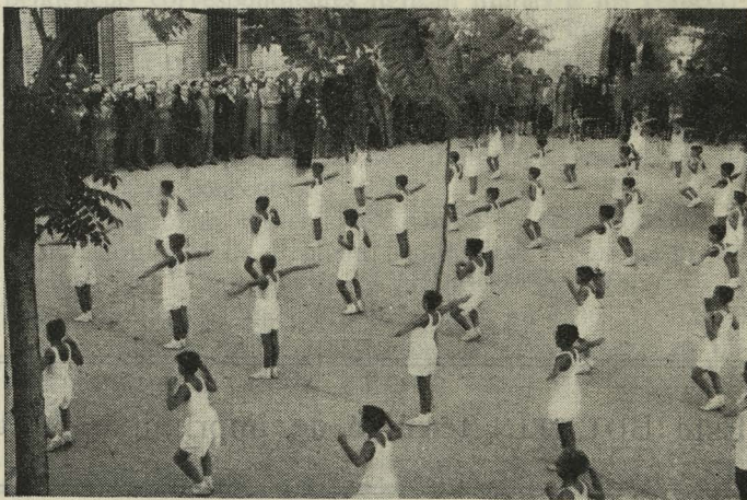
Los niños del Internado de Alcalá de Henares haciendo ejercicios de gimnasia rítmica ante las autoridades

—A las doce y media de la mañana se celebró, con la asistencia del Jefe del Estado, Generalísimo Franco, la solemne sesión inaugural de la Primera Exposición bienal