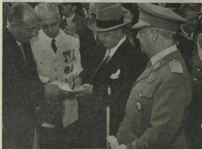
El Presidente de la República de Filipinas, Dr. Elpidio Quirino, firmando en el Libro de Oro del Ayuntamiento de Madrid momentos antes de su partida ante la presencia de Su Excelencia el Generalísimo Franco y del Alcalde, excelentísimo señor Conde de Santa Marta de Babío

— A las cinco de la tarde, en el estadio de Chamartín, generosamente cedido por sus propietarios, se celebró un partido amistoso de fútbol entre los equipos del Real Madrid C. de F. y el Plus Ultra, partido que forma parte de los festejos organizados por la Tenencia de Alcaldía de Buenavista con ocasión de las fiestas de Nuestra Señora del Pilar, Patrona de la barriada, y a beneficio de las clases