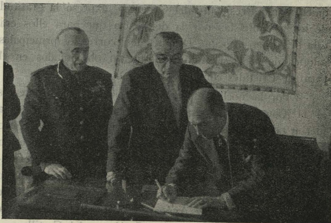
El excelentísimo señor Alcalde firmando el acta de anexión del pueblo de Vicálvaro a Madrid