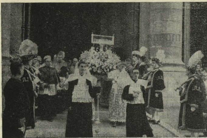
Las reliquias de San Antonio María Claret al salir procesionalmente de la catedral de San Isidro

Día 21. —En el paseo de Coches del Retiro se celebró la prueba internacional de pequeños bólidos. Al final de la carrera, a la que asistieron millares de espectadores, el Alcalde entregó al vencedor la copa del Ayuntamiento.