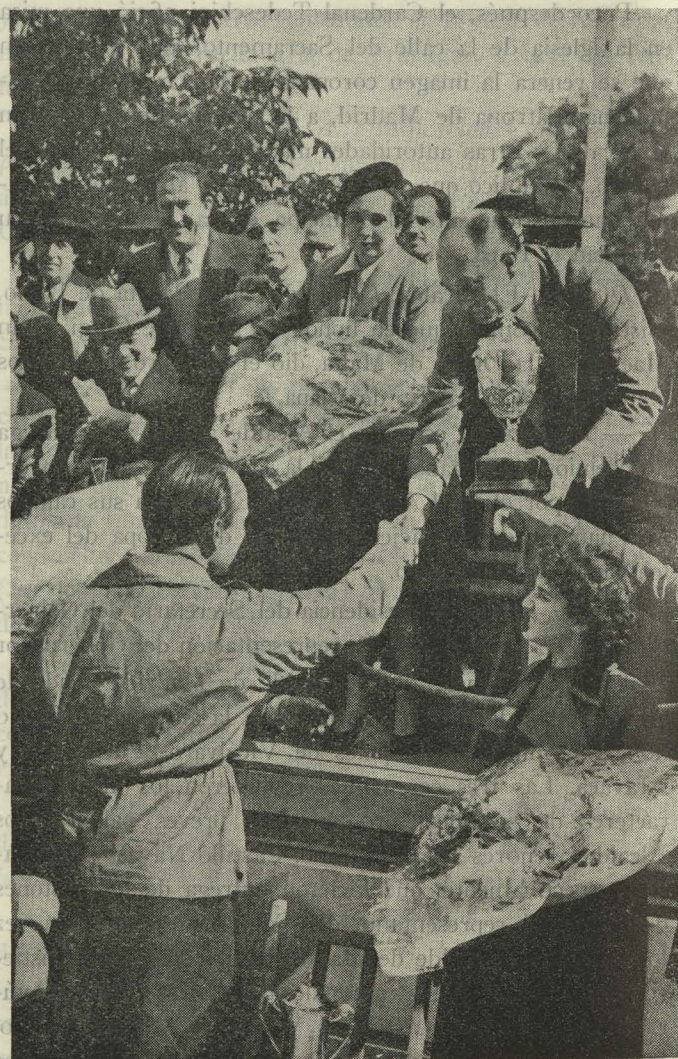
El Alcalde de Madrid, Conde de Santa Marta de Babío, hace entrega de la copa del Ayuntamiento al ganador de la prueba internacional de pequeños bólidos celebrada en el Retiro

Día 28. —En la catedral de San Isidro se celebró una misa de pontifical, seguida de bendición apostólica, oficiada