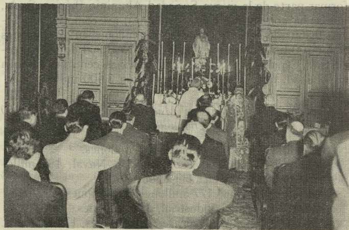
El Patriarca de las Indias Occidentales, Obispo de Madrid-Alcalá, celebrando la misa del Espíritu Santo antes de la constitución del nuevo Ayuntamiento

Finalmente, ante un Crucifijo colocado en la mesa presidencial, y con la mano sobre los Evangelios, los nuevos Concejales juraron la siguiente fórmula: "Juro servir fielmente a España, guardar lealtad al Jefe del Estado, de-