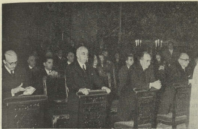
El Alcalde, con los Concejales entrantes y salientes, durante la celebración de la misa del Espíritu Santo