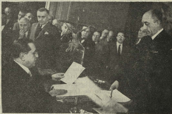
Uno de los nuevos Concejales prestando juramento en el acto de la toma de posesión de su cargo