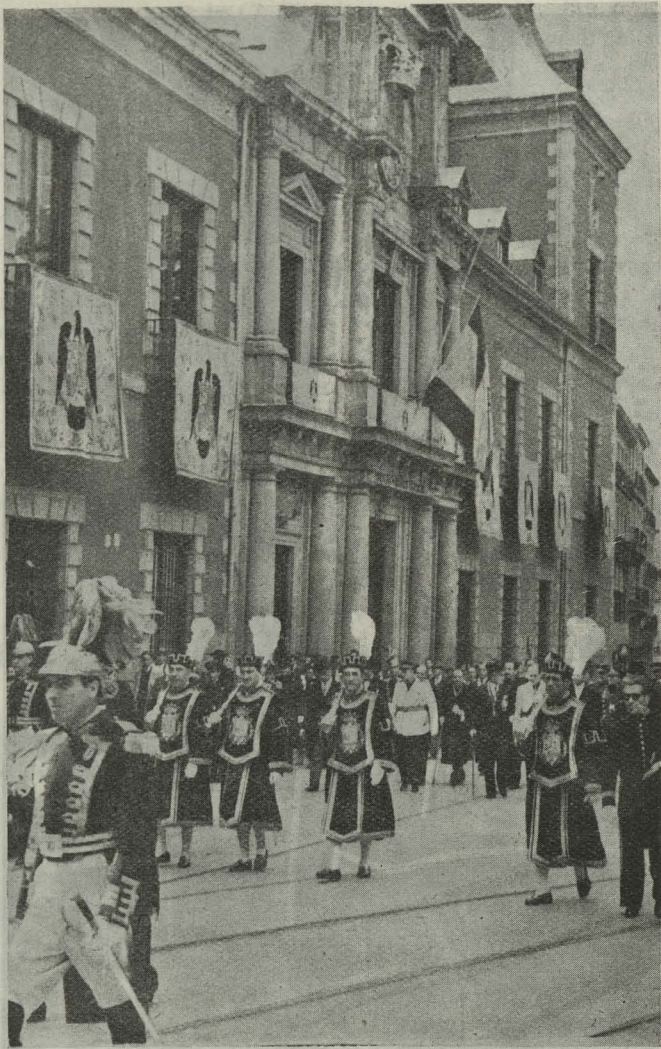
El Ayuntamiento, en corporación, haciendo la visita a los Sagrarios el día de Jueves Santo