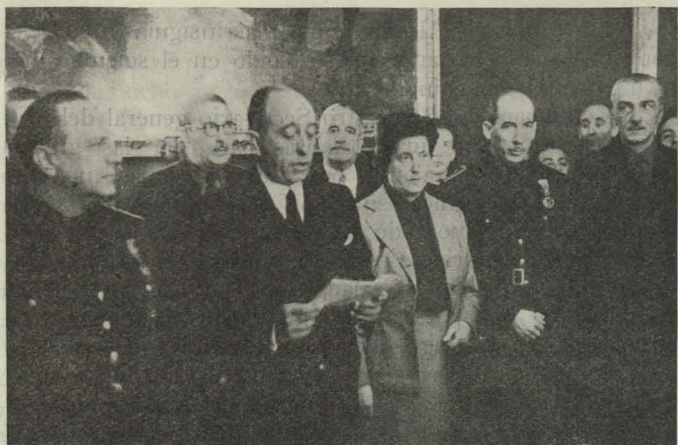
El Alcalde leyendo un discurso durante el acto de imponer la Medalla de Oro de Madrid a la bandera de la Vieja Guardia de Madrid y a la excelentísima señorita Pilar Primo de Rivera

público y del Alcalde y los Concejales, que presenciaron el espectáculo desde los balcones.