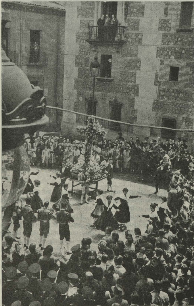
Bailes ante la Cruz de Mayo en la plaza de la Villa

Día 7. —A mediodía, los asistentes a la Asamblea General de Secciones Económicas del Sindicato Nacional de Hostelería visita-