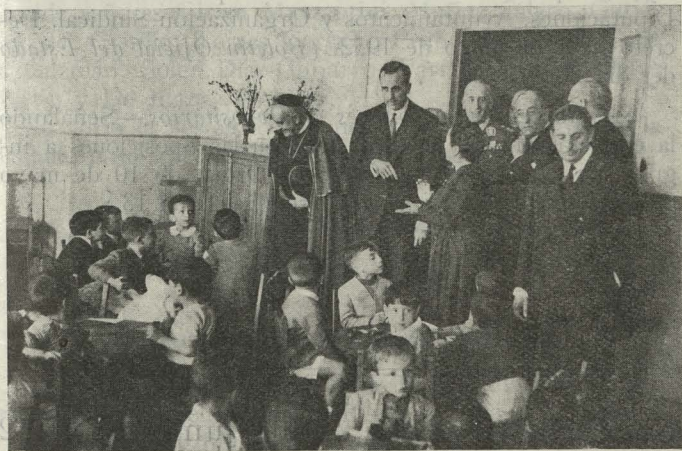
El excelentísimo señor Ruiz Giménez, Ministro de Educación Nacional, con el Alcalde, el Embajador de la Argentina, el Patriarca de las Indias Occidentales y el señor Gutiérrez del Castillo en una de las aulas del grupo escolar República Argentina durante el acto de su inauguración.

Día 17. —En la Primera Casa Consistorial se celebró una recepción en honor de los asistentes a las primeras Jornadas Internacionales de Plásticos. Fueron presentados por el Presidente, señor Martínez Ercilla, y el Alcalde, que estaba acompañado de varios Tenientes de Alcalde y Concejales, después de acompañarlos en la visita a los salones y de contemplar las obras de arte que guardan, les obsequió en el patio de Cristales con un aperitivo.