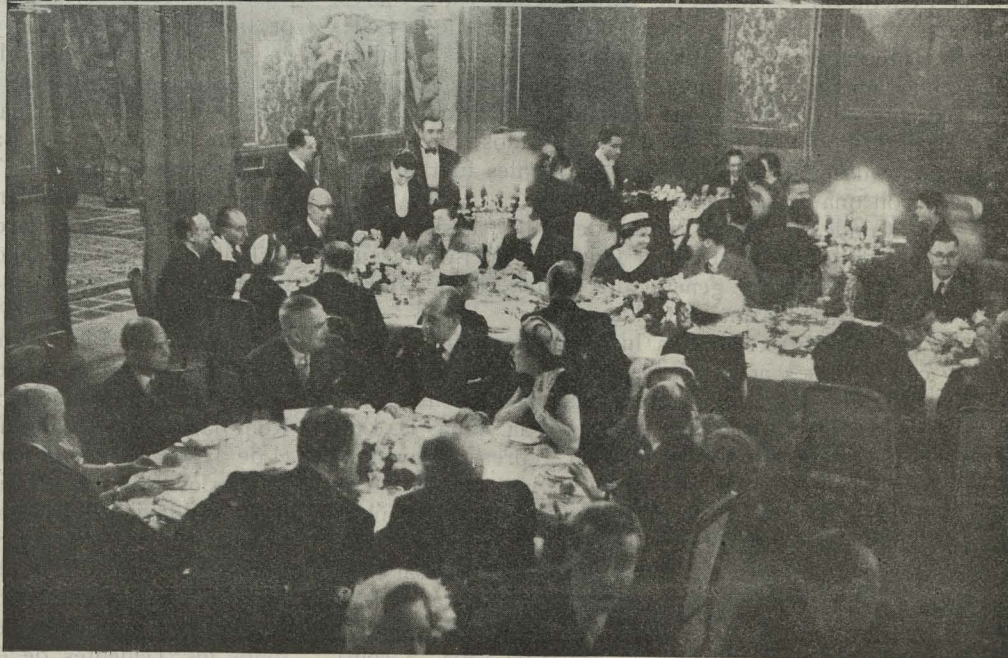
De arriba a abajo: Llegada del Jefe del Estado, Generalísimo Franco, y el Príncipe Regente del Irak a la plaza de la República Argentina, donde esperaba el Ayuntamiento en Corporación.—El Príncipe del Irak y el Alcalde de Madrid durante la visita a la población.—Un aspecto del salón donde se sirvió una cena fría en honor de S. A. R. el Príncipe del Irak