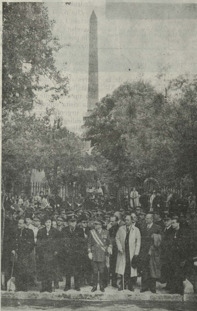
Las autoridades que asistieron a la misa celebrada ante el obelisco que guarda los restos de los héroes del Dos de Mayo

Día 3.—A mediodía acudieron al Ayuntamiento numerosas comparsas de majas y chisperos que, procedentes de la barriada de Chamberí, donde se están celebrando las fiestas de la Cruz de Mayo, escoltaban una artística y monumental cruz de flores. Al llegar a la plaza de la Villa, muchachas de la Sección Femenina bailaron unas seguidillas castellanas ante la cruz, recibiendo muchos aplausos del