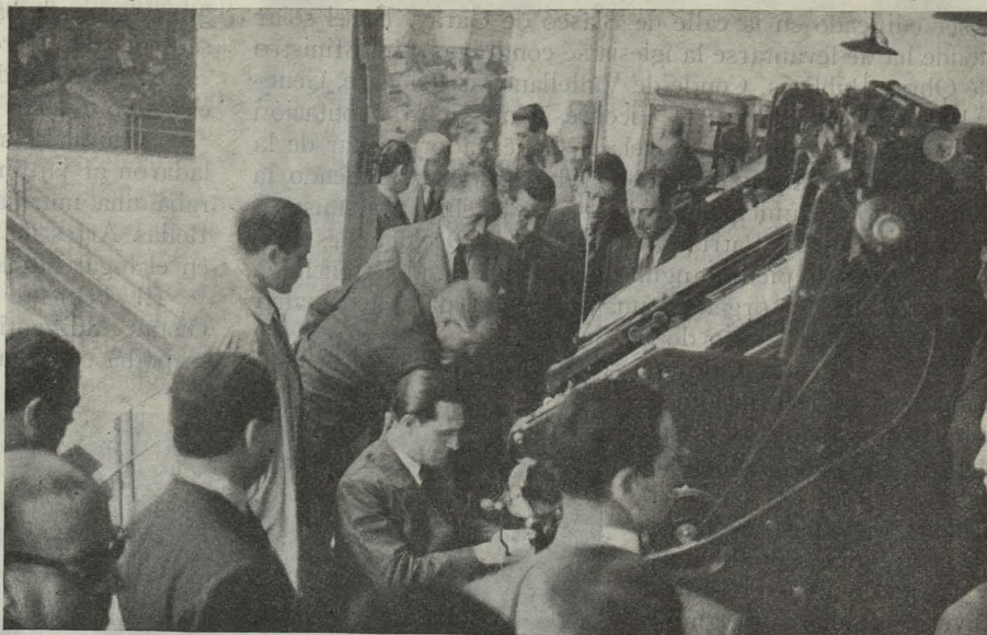
Un aspecto de la Sección de Composición mecánica—al fondo, la de Tipografía—durante la visita realizada el pasado día 6 por el excelentísimo señor Alcalde y señores Concejales a los talleres de Artes Gráficas Municipales