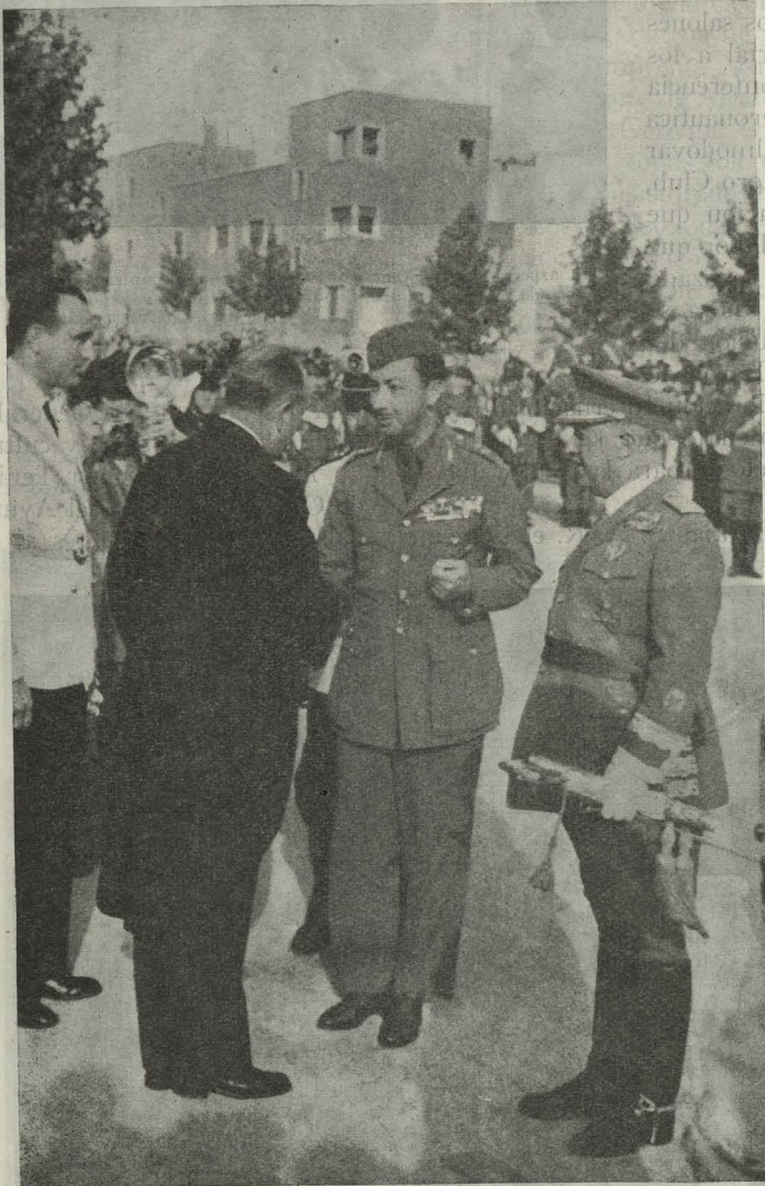
El Alcalde, Conde de Santa Marta de Babío, da la bienvenida en nombre del pueblo de Madrid al Regente del Irak a su llegada a la plaza de la República Argentina, en presencia del Generalísimo Franco