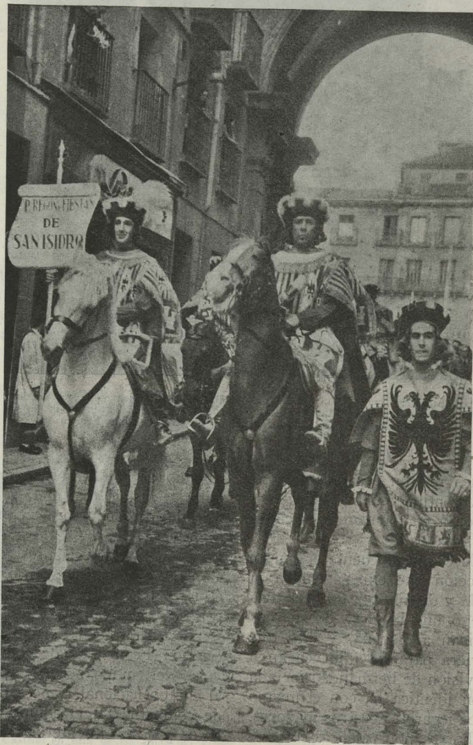
Heraldos anunciando las fiestas de San Isidro del corriente año

—Se verificó la colocación de la primera piedra del templo parroquial del Cristo de la Victoria, que va