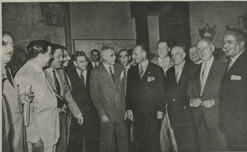
El Conde de Mayalde rodeado de los periodistas que hacen la información municipal