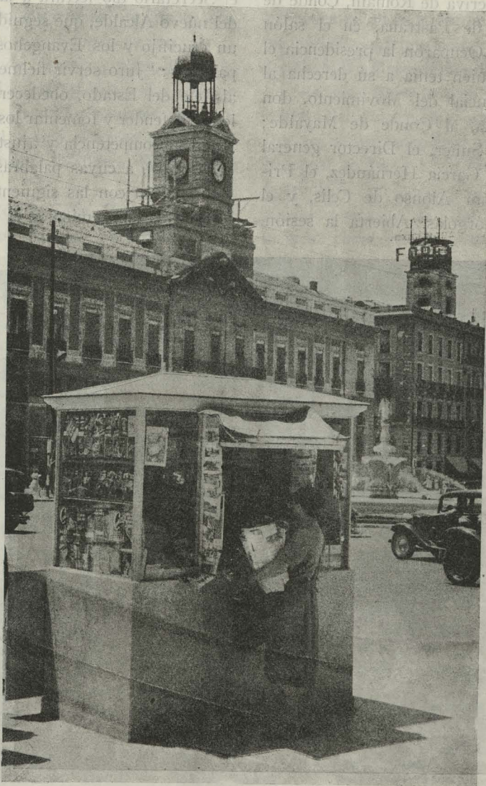
Uno de los nuevos puestos de venta de periódicos recientemente inaugurado en la Puerta del Sol