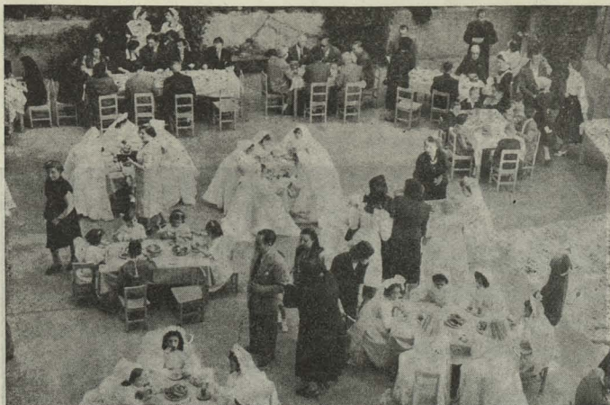
Las niñas del Internado Palacio Valdés durante el desayuno con que fueron obsequiadas el día de su Primera Comunión en uno de los patios del Colegio

de Alcalde. Finalizó el acto con un espléndido desayuno, servido en el patio del colegio.