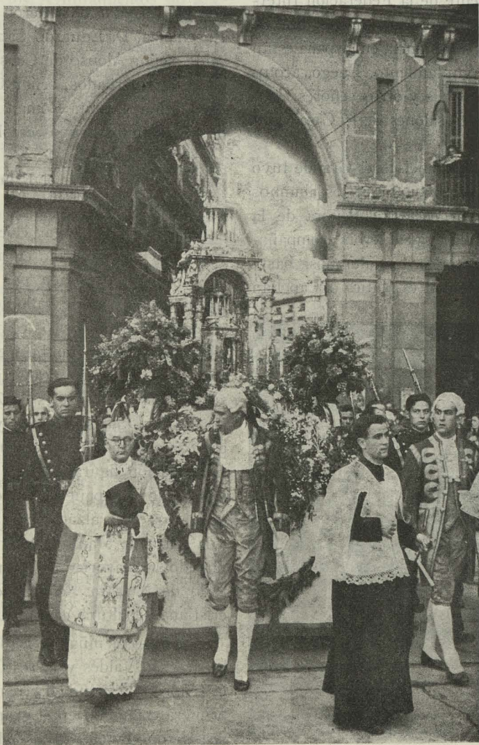
Con gran fervor religioso se celebró la tradicional procesión del Corpus Christi, de la que recogemos el momento de entrar la custodia en la Plaza Mayor

Día 15. —En el Monumental Cinema se celebró un reparto de premios a los obreros de los Centros de instrucción que dirigen las Damas Catequistas. En los palcos presidenciales tomaron asiento el Presidente del Consejo de Estado, señor