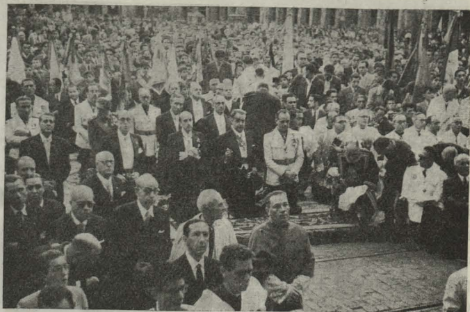
La Corporación Municipal recibe la bendición con el Santísimo, impartida por el Patriarca de las Indias en la Plaza Mayor, como final de la procesión del Corpus