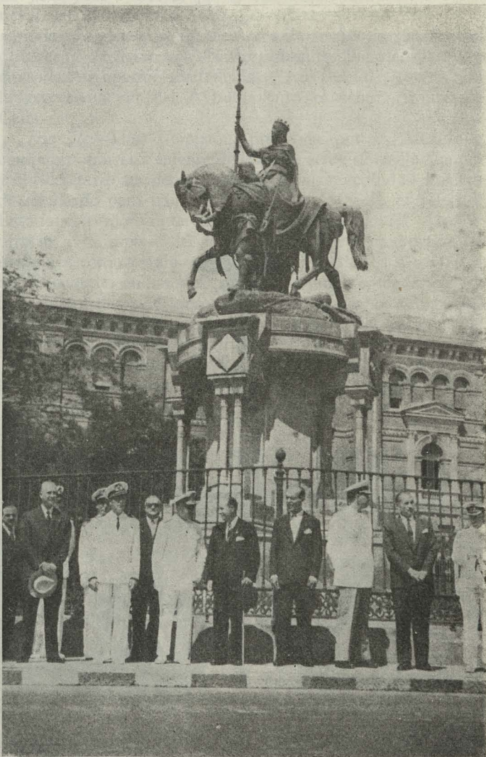
El Alcalde de Madrid con el Comandante del buque escuela argentino Puyrredón y otras personalidades durante el homenaje tributado a Isabel la Católica en el paseo de la Castellana

Día 8. —Visitó al Alcalde, en su despacho oficial de la