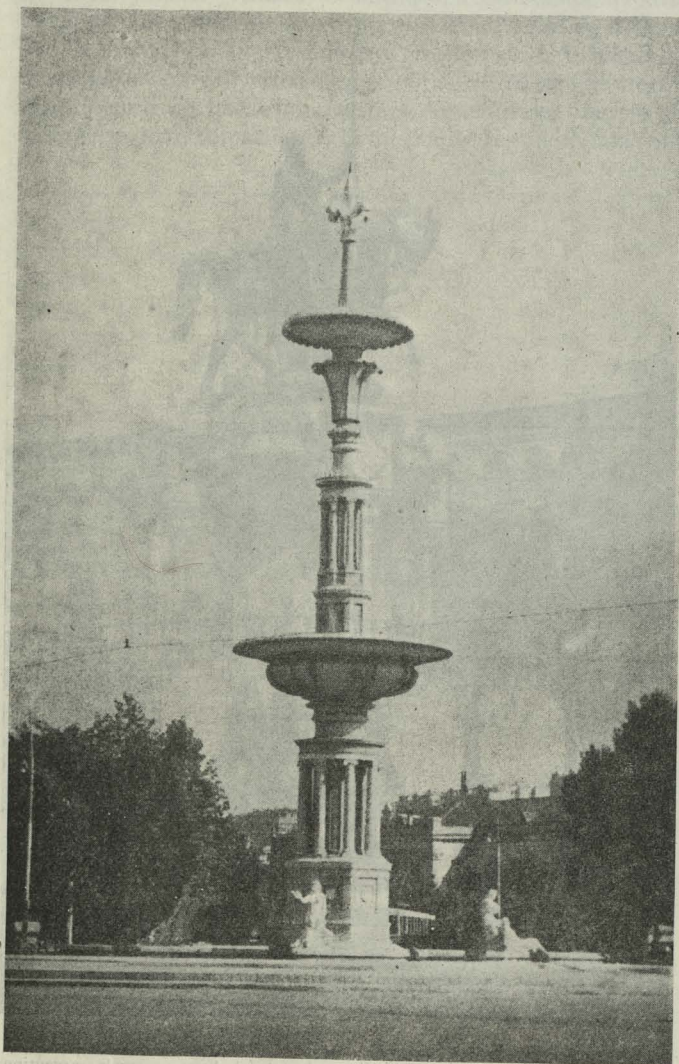
La fuente monumento a Villanueva inaugurada en la glorieta de Ramiro Ledesma Ramos

Día 13.—El Teniente de Alcalde Inspector de Alcaldías