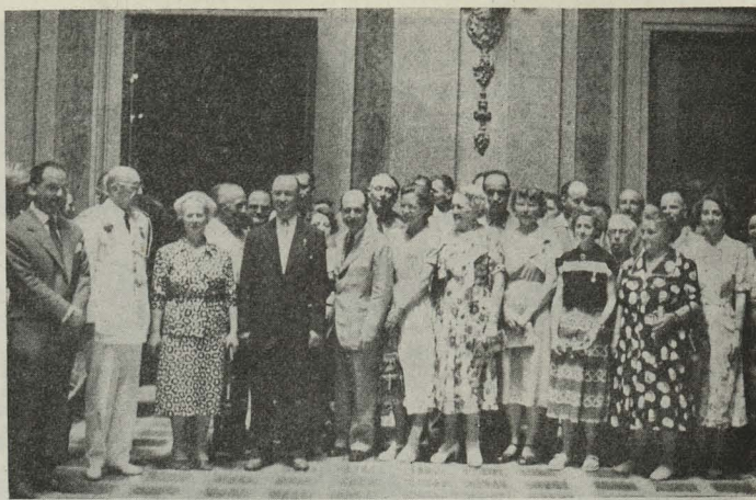
Los participantes en el primer rallye de las Federaciones Internacionales de Motorismo con el Alcalde y el Delegado Nacional de Deportes, General Moscardó, en el día que visitaron el Ayuntamiento.

— Presidido por el Ministro Secretario general del Movimiento, se celebró en la iglesia parroquial de San José un solemne funeral en sufragio del alma del protomártir de la Cruzada, D. José Calvo Sotelo. Con el Ministro, y al