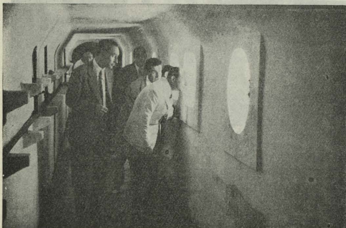
Durante la visita a la piscina municipal de la Casa de Campo, el Alcalde inspeccionó las dependencias e instalaciones de la misma

— Por la tarde, el excelentísimo señor Alcalde asistió