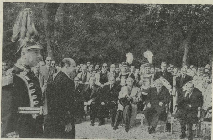
El Alcalde, Conde de Mayalde, pronunciando un discurso en el acto de la inauguración del monumento a Cuba en el Retiro

mentos el drama del viejo continente viene del hecho de que los antiguos sistemas políticos están caducados, en tanto que los nuevos no han encontrado todavía su fórmula feliz y definitiva. Esto produce una sensación de inestabilidad que es uno de los peligros que amenazan la salud de Europa. "Es preciso, por tanto, que con toda objetividad estudiemos nuestras respectivas posiciones y rectifiquemos cada uno nuestros errores, reconociendo las razones que a todos nos asisten."