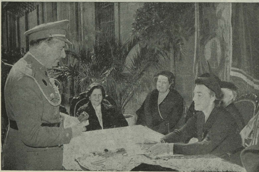
La Duquesa de Pastrana, esposa del Alcalde, preside la Mesa petitoria instalada en la plaza de la Villa el Día de la Banderita