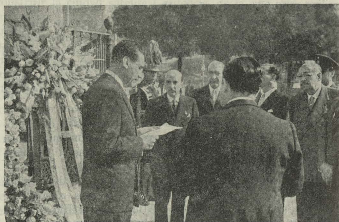
El Ministro de Relaciones Exteriores de El Salvador en el acto de depositar una corona de flores en el monumento de Isabel la Católica, en presencia del señor Alonso de Celis, que ostentaba la representación del Alcalde

Día 3. —El Ministro de Relaciones Exteriores de El