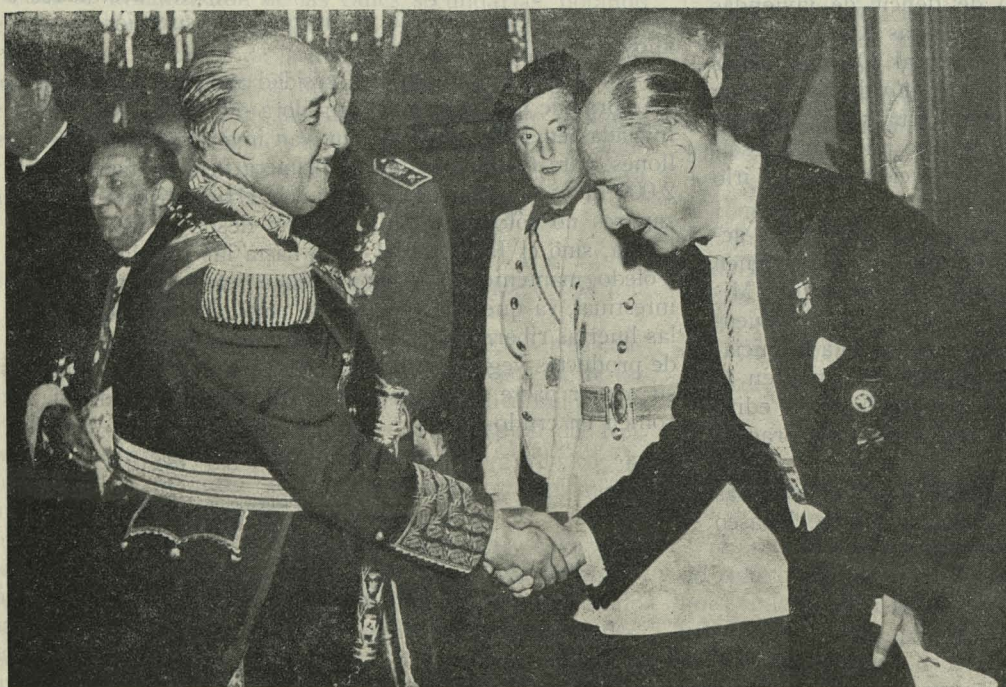
El Jefe del Estado, Generalísimo Franco, saluda al Alcalde de Madrid durante la recepción celebrada en el Palacio de Oriente el Día del Caudillo

Día 9. —Por la estación de Atocha llegó a Madrid el brazo derecho de San Francisco Javier. Para recibirle se congregaron en la estación los