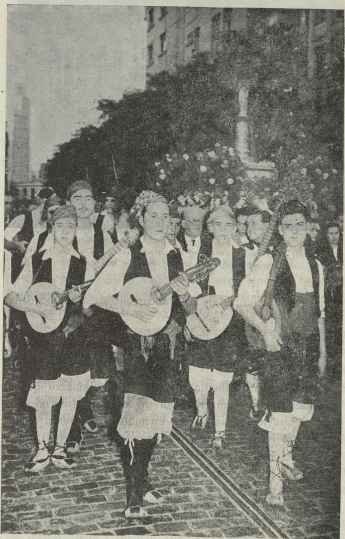
Un detalle de la procesión de la Virgen del Pilar, celebrada en la Parroquia titular con la imagen que se guarda en el Ayuntamiento

Ministros de Educación Nacional, Marina, Obras Públicas, Trabajo y Secretario general del Movimiento, así como otras altas personalidades y numerosísimo público. El Alcalde de Madrid, acompañado del Primer Teniente de Alcalde y de una nutrida representación municipal, figuró también, representando al pueblo madrileño.