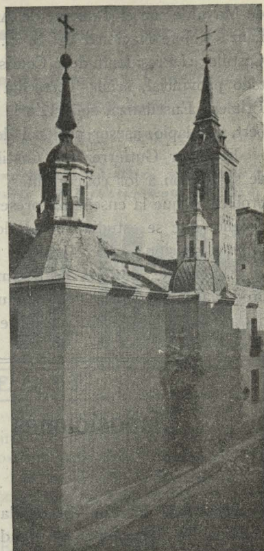
Aspecto exterior del santuario de Nuestra Señora de los Dolores, abierto nuevamente al culto después de su restauración

Día 27. —En el Ayuntamiento se celebró una recepción en honor de los Maestros de Madrid con motivo de la festividad de San José de Calasanz. Cerca del millar de Maestros asistieron al acto, que fué presidido por el Conde