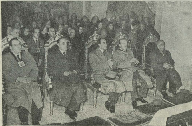
La presidencia que en representación del Alcalde figuró en la inauguración del culto en el santuario de Nuestra Señora de los Dolores