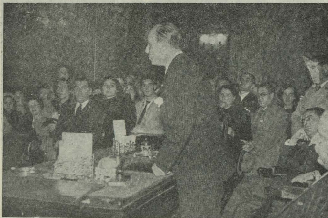
El Alcalde dirigiendo la palabra a los Maestros de Madrid durante la recepción celebrada en su honor con motivo de la festividad de San José de Calasanz