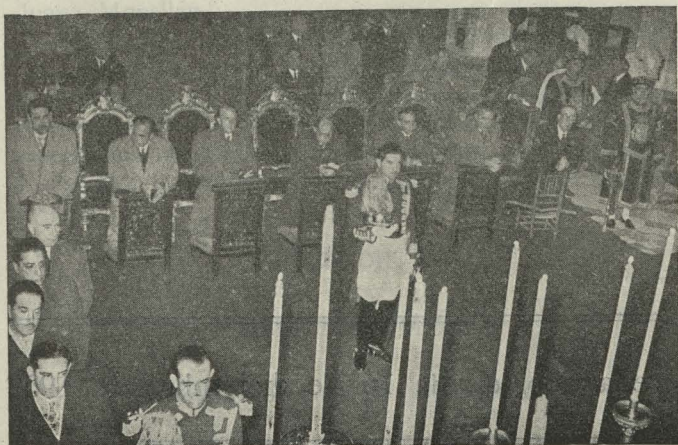
El Alcalde, con la representación municipal que asistió a los funerales celebrados en sufragio de los fallecidos del Ayuntamiento madrileño