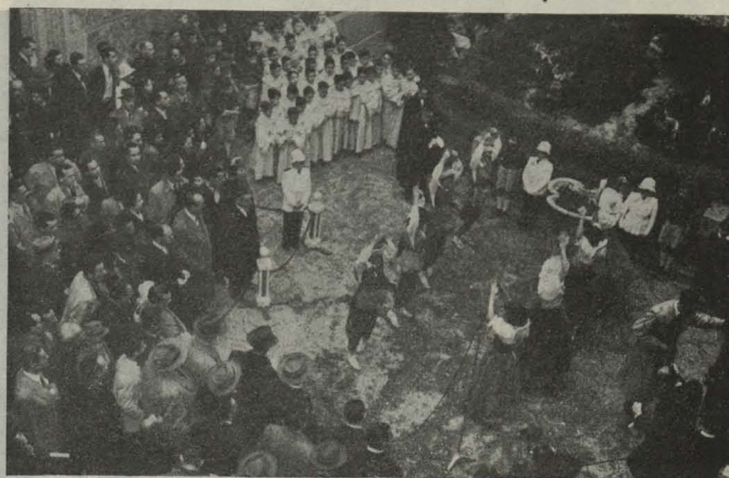
Las niñas del Internado Palacio Valdés bailando ante el Nacimiento instalado en el patio de la Casa de Cisneros del Ayuntamiento

de arte de nuestra Casa Consistorial, y en el patio de Cristales fueron obsequiados con una copa de vino español.