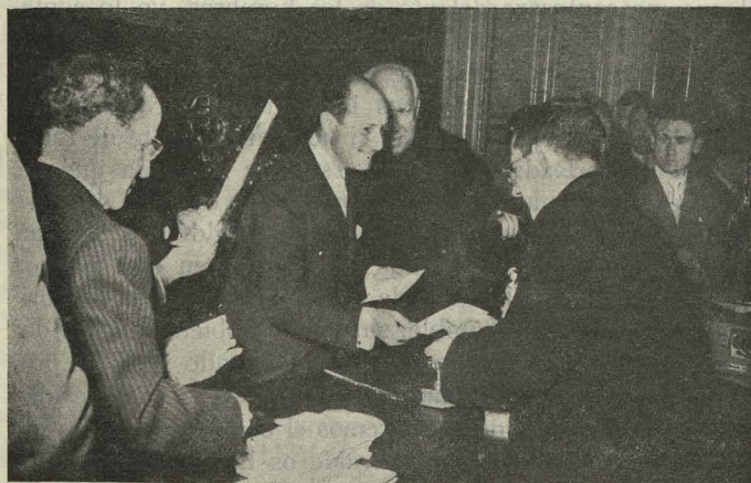
El Alcalde, Conde de Mayalde, haciendo entrega a los Párrocos de Madrid de las cantidades recaudadas en el Ayuntamiento para la campaña de Navidad

En cuanto a los problemas que se refieren a los servicios técnicos, de una parte tenemos aquellos que, aun siendo urgentes, no deben afrontarse hasta tener resuelto el problema económico de la capital; así la necesaria reconstrucción de muchos pavimentos y la urbanización de grandes zonas; el del alumbrado, que se ha de acometer paulatinamente si vivimos con penuria, pero que sería mejor abor-