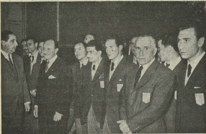
El Alcalde con el Presidente de la Federación Española de Fútbol, D. Sancho Dávila, y los jugadores argentinos de fútbol durante la recepción celebrada en honor de éstos en el Ayuntamiento

Día 1. —En la calle de la Madera se celebró la bendición e inauguración de la primera fábrica automática de pan de Madrid. Al acto asistió, ostentando la representación municipal, el Concejal D. Joaquín Campos Pareja.