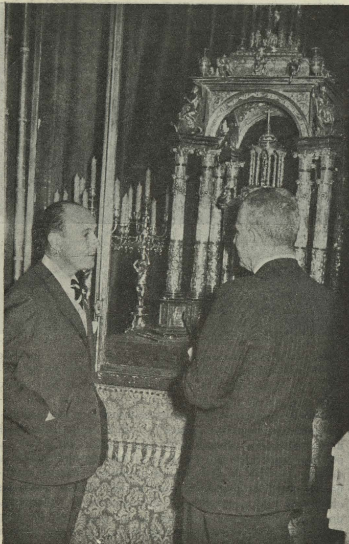
El Alcalde, con el Ministro de Educación Nacional de Costa Rica, contemplando la custodia de plata que se guarda en el Ayuntamiento.