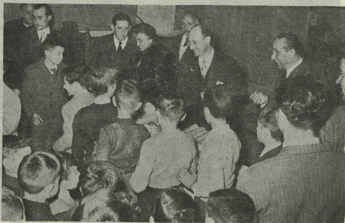
El Alcalde y su esposa, la Duquesa de Pastrana, repartiendo bolsas de dulces a los niños del Internado de Nuestra Señora de la Paloma el día de Nochebuena.

Día 31.—En el salón de Recepciones del Ayuntamiento, el Conde de Mayalde recibió a los setenta y cinco Curas