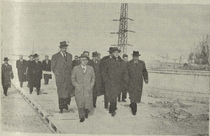
El Ministro de Obras Públicas, acompañado del Alcalde y otras ilustres personalidades, pasan el puente que con el nombre del Alcázar de Toledo será pronto inaugurado

Día 25. —Tuvo lugar la clausura de los actos conmemorativos del centenario de la carrera de Ingeniero industrial.