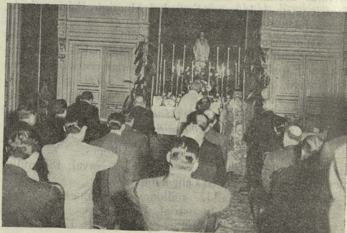
El Patriarca de las Indias Occidentales, Obispo de Madrid-Alcalá, celebrando la misa del Espíritu Santo antes de la constitución del nuevo Ayuntamiento

Finalmente, ante un Crucifijo colocado en la mesa presidencial, y con la mano sobre los Evangelios, los nuevos Concejales juraron la siguiente fórmula: "Juro servir fielmente a España, guardar lealtad al Jefe del Estado, de-