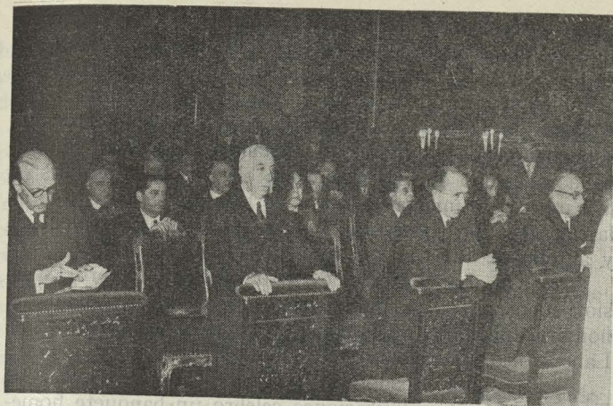
El Alcalde, con los Concejales entrantes y salientes, durante la celebración de la misa del Espíritu Santo