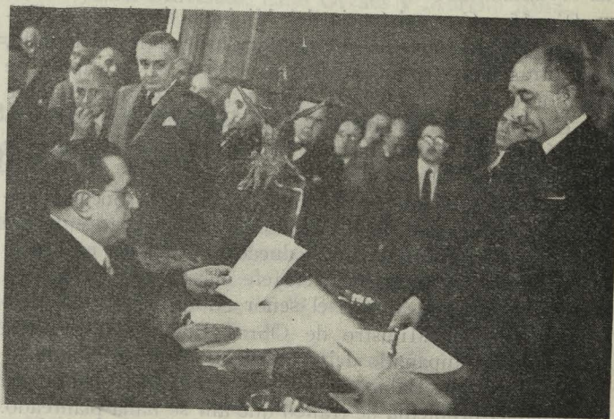
Uno de los nuevos Concejales prestando juramento en el acto de la toma de posesión de su cargo