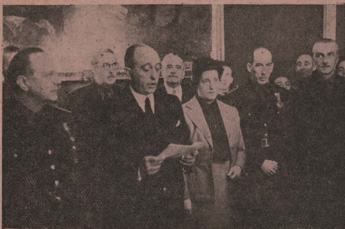
El Alcalde leyendo un discurso durante el acto de imponer la Medalla de Oro de Madrid a la bandera de la Vieja Guardia de Madrid y a la excelentísima señorita Pilar Primo de Rivera

público y del Alcalde y los Concejales, que presenciaron el espectáculo desde los balcones.