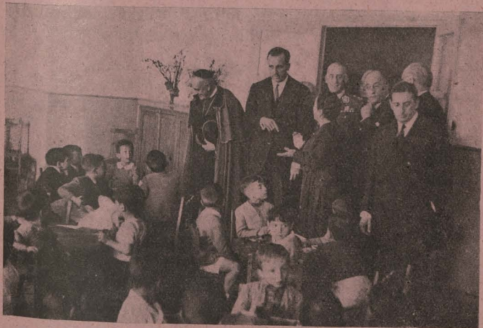
El excelentísimo señor Ruiz Giménez, Ministro de Educación Nacional, con el Alcalde, el Embajador de la Argentina, el Patriarca de las Indias Occidentales y el señor Gutiérrez del Castillo en una de las aulas del grupo escolar República Argentina durante el acto de su inauguración.

Día 17. —En la Primera Casa Consistorial se celebró una recepción en honor de los asistentes a las primeras Jornadas Internacionales de Plásticos. Fueron presentados por el Presidente, señor Martínez Ercilla, y el Alcalde, que estaba acompañado de varios Tenientes de Alcalde y Concejales, después de acompañarlos en la visita a los salones y de contemplar las obras de arte que guardan, les obsequió en el patio de Cristales con un aperitivo.