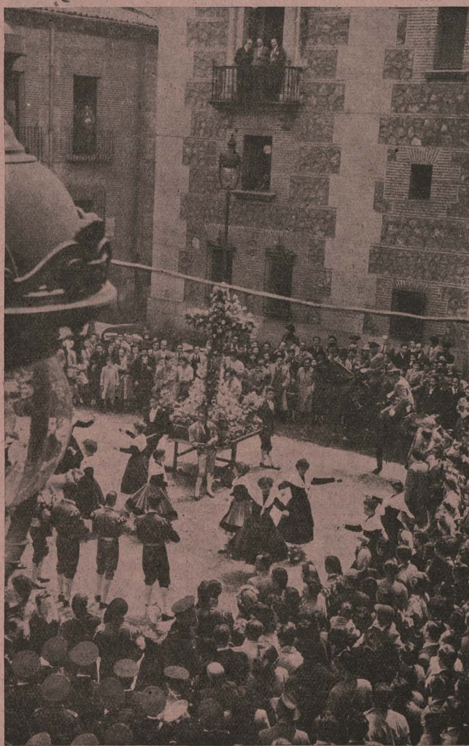
Bailes ante la Cruz de Mayo en la plaza de la Villa

Día 7. —A mediodía, los asistentes a la Asamblea General de Secciones Económicas del Sindicato Nacional de Hostelería visita-