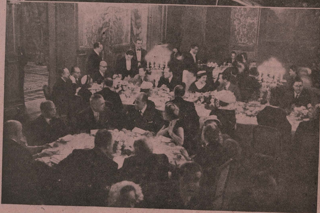
De arriba a abajo: Llegada del Jefe del Estado, Generalísimo Franco, y el Príncipe Regente del Irak a la plaza de la República Argentina, donde esperaba el Ayuntamiento en Corporación.—El Príncipe del Irak y el Alcalde de Madrid durante la visita a la población.—Un aspecto del salón donde se sirvió una cena fría en honor de S. A. R. el Príncipe del Irak