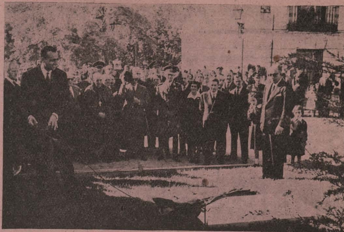
El excelentísimo señor Ministro de Educación Nacional descubriendo la lápida dedicada a Velázquez en la plaza de Ramales