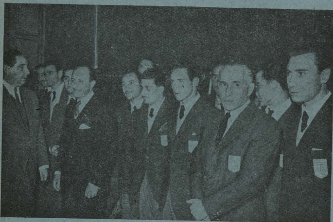
El Alcalde con el Presidente de la Federación Española de Fútbol, D. Sancho Dávila, y los jugadores argentinos de fútbol durante la recepción celebrada en honor de éstos en el Ayuntamiento

Día 1. —En la calle de la Madera se celebró la bendición e inauguración de la primera fábrica automática de pan de Madrid. Al acto asistió, ostentando la representación municipal, el Concejal D. Joaquín Campos Pareja.