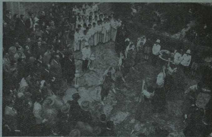
Las niñas del Internado Palacio Valdés bailando ante el Nacimiento instalado en el patio de la Casa de Cisneros del Ayuntamiento

de arte de nuestra Casa Consistorial, y en el patio de Cristales fueron obsequiados con una copa de vino español.