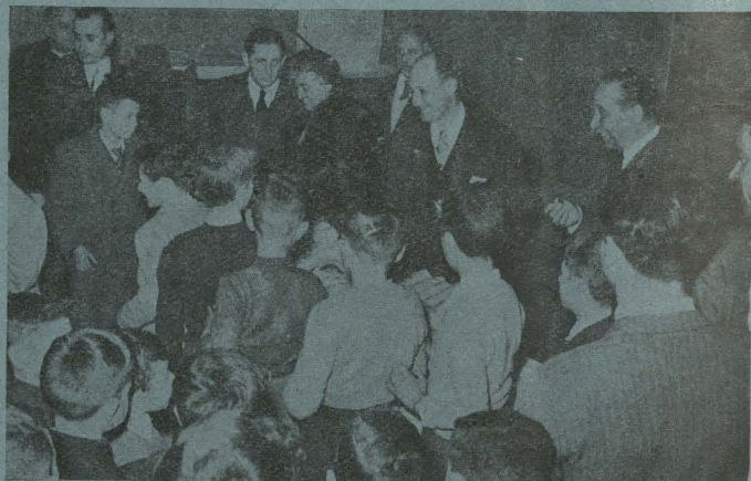
El Alcalde y su esposa, la Duquesa de Pastrana, repartiendo bolsas de dulces a los niños del Internado de Nuestra Señora de la Paloma el día de Nochebuena.

Día 31. —En el salón de Recepciones del Ayuntamiento, el Conde de Mayalde recibió a los setenta y cinco Curas