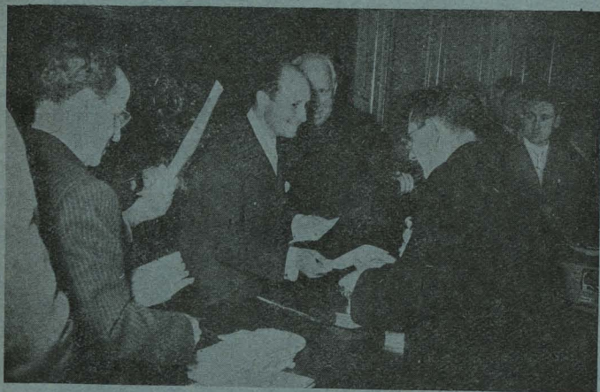
El Alcalde, Conde de Mayalde, haciendo entrega a los Párrocos de Madrid de las cantidades recaudadas en el Ayuntamiento para la campaña de Navidad

Por último, el Conde de Mayalde y la Duquesa viuda de Pastrana repartieron las cantidades recaudadas, por un total de 350.000 pesetas.