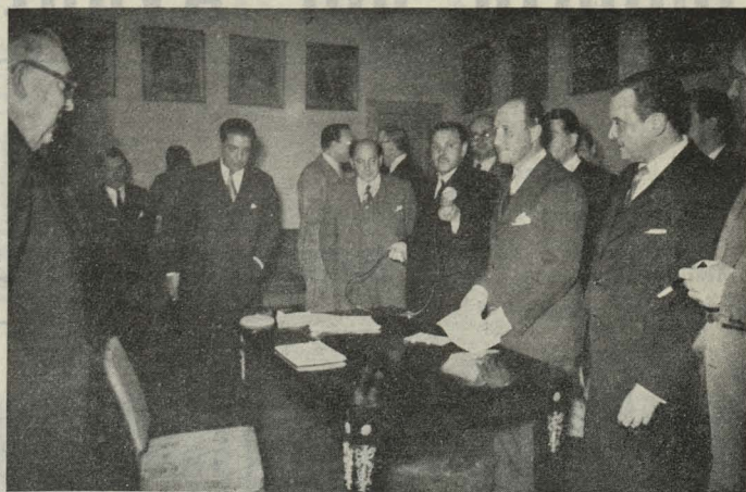
El Conde de Mayalde, Alcalde de Madrid, en el acto de abrir la plica del premio Lope de Vega, celebrado en el teatro Español

—Organizado por la Asociación de Escritores y Artistas Españoles se celebró en el real monasterio de la Encarnación, de Madrid, una misa funeral en sufragio de S. M. el Rey Don Alfonso XIII. Al acto asistió, ocupando un lugar en la presidencia, el Alcalde, Conde de Mayalde.