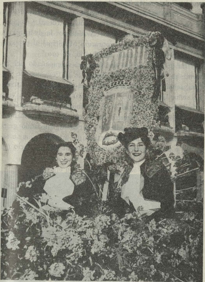
Señoritas que ocuparon la carroza representativa de Madrid en la batalla de flores celebrada durante las fiestas del Carnaval en Niza

Día 4. —En el saloncillo del teatro Español, y en presencia del Teniente de Alcalde Delegado del Ayuntamiento señor Calvo Sotelo, el Director general de Cinematografía y Teatro presentó a la compañía de los teatros nacionales a D. Modesto Higuera, designado Director del teatro Español. Al acto asistieron ilustres personalidades del teatro y cinematografía, así como los actores y actrices de la compañía.