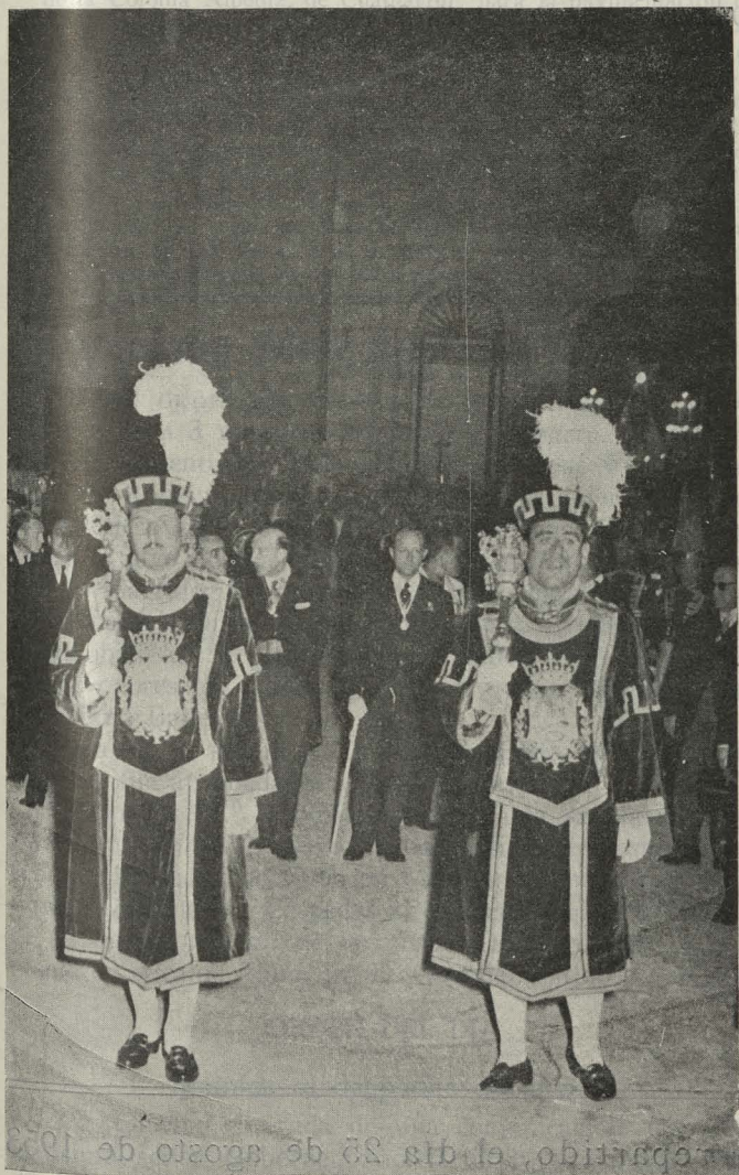
El Ayuntamiento en corporación, presidido por el Conde de Mayalde, durante la procesión de San Isidro

Día 29.—En la zona reservada del Retiro, la Banda Municipal dió un concierto en honor de la Sociedad Española de Otorrinolaringología. El Doctor Hinojar pronunció unas palabras de saludo y agradecimiento por el agasajo que del Ayuntamiento recibían, y el Conde de Mayalde, que hizo los honores en unión de su esposa, la Duquesa de Pastrana, obsequió a los invitados con un refrigerio.