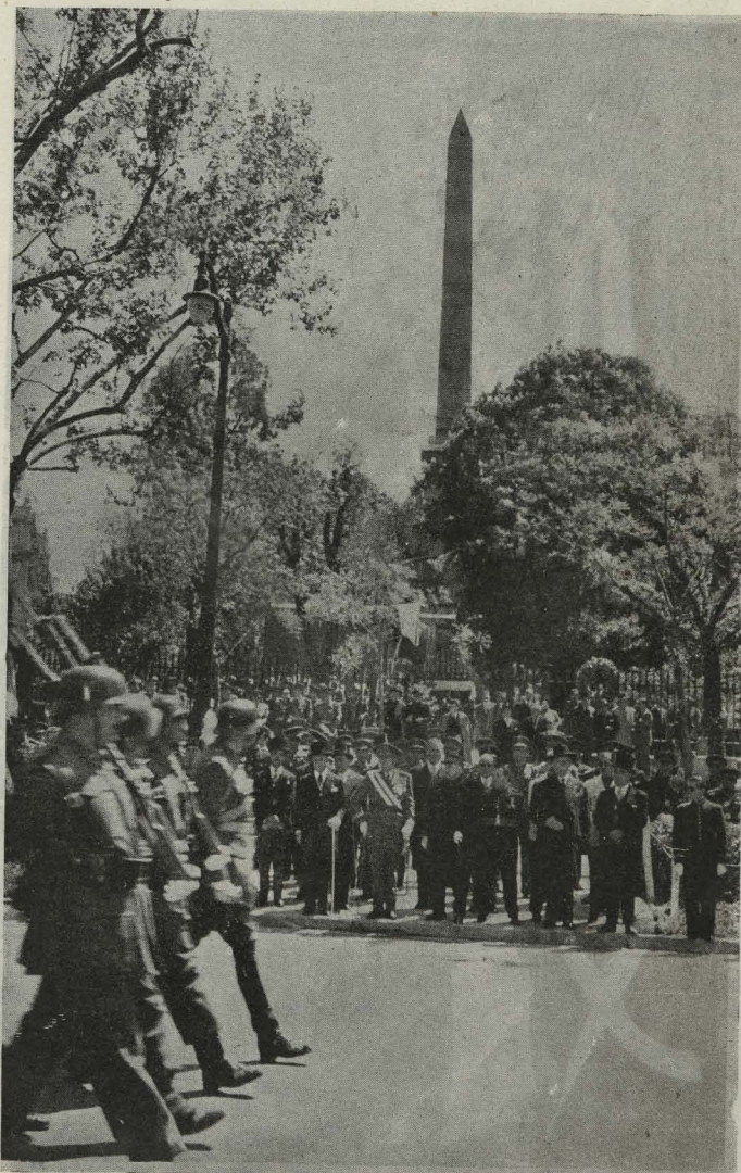
Las autoridades civiles y militares, al pie del obelisco de los Héroes del Dos de Mayo, presencian el desfile militar el día de la gloriosa efemérides