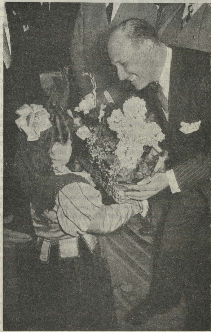
El Conde de Mayalde recibe de manos de una niña del barrio de Maravillas una cruz de flores

—Una Comisión de directivos del Atlético de Madrid, con su Presidente, Marqués de la Florida, hizo entrega al Conde de Mayalde de un artístico trofeo conmemorativo