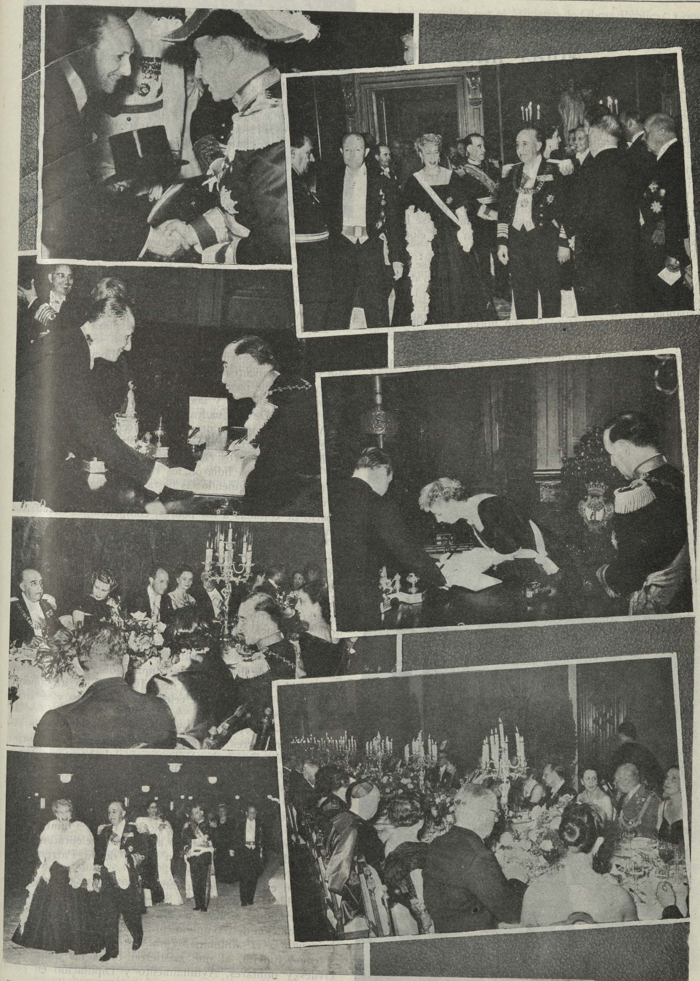
Distintos momentos de la fiesta de gala que ofreció el Ayuntamiento de Madrid al excelentísimo señor Presidente de la República de Portugal, General Craveiro Lopes, con motivo de su visita a esta capital.