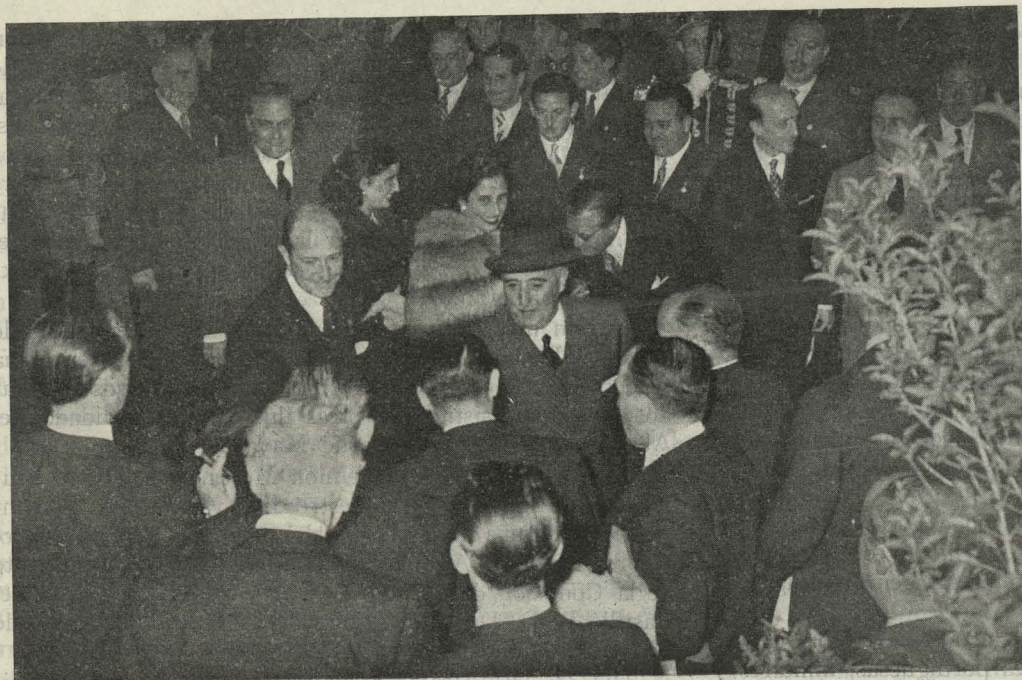
El Jefe del Estado, Generalísimo Franco, y su esposa son saludados por el Alcalde y Concejales a su llegada a la Casa de la Panadería para escuchar el concierto de los Coros Clavé