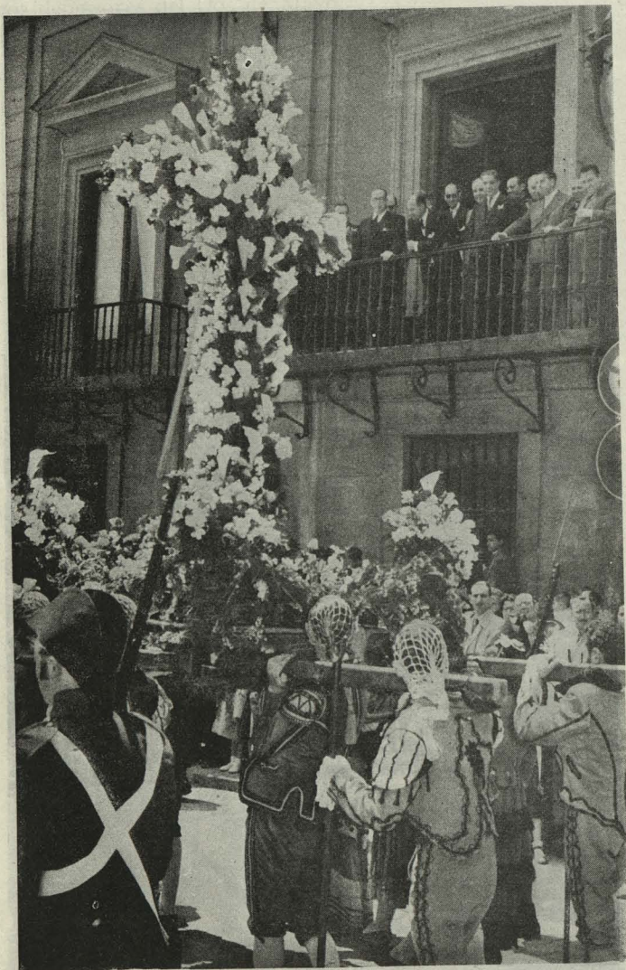
Una monumental cruz de flores es llevada al Ayuntamiento desde el barrio de Chamberí el día de la Exaltación de la Santa Cruz. En el balcón, el Alcalde y varios Concejales

— Llegó a Madrid el Presidente de la República de Portugal, General Craveiro Lopes, acompañado de su esposa. En la estación de Atocha fué recibido por el Jefe del Estado español, Generalísimo Franco, y su esposa, doña Carmen Polo de Franco. En el salón presidencial de la estación y en el andén esperaban a los ilustres huéspedes el Gobierno español en pleno, el Presidente de las Cortes y del Consejo del Reino con los miembros del mismo, Mesa de las Cortes, Junta Política, Subsecretarios y Directores generales, Arzobispo de Sión y Vicario general castrense, Presidentes de la Diputación, del Tribunal Supremo, Consejo de Estado y Tribunal de Cuentas, representaciones