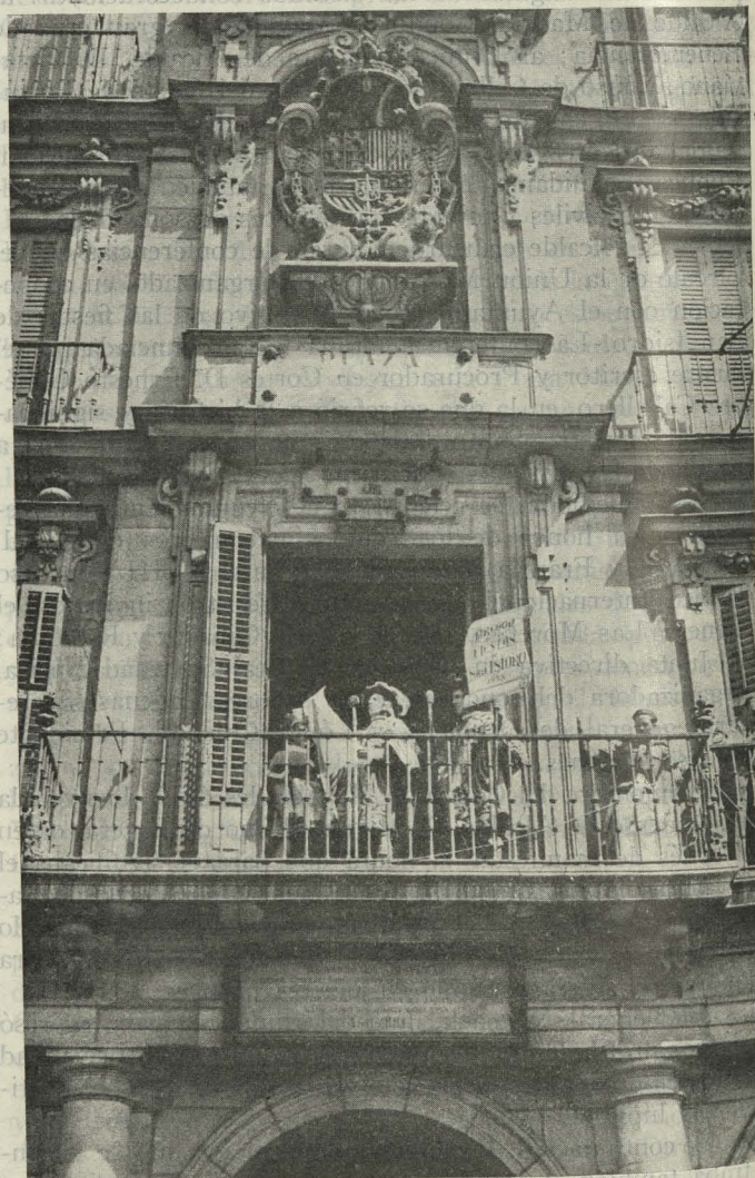
El pregón de las fiestas de San Isidro es leído desde uno de los balcones de la Casa de la Panadería de la Plaza Mayor

Día 28. —El Consejo de Administración de la Mutua Mercantil e Industrial de Incendios visitó al Alcalde para hacerle entrega de un donativo de 25.000 pesetas que, con