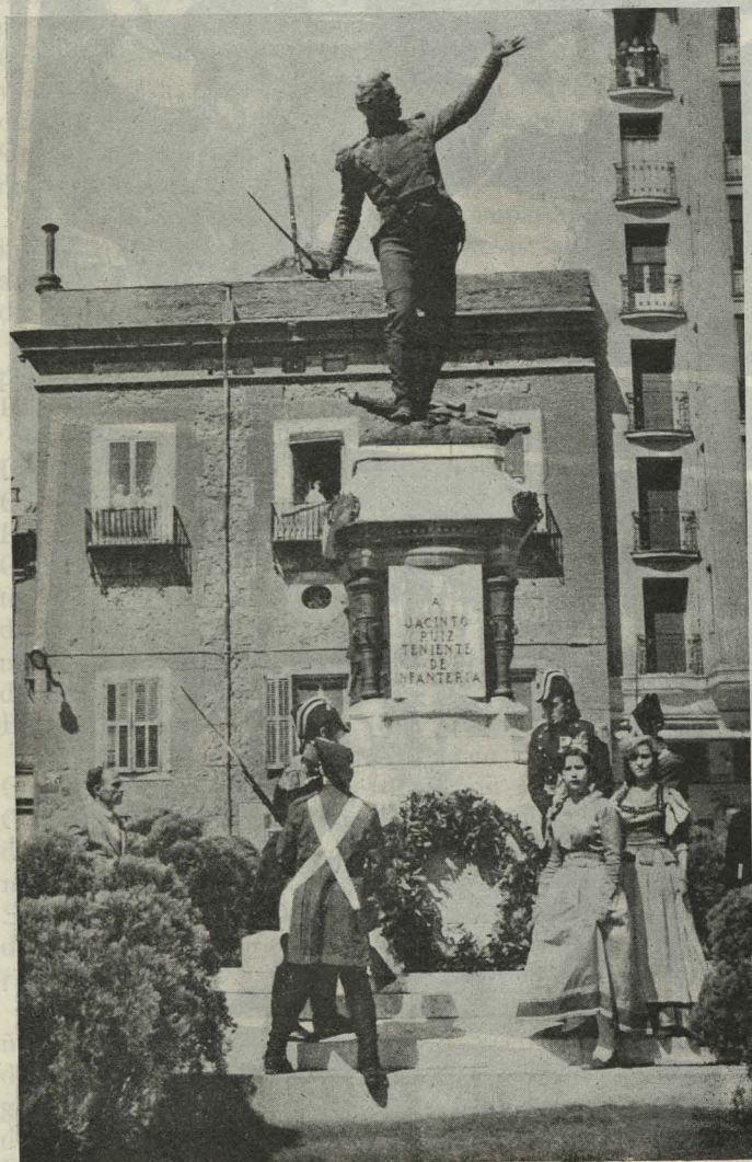
Ofrenda de flores ante el monumento del Teniente Ruiz el día 2 de mayo

Día 2. —La gloriosa efemérides de este día se conmemoró con la tradicional solemnidad. Ante el arco de Monteleón se celebró una misa solemne, organizada por la Orden Española Humanitaria de la Santa Cruz, y en torno al altar, que se hallaba adornado con flores y atributos militares, formó la primera brigada de la Cruz Roja. Terminada la misa, numerosas personas, que se hallaban ataviadas con trajes de majas y chisperos, llevaron coronas de flores naturales al monumento dedicado al Teniente Ruiz en la plaza del Rey; al que simboliza la heroica defensa popular en la glorieta de Quevedo, y a la casa de la calle de la Ternerera donde murió el Capitán Daoíz, otro de los heroicos defensores del Dos de Mayo.