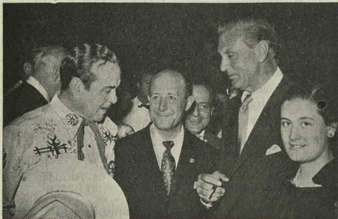
El Alcalde rodeado de algunos artistas de cinematógrafo en la recepción celebrada en el Retiro

Día 14. —En la capilla de la Diputación Provincial se ofició una misa rezada por el alma del insigne patriota don José Calvo Sotelo. Asistieron el Ministro de Obras Públicas, Conde de Vallengano; el Presidente de la Diputación, Marqués de la Valdavia; el Alcalde, Conde de Mayalde; el hermano del finado y Teniente de Alcalde de la Segunda