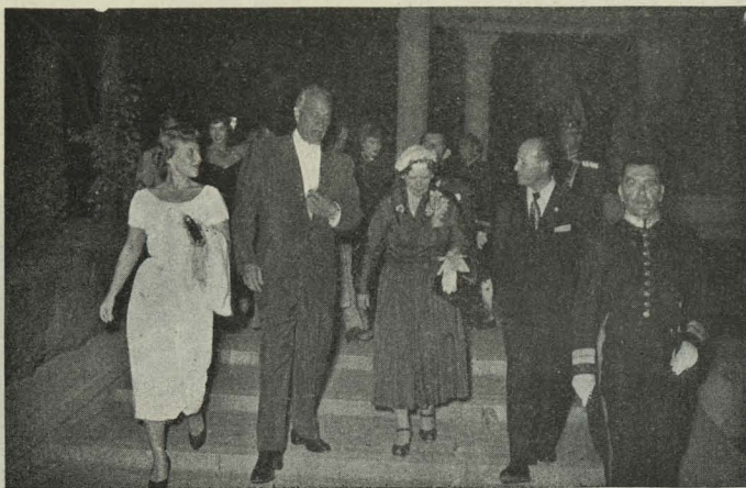
El Conde de Mayalde durante la recepción celebrada en los jardines del Retiro en honor de las personalidades norteamericanas llegadas a Madrid para inaugurar un hotel en el paseo de la Castellana

afectuosas, y el Director del Instituto manifestó el agradecimiento que todos sentían por el agasajo de que eran objeto. Finalmente, el Alcalde, después de acompañarles en la visita a los salones de la Casa, les obsequió con una copa de vino español.