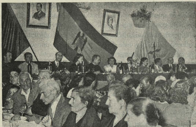
La Duquesa de Pastrana, esposa del Alcalde, preside la comida dada a los necesitados de la barriada con motivo de las fiestas de Nuestra Señora de las Victorias

Día 1. —El Alcalde, Conde de Mayalde, asistió al fallo del concurso de arte culinario organizado por el Sindicato de Hostelería con el nombre de Destreza en el Trabajo.