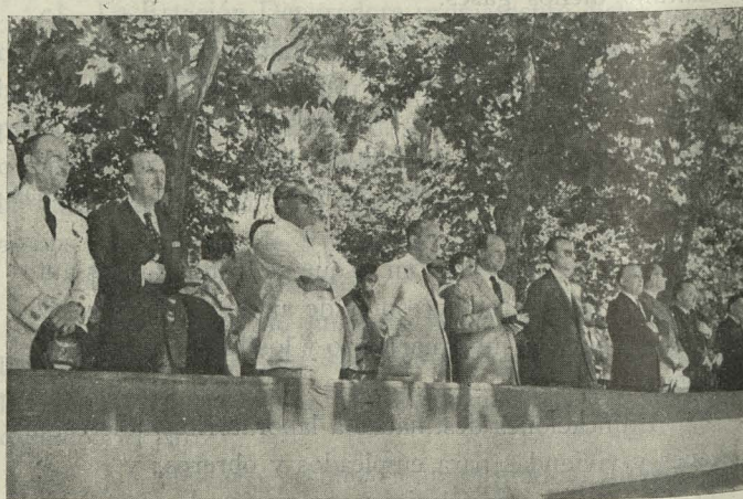
El Alcalde de Madrid, acompañado de varios señores Concejales y personalidades, presencia el desfile de vehículos efectuado en el paseo de Coches del Retiro

Día 10. —En el paseo de Coches del Retiro, ante un altar levantado al efecto, se dijo una misa con motivo de celebrarse la festividad de San Cristóbal, Patrón del Sindicato de Transportes. Asistieron autoridades y jerarquías, que presidieron el acto; el Alcalde, Conde de Mayalde; el Presidente de la Diputación, el Jefe nacional del Sindicato