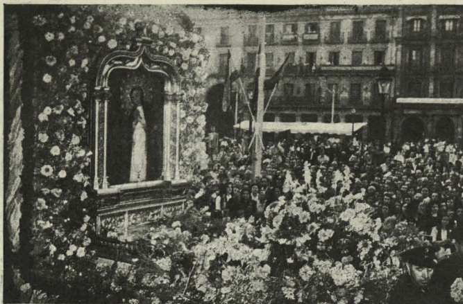
La venerada imagen de la Virgen de la Paloma al llegar a la Plaza Mayor, donde recibió el homenaje del pueblo madrileño.

propio y el de los jugadores por las atenciones que estaban recibiendo en España.