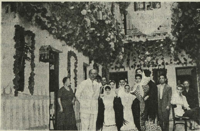
El Alcalde visita uno de los típicos patios de la calle de la Paloma, adornados con motivo de la fiesta titular.

Las calles de la barriada aparecieron engalanadas profusamente, lo mismo que las casas de vecindad, que ador-