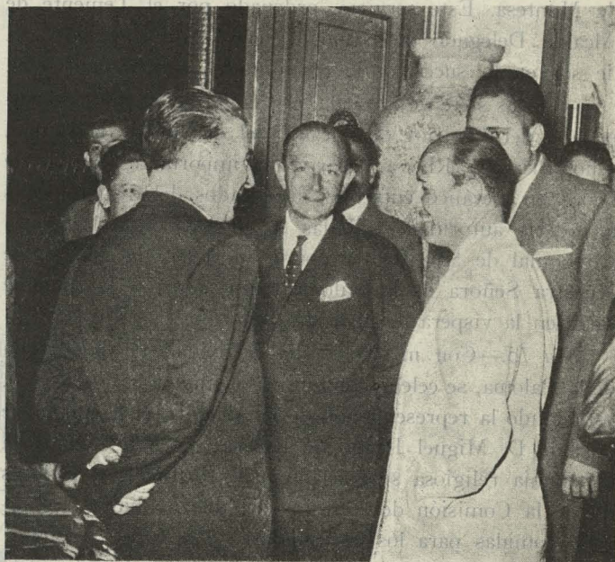
El Conde de Mayalde conversando con los jugadores italianos de pelota-base durante la recepción celebrada en su honor en el Ayuntamiento

— La fiesta de San Lorenzo se celebró con gran entusiasmo en la barriada de Lavapiés. Hubo un programa de festejos populares, conciertos musicales, competiciones deportivas y concursos de fachadas y patios engalanados, siendo muy destacados los de "La Corrala", que llamaron poderosamente la atención de la Prensa y autoridades.