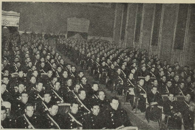
Aspecto del salón de Actos del Parque Móvil de los Ministerios civiles, ocupado totalmente por Agentes de la Policía Urbana y de Tráfico, durante una de las conferencias de la Campaña de la Prudencia

Día 24. —El Alcalde de Madrid dió cuenta de haber recibido un telegrama de la Ciudad del Vaticano concebido