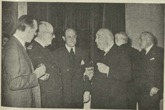
El Alcalde, Conde de Mayalde, conversando con algunos de los invitados a la recepción celebrada en honor del Cuerpo de Ingenieros de Minas con motivo de la conmemoración de su fundación

En nombre de los expedicionarios, D. Julio Burillo, ex Alcalde de Zaragoza, manifestó la gran satisfacción que