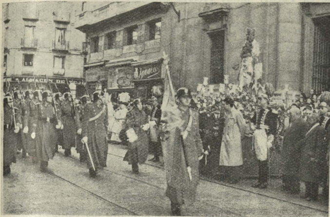
Las fuerzas del Ejército desfilando ante la imagen de Nuestra Señora de la Almudena el día de su traslado a la catedral

Día 2. —Se efectuó el traslado procesional de la imagen de Nuestra Señora de la Almudena, Patrona de Madrid, desde la iglesia de las MM. Bernardas, de la calle del Sacramento, a la catedral basílica de Madrid, donde estará expuesta al culto durante el Año Mariano.