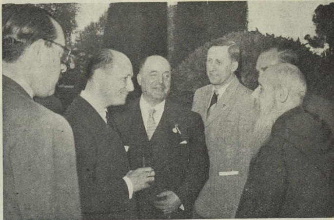
El Alcalde de Madrid, Conde de Mayalde, conversando con algunos de los invitados a la recepción que dió en los jardines del Retiro en honor de los participantes en el IV Congreso Internacional de Ciencias Prehistóricas y Protohistóricas.

Día 22. —En el templo de San Francisco el Grande se celebró una solemne misa para conmemorar el XCIX Ani-