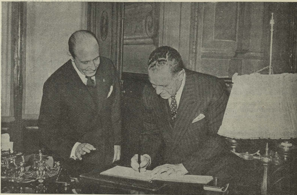
El Secretario de la Liga Árabe, Abdel Jadek Hassuna, firma en el Libro de Oro del Ayuntamiento en presencia del Alcalde, Conde de Mayalde

—Por la noche, el Alcalde de Madrid asistió a una comida que en honor del Secretario de la Liga Árabe, Abdel Jadek Hassuna, se celebró en la Embajada de Turquía en España.