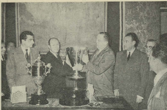
El Alcalde hace entrega al Presidente del Real Madrid Club de Fútbol de la Copa del Ayuntamiento de Madrid por haber conquistado el campeonato nacional de Liga de primera división en la actual temporada.