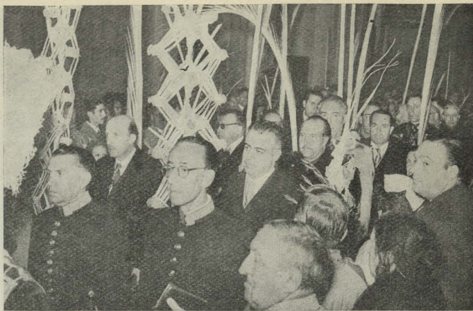
Las Corporaciones Municipal y provincial, en la procesión de las Palmas celebrada en la santa iglesia catedral de Madrid

Día 6.—En honor de los miembros del equipo portugués de rugby, se celebró una recepción en el Palacio Municipal.