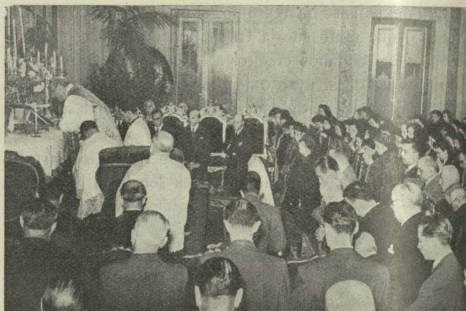
Un momento de la misa final de los ejercicios espirituales que se dieron a los funcionarios municipales, presidida por el Alcalde

Tengo el gran honor de transmitir también los saludos