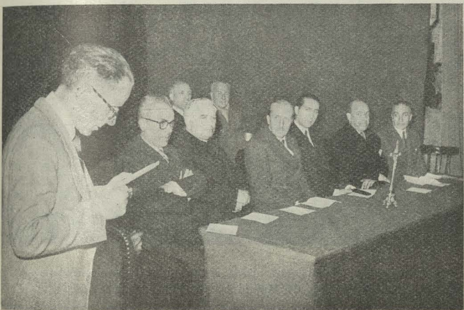
La presidencia del homenaje que se tributó a los obreros municipales de la Hermandad de Nuestra Señora de la Almudena y San Isidro en el teatro Español.

Finalmente, el Conde de Mayalde pronunció un patriótico discurso, en el que recordó con emoción la época que desempeñó la Embajada de España en Berlín, destacando la colaboración de ambos países durante la última guerra y recordando a los soldados alemanes y españoles que convi-