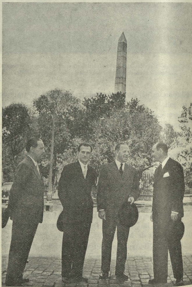
El señor Abdel Jadek Hassuna, acompañado del Conde de Mayalde, durante la visita que hicieron a la ciudad

Día 27. —El Alcalde, con el Presidente de la Diputación, el Embajador de Cuba y otras autoridades, inau-