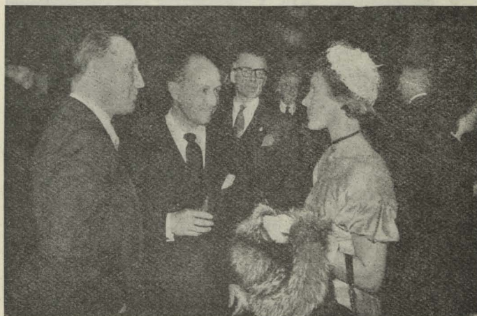
El Alcalde conversando con algunos de los invitados a la recepción celebrada en honor de los asistentes al II Congreso Internacional de la Unión Latina.

Seguidamente, el Ministro del Ejército, excelentísimo señor General Muñoz Grandes, después de agradecer las palabras del Alcalde y la celebración de este acto, hizo el elogio de la tradicional hidalguía del pueblo madrileño. Añadió que "estos divisionarios, en las condiciones más adversas, aislados por completo de la patria, han mostrado al mundo el temple de una raza que no se doblega ante nada y ante nadie". Dijo que la llegada de los repatriados de la División Azul había sido una de las mayores alegrías de su vida, y manifestó su deseo de aprovechar esta oportu-