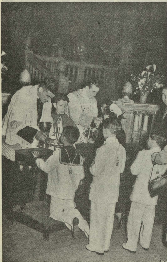
Los niños de los Internados de la Paloma reciben la primera comunión en la iglesia de San Francisco el Grande.

— A las diez de la mañana, en la pradera de San Isidro, se celebró una misa de campaña, organizada por la Sección Femenina de F. E. T. y de las J. O. N. S., terminada la cual se hizo la ofrenda al Santo de los frutos y