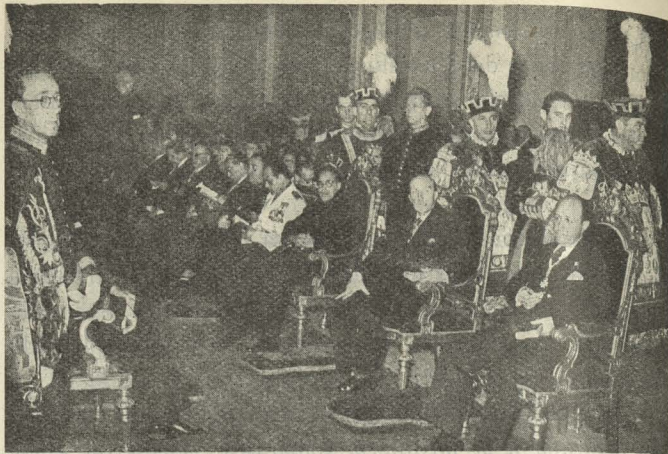
El Ayuntamiento, en Corporación, asiste a la misa de pontifical celebrada en la santa iglesia catedral el día de San Isidro, Patrono de Madrid.

productos hortícolas madrileños, y a continuación, grupos de coros y danzas de la Organización Femenina interpretaron danzas y bailes de la provincia.