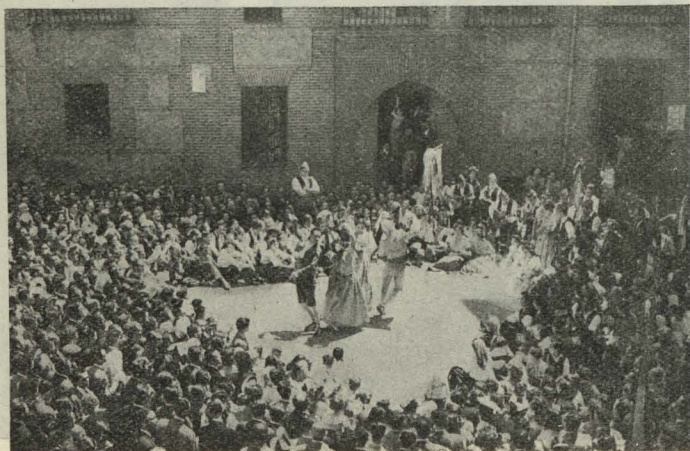
Un momento del homenaje que las Casas regionales tributaron al Ayuntamiento de Madrid.