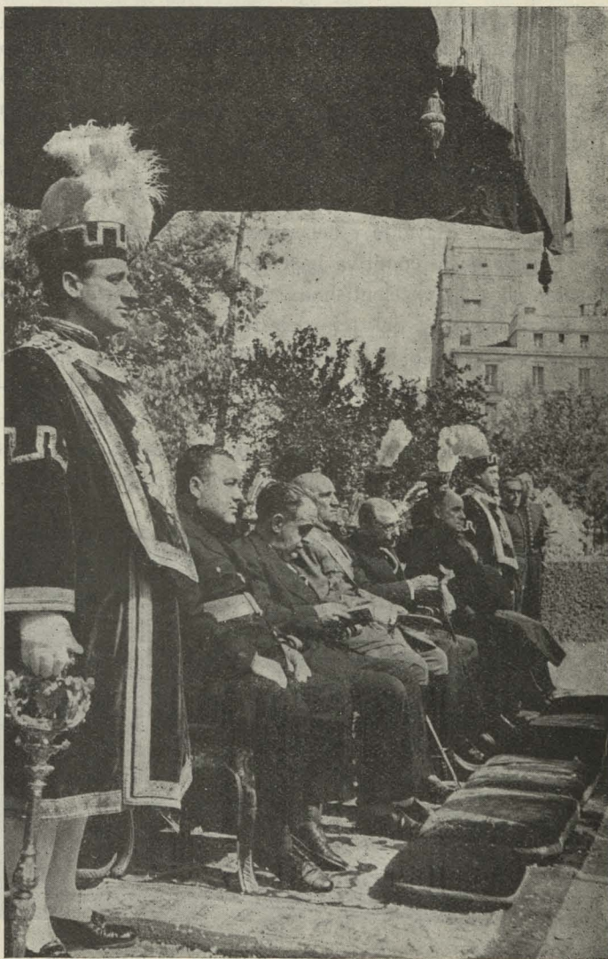
Las autoridades madrileñas durante la misa celebrada ante el obelisco del Dos de Mayo.

Terminada la misa, desfilaron ante las autoridades citadas una compañía del regimiento de Infantería Inmemorial del Rey, una sección de Caballería de Montesa y una batería del regimiento de Artillería.