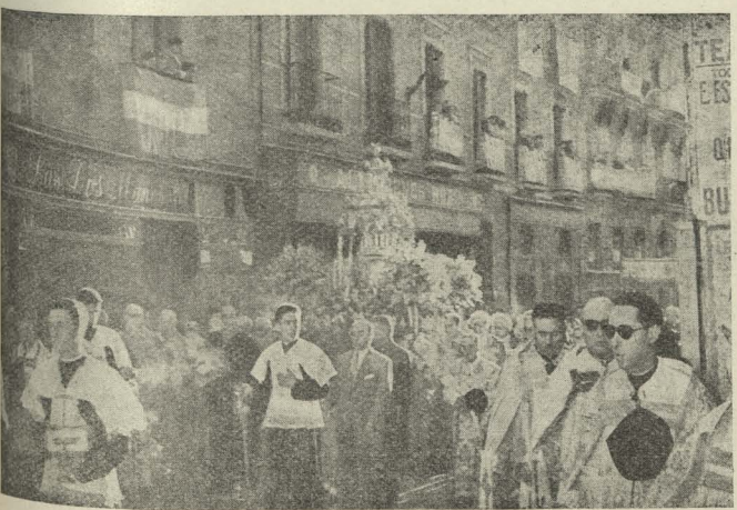
Un momento del paso de la custodia portadora del Santísimo Corpus Christi por las calles madrileñas.