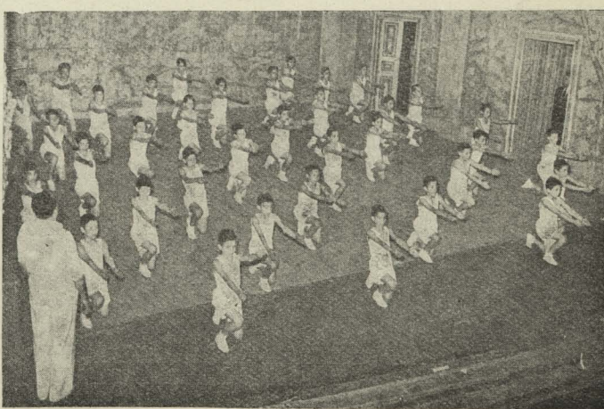
Los niños de los Internados municipales en el escenario del teatro Español durante el festival celebrado el día 21 del corriente.

los Concejales y del Secretario de la Corporación, señor Fernández-Villa, estuvo en el palacio del Gobierno Civil para cumplimentar al General Alvarez Rementería con motivo de su reciente toma de posesión del cargo de Gobernador civil de la provincia.