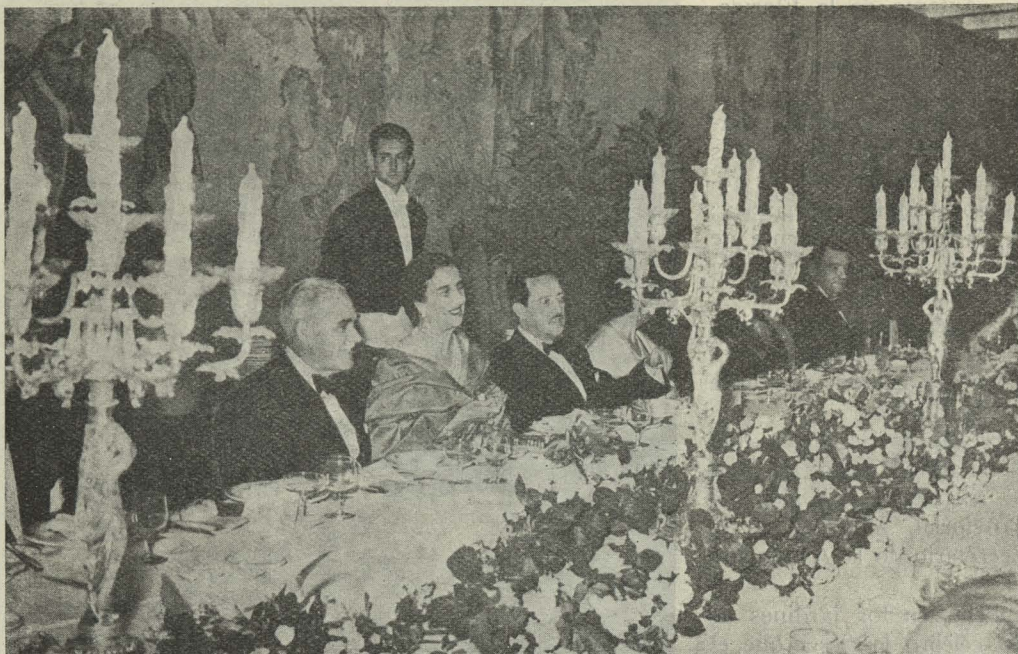
Su Excelencia la señora doña Carmen Polo de Franco preside la comida que se sirvió a los invitados a la fiesta en honor del Concurso Hípico Internacional.