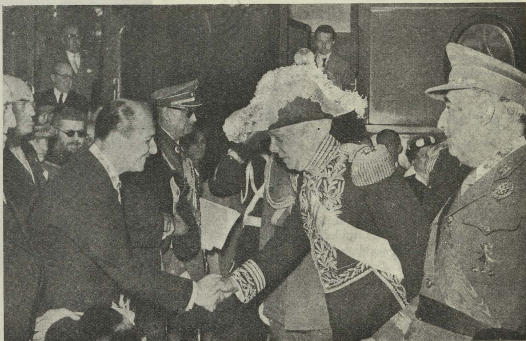
El Alcalde de Madrid, Conde de Mayalde, da la bienvenida en nombre del pueblo madrileño al excelentísimo señor D. Rafael Leónidas Trujillo a su llegada a Madrid.

La Banda Municipal interpretó un selecto programa