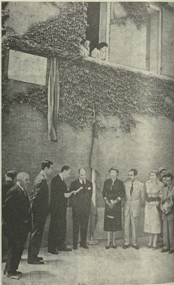
El Embajador de Chile en España y el Alcalde de Madrid en el acto de descubrir una lápida en honor de D. Pedro de Valdivia.