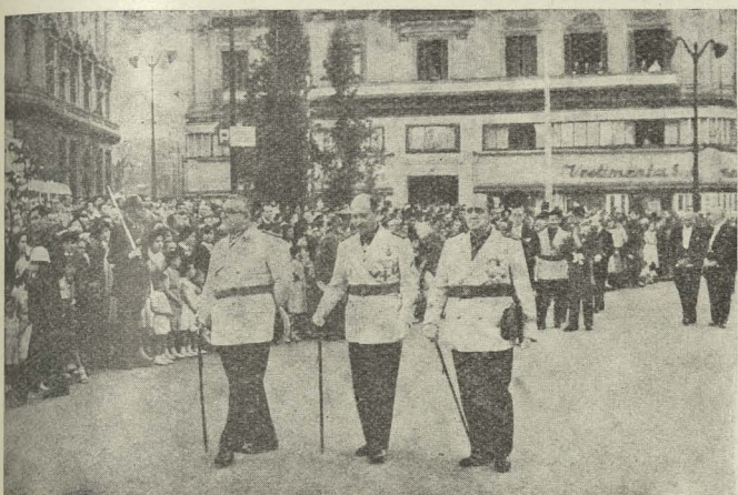
Las autoridades civiles madrileñas presidiendo la procesión del Corpus.

Día 23. —El Ministro de la Gobernación, excelentísimo