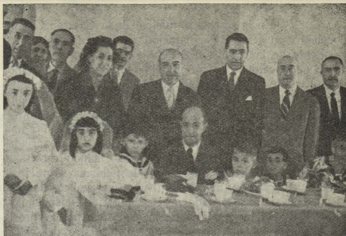
El Alcalde, desayunando entre los niños que hicieron la primera comunión el día del Corpus, pertenecientes a la Hermandad Municipal de Nuestra Señora de la Almudena y San Isidro.

Día 24. —El Embajador de Filipinas en Madrid ofreció una recepción en honor del Vicepresidente de aquella República, accidentalmente en Madrid. Al acto asistió el Alcalde acompañado de su esposa, la Duquesa de Pastrana.