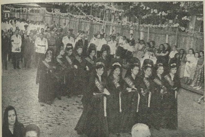
Las Majas de Lavapiés y las autoridades del distrito en la procesión de San Lorenzo

verbena se estaba celebrando con gran esplendor con competiciones deportivas, meriendas y festivales dedicados a los niños y conciertos interpretados por la Banda Municipal, hubo un importante reparto de comidas a los pobres del