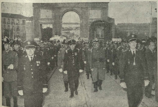
Personal del Cuerpo de Bomberos rodeando la imagen de Nuestra Señora de la Paloma

Como solemnidades religiosas se celebró por la mañana una solemne misa en la iglesia titular, y por la tarde salió