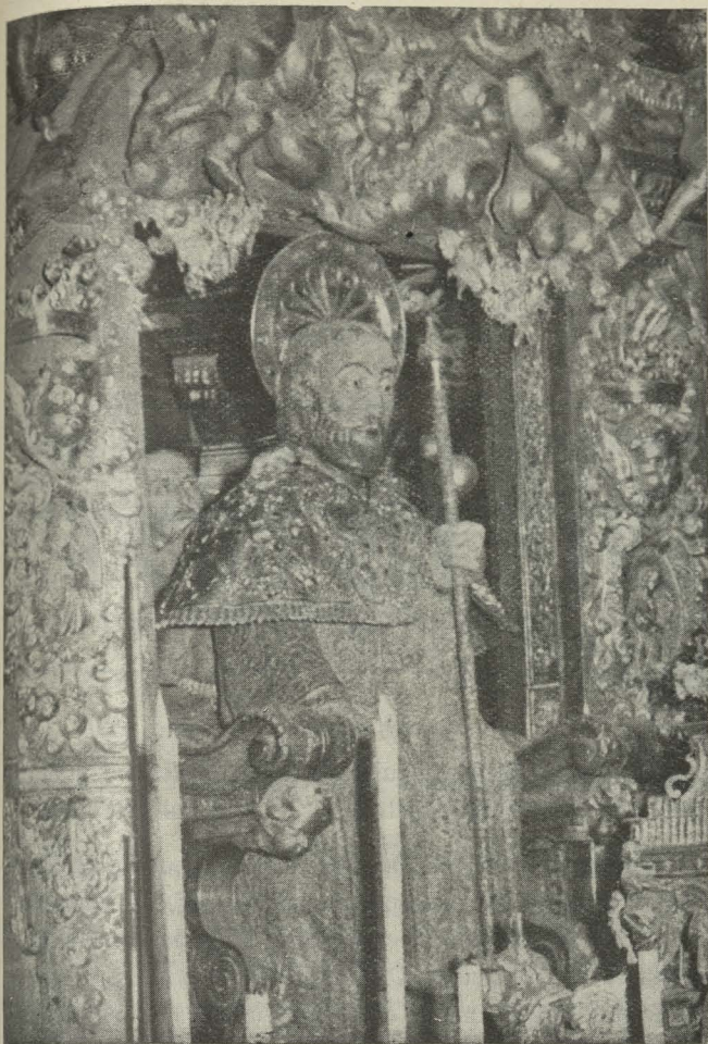
Otro detalle de la ofrenda al Apóstol Santiago

del Puente de Vallecas. Lo presidió el Alcalde en funciones, señor Calvo Sotelo, y asistió numerosísimo público.