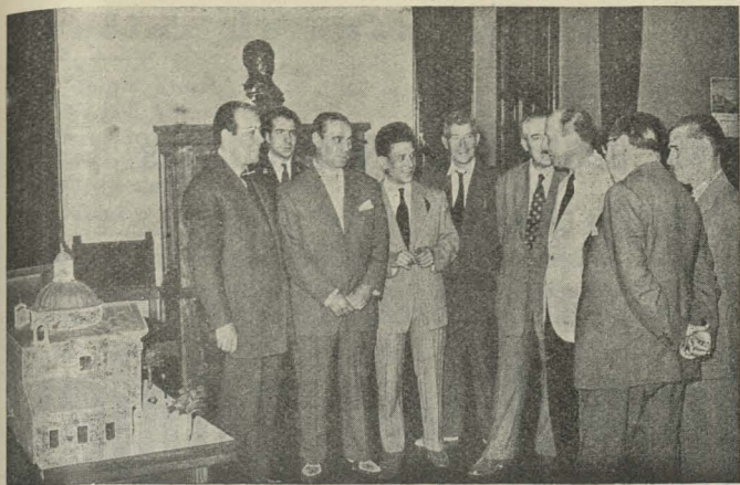
El Conde de Mayalde recibe a la Comisión de Fiestas del distrito de la Arganzuela, que le hizo entrega de una maqueta de la ermita de San Antonio

de San Antonio de la Florida, que estuvo expuesta en la verbena de San Cayetano.