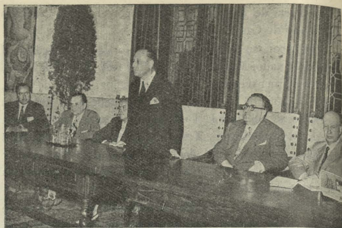
El Alcalde, Conde de Mayalde, pronunciando un discurso en el acto de clausura de la XIX Asamblea de la Federación Española de Centros de Iniciativas y Turismo, celebrada en Madrid

de Alcalde, D. Octaviano Alonso de Celis. En el curso de la cordial entrevista que sostuvieron el Alcalde de Roma invitó al de Madrid a asistir en la capital italiana al Congreso de Capitales que se celebrará en septiembre del año próximo, y cambió impresiones con el señor Alonso de Celis sobre diversos temas municipales. Horas más tarde, el señor Rebecchini emprendió vuelo hacia su punto de destino.