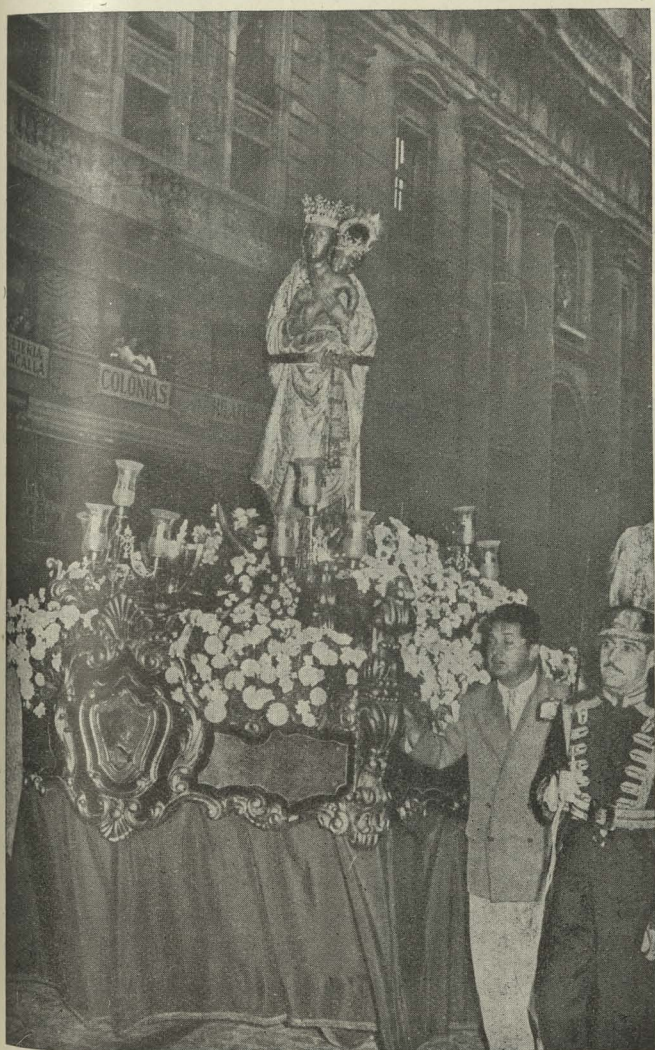
La venerada imagen de Nuestra Señora de la Almudena a su paso por la calle de Toledo durante el desfile procesional celebrado en el día de su fiesta titular