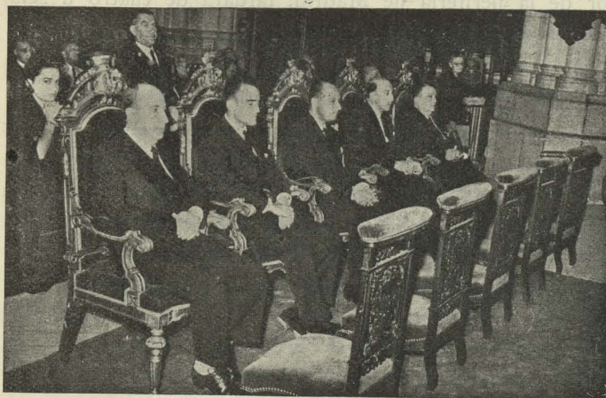
El Conde de Mayalde y otras personalidades asisten al funeral celebrado en sufragio del Conde de Casal, Concejal que fué del Ayuntamiento de Madrid

Día 4. —En el templo de los Jerónimos se celebró un funeral de córpore insepulto en sufragio del alma del excelentísimo señor D. Manuel Escrivá de Romaní y de la Quintana, Conde de Casal, ex Primer Teniente de Alcalde del Ayuntamiento de Madrid, fallecido el día anterior, al que asistieron el Alcalde, Conde de Mayalde, próximo pariente del finado; varios Tenientes de Alcalde y Concejales, académicos y miembros de la nobleza.