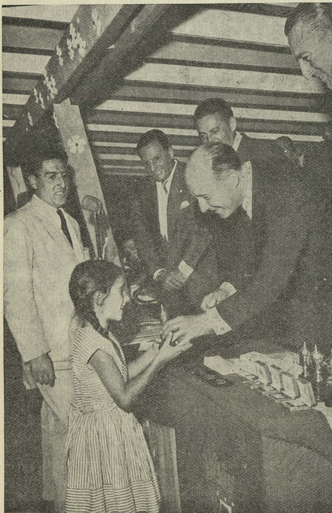
El Alcalde hace entrega de los premios a los vencedores del II Campeonato Escolar de Natación, celebrado en la piscina municipal de la Casa de Campo

Ausente de Madrid el Conde de Mayalde, a quien deseaba ver el señor Rebecchini en su breve estancia en la capital, acudió al aeropuerto de Barajas el Primer Teniente