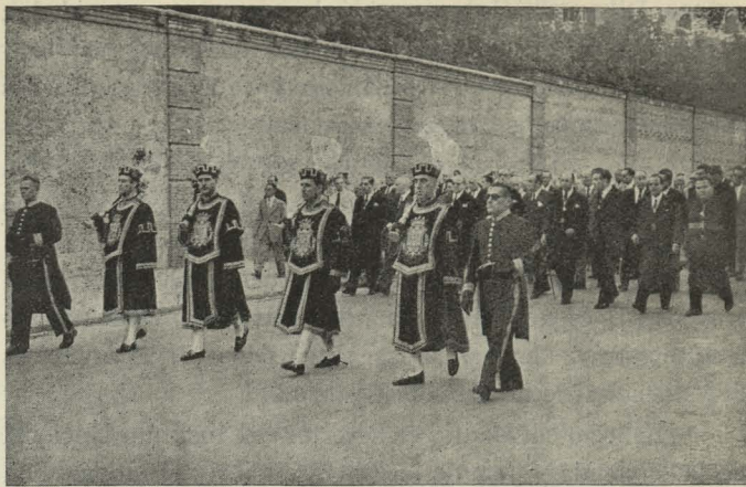
El Ayuntamiento, en corporación, presidido por el Conde de Mayalde, presidiendo el entierro del ex Alcalde de Madrid excelentísimo señor Conde de Limpías

Día 10.—A las seis de la tarde se efectuó el entierro del Conde de Limpías. Presidieron el cortejo fúnebre los fami-