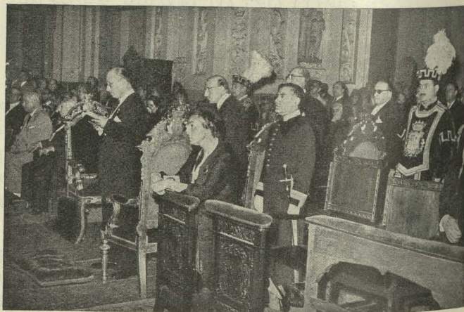
El Alcalde de Madrid y su esposa, la Duquesa de Pastrana, en la solemnidad religiosa celebrada en honor de Nuestra Señora de la Almudena el día del Voto de la Villa

Día 9. —En la iglesia parroquial de Santa Cruz se celebró un funeral, organizado por la Alcaldía y la Junta de