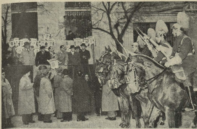
La Guardia Municipal montada durante el desfile organizado en honor de San Antón