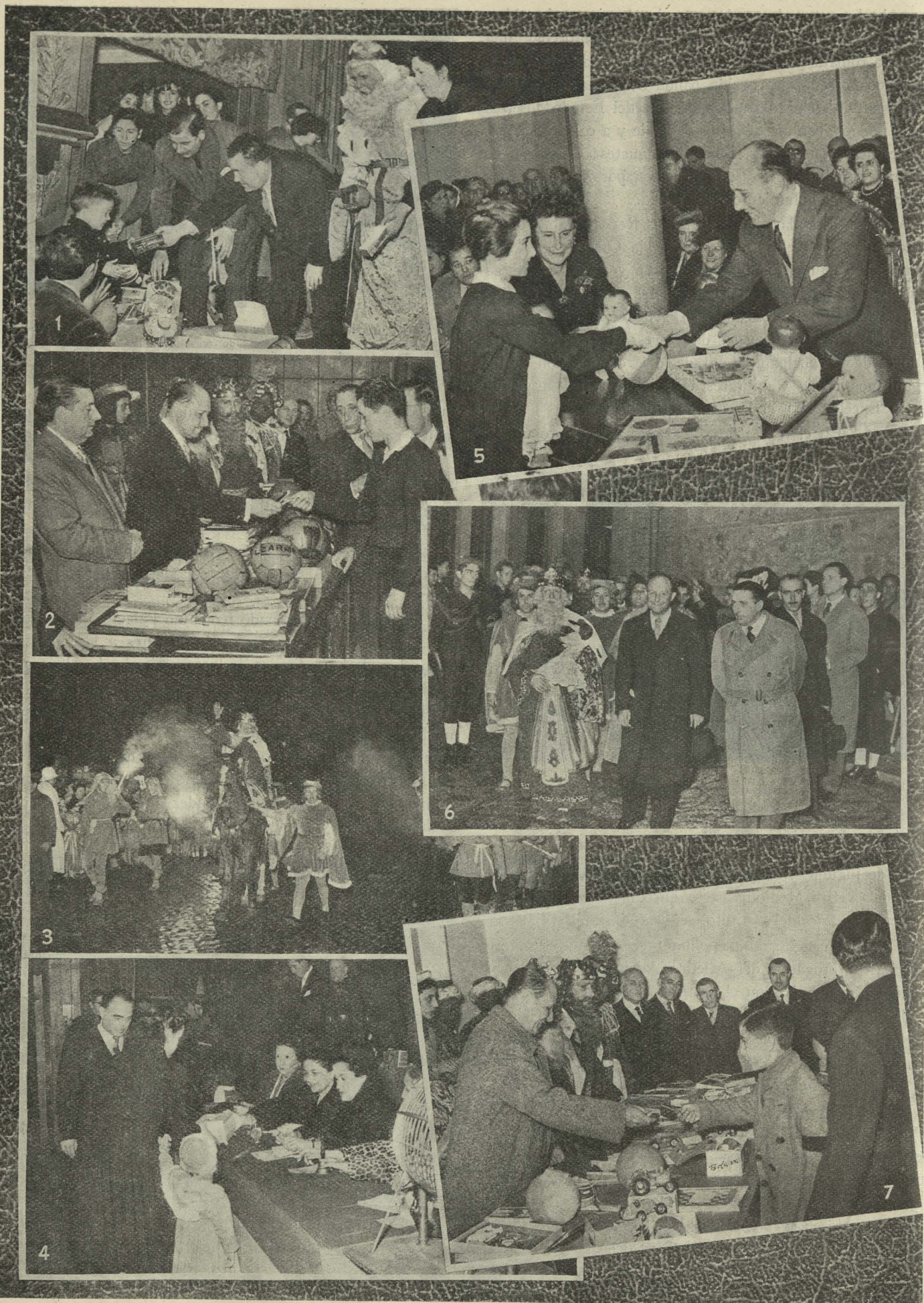
1, El Teniente de Alcalde suplente del distrito del Retiro-Mediodía reparte juguetes a los niños de la barriada.—2, El Alcalde repartiendo los juguetes de Reyes en el Colegio de Nuestra Señora de la Paloma.—3, La cabalgata de los Reyes Magos a su paso por las calles de Madrid.—4, Las señoras del Teniente de Alcalde señor Primo de Rivera y del Secretario general, señor Fernández-Villa, presiden el reparto de juguetes a las niñas hijas de los Guardias de Policía Municipal.—5, El Alcalde en la fiesta de Reyes del Internado femenino Palacio Valdés.—6, Los Reyes Magos, recibidos por el Alcalde y el Teniente de Alcalde Delegado de Festejos, señor Gutiérrez del Castillo, a su llegada al Ayuntamiento de Madrid.—7, Reparto de juguetes en el Internado de San Ildefonso