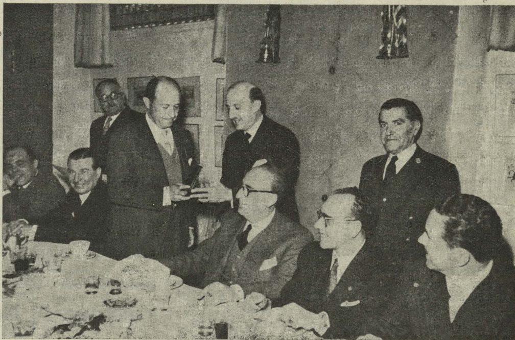
El Alcalde de Madrid hace entrega al Primer Teniente de Alcalde, señor Alonso de Celis, de la Medalla de Madrid, de oro, concedida por acuerdo municipal

Día 30. —El señor Alonso de Celis, en representación del Alcalde, Conde de Mayalde, acudió al aeropuerto de Barajas para despedir al Ministro de Obras Públicas, Conde de Vallellano, que se trasladaba a la Habana.