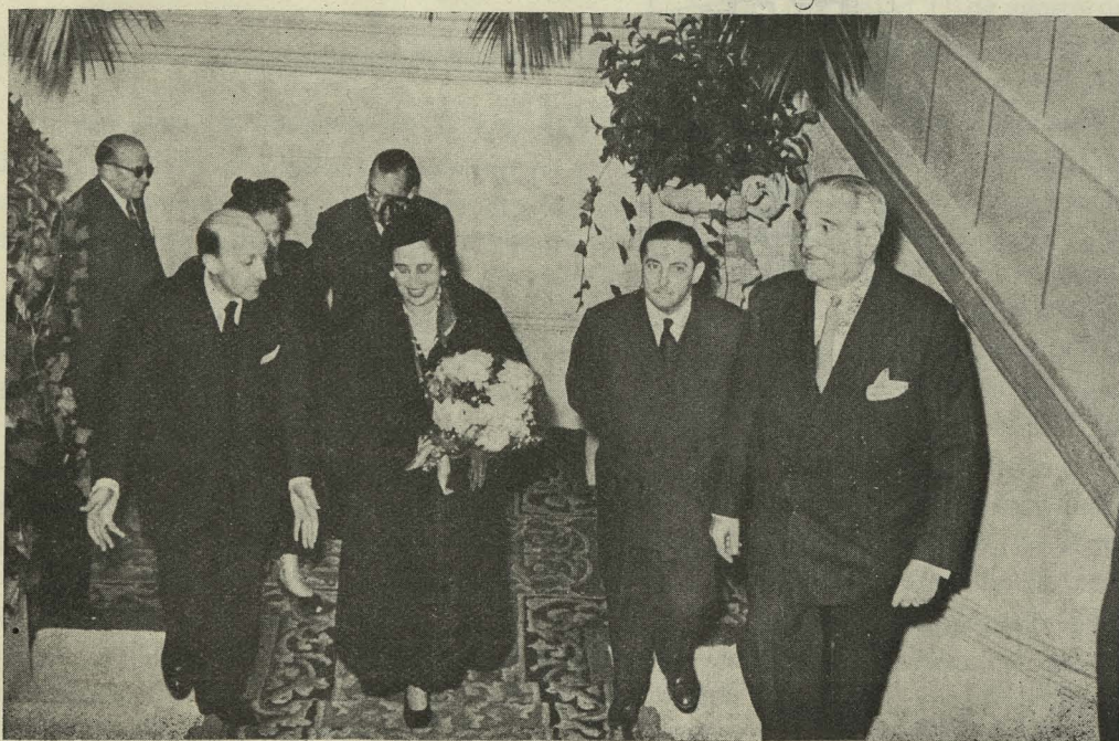
La excelentísima señora doña Carmen Polo, esposa del Jefe del Estado, llega al Ayuntamiento para presidir la velada "Viento de Atardecer"

— A las seis y media de la tarde se formó en el paseo de Coches del Retiro la cabalgata de Reyes, organizada por el Ayuntamiento de Madrid. A todo lo largo del trayecto (calle de Alcalá, Puerta del Sol y calle Mayor hasta la plaza de la Villa) se agolpaba numeroso público, especialmente infantil. A las ocho llegó la cabalgata al Ayuntamiento, en la formación siguiente: tunas universitarias de Madrid, banda del Colegio de San Fernando, de la Diputación Provincial; Guardia Municipal montada, en traje de gala; centurias del Frente de Juventudes, con escuadra de gastadores, banda de tambores y trompetas,