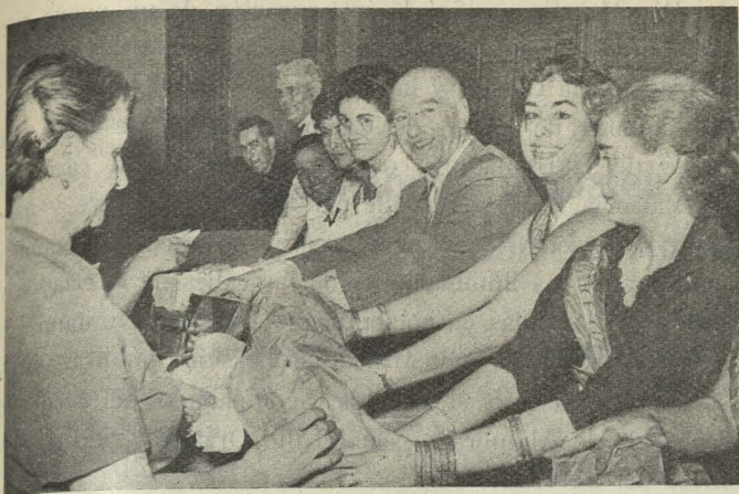
El Teniente de Alcalde de Vallecas, acompañado de señoritas de la barriada, distribuye bolsas de comida a los necesitados, con motivo de las fiestas de Nuestra Señora del Carmen

trofeos del tercer concurso de instalaciones y exposiciones comerciales organizado por el Círculo Mercantil, y la recepción del trofeo ganado por el equipo español en el campeonato europeo de pelota base. El Conde de Cheles, Presidente de la Federación Española de Pelota Base, pronunció unas palabras de agradecimiento a la Corporación Municipal por la amable acogida que le dispensaba, y el Conde de Mayalde clausuró el acto manifestando la satisfacción que producían al Ayuntamiento estas competiciones del arte y del deporte.