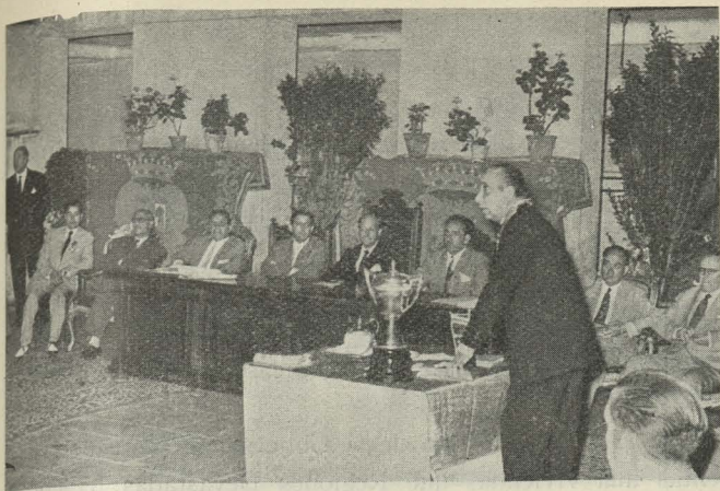
El Director del Internado de Nuestra Señora de la Paloma durante el acto celebrado en dicho Centro con motivo de serle impuestas las insignias de la Orden de Alfonso X el Sabio