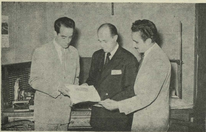
El Alcalde recibe un homenaje de la Prensa mejicana con motivo del envío de rosas del Retiro a la Virgen de Guadalupe