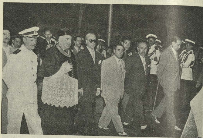
Presidencia de la procesión celebrada en el distrito de Chamberí en honor de Nuestra Señora del Carmen