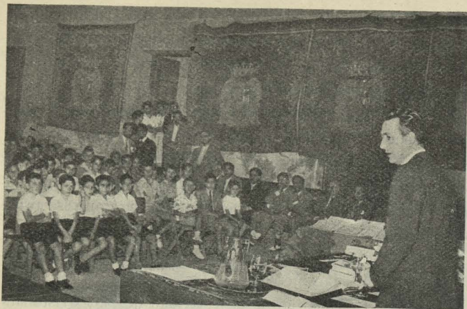
El ilustre escritor D. Dionisio Ridruejo explica la última lección del curso escolar a los niños del Colegio de San Ildefonso