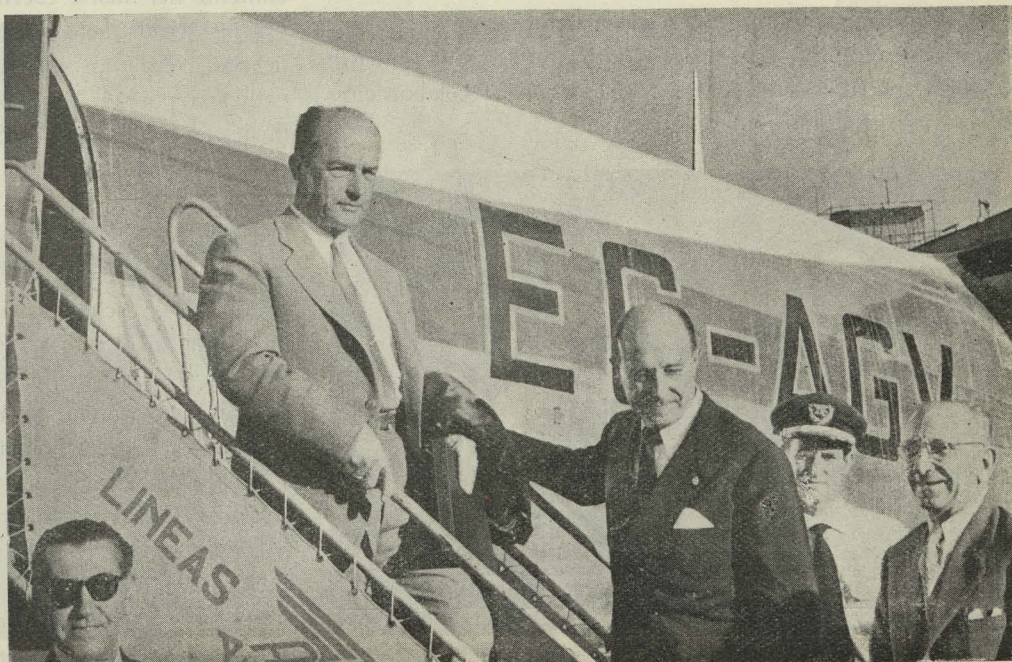
Los Alcaldes de Lima y Madrid en el momento de emprender el viaje a Barcelona