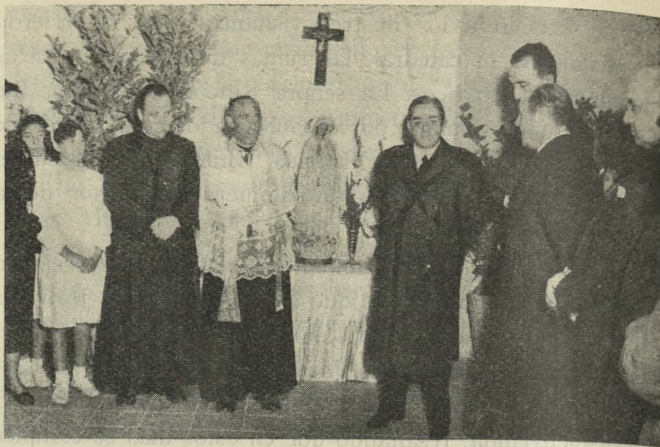
El Ministro de Educación Nacional, señor Ruiz Jiménez, y el Alcalde asisten a la bendición del grupo escolar Concha Espina, en presencia de los familiares de la eximia escritora

de D. Víctor de la Serna para que pusiera su pluma al servicio de tan noble empeño.