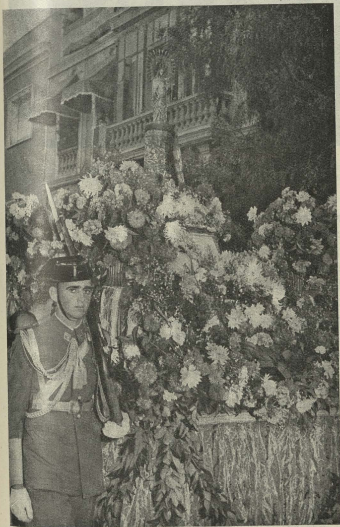
La imagen de plata de la Virgen del Pilar que se guarda en el Ayuntamiento recorre las calles del distrito de Buenavista el día de su fiesta titular

Por la mañana de este día 12, en la Parroquia titular,