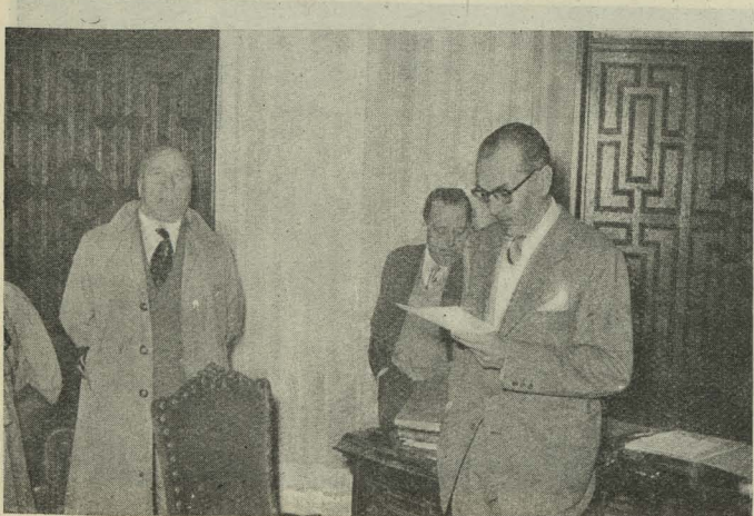
El Teniente de Alcalde del distrito de la Arganzuela en el acto de repartir los premios a los patios más artísticos de la verbena de San Cayetano