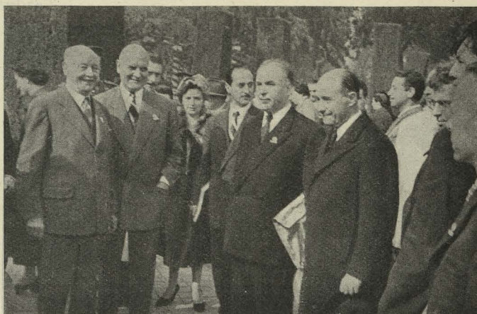
El Alcalde rodeado de algunos de los representantes de naciones extranjeras que asistieron a la recepción celebrada en el Retiro en honor de los participantes en el XXVIII Congreso Internacional de Química industrial

Día 25. —El Ministro de Educación Nacional, señor Ruiz Jiménez, con el Alcalde de Madrid, inauguró tres grupos escolares y las escuelas construídas en el bloque de viviendas de la Empresa Municipal de Transportes.