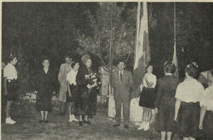
La Alcaldesa de San Juan de Puerto Rico en el momento de arriar banderas en el Internado femenino municipal Tres Cantos

Le contestó con palabras de agradecimiento el Doctor