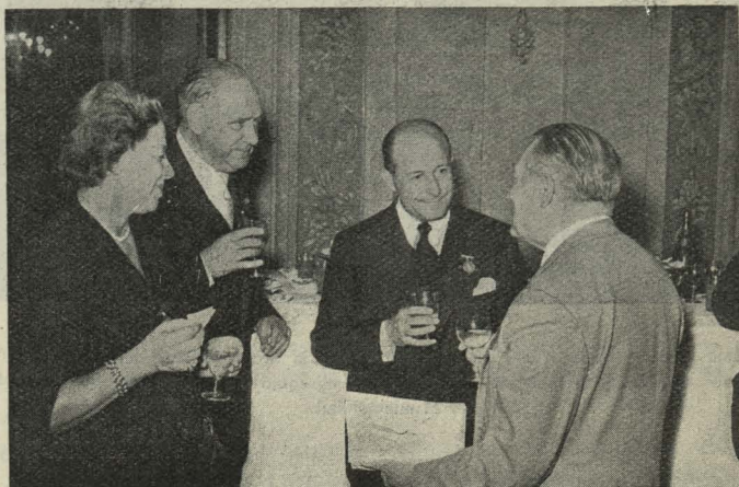
El Alcalde, Conde de Mayalde, conversando con algunos de los participantes en el III Congreso Internacional de Genealogía y Heráldica, durante la recepción ofrecida por el Ayuntamiento

Día 1. —Una representación de la Corporación Municipal, presidida por el Teniente de Alcalde señor López-Quesada, asistió al solemne tedúm celebrado en la iglesia de San Francisco el Grande en conmemoración del Día del Caudillo.