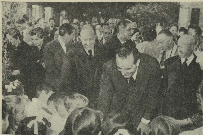
El Ministro de Educación Nacional con el Alcalde de Madrid y otras personalidades en la inauguración del grupo escolar José Antonio, del término de Fuencarral