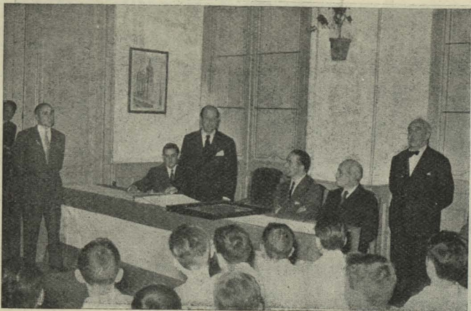
El Alcalde, Conde de Mayalde, en el acto de la inauguración del curso escolar municipal, celebrado en las Escuelas de Aguirre

les son presentados, y finalmente hizo entrega al Conde de Mayalde y al señor Fernández-Villa de un artístico álbum, con las firmas de todo el Profesorado municipal, y de un pergamino en el que se reconoce la gratitud del mismo a las citadas autoridades.