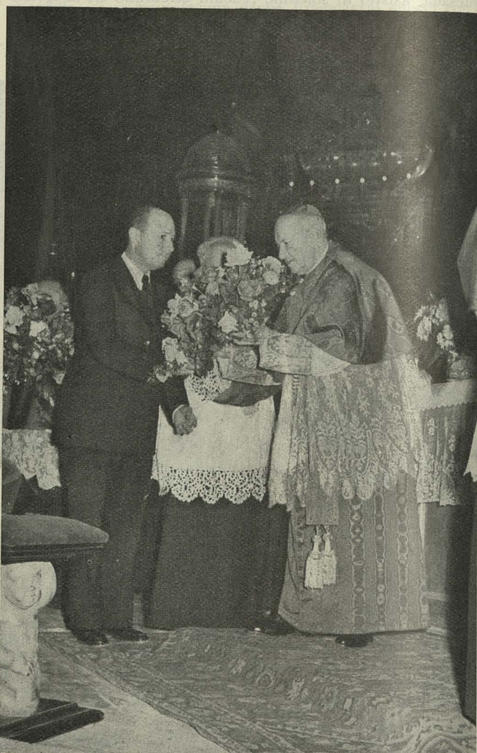
El Alcalde de Madrid hace entrega al Patriarca Obispo de Madrid-Alcalá de las rosas enviadas por los católicos mejicanos para ser depositadas a los pies de la Virgen de la Almudena

El Doctor Eijo y Garay, en presencia del Cabildo catedral, depositó las flores mejicanas y otras aportadas por el Ayuntamiento de Madrid ante la Patrona de la Villa,