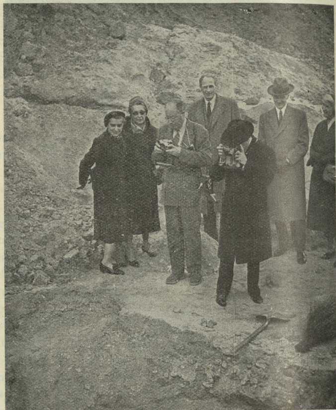
El Alcalde, acompañado de distinguidas personalidades, visita las excavaciones arqueológicas en el Manzanares

Día 15. —El Conde de Mayalde recibió en la Casa de