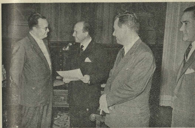
El ex Alcalde de la ciudad norteamericana de El Paso cumplimenta al Conde de Mayalde acompañado del Ministro consejero de la Embajada de los Estados Unidos

Día 16. —Visitó al Conde de Mayalde D. José Edmundo Fresco, Edil de la Junta Departamental de Montevideo, acompañado del Agregado cultural de la Embajada del Uruguay, D. Miguel Víctor Martínez. El Conde de Mayalde les recibió en su despacho oficial y les presentó a los Tenientes de Alcalde y Concejales de nuestro Ayuntamiento, e hizo patente a sus visitantes sus mejores votos por la prosperidad de la Municipalidad uruguaya. El ilustre visitante hizo entrega al Alcalde de Madrid de un mensaje de salutación del de aquella capital y de su Municipalidad.