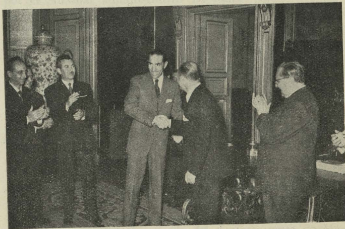
El Alcalde de Madrid saluda al de Córdoba, señor Cruz Conde, al llegar a la Casa de la Villa para asistir a una recepción celebrada en su honor

— Por la tarde, el señor Soler Díaz-Guijarro, en representación del Conde de Mayalde, asistió a la inauguración de la Exposición que en homenaje a la Real Academia de Bellas Artes de San Fernando ofrecía el Ayuntamiento de Córdoba en el Palacio de la Biblioteca Nacional.