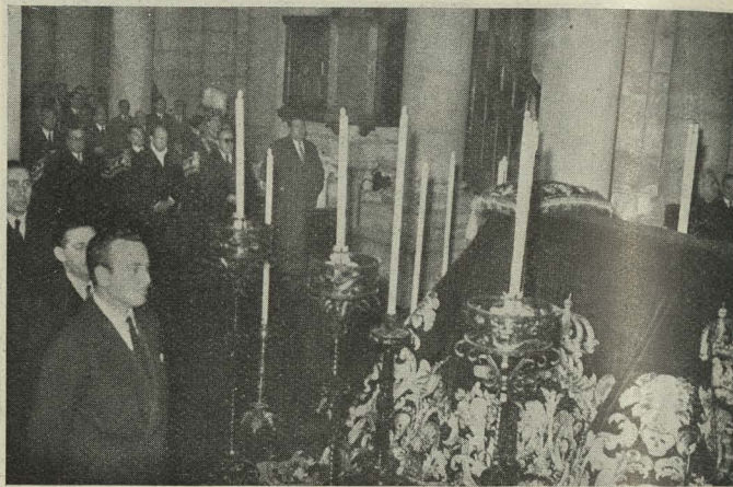
Organizados por el Ayuntamiento de Madrid, se celebran en la cripta de la Almudena solemnes funerales por los Alcaldes, Concejales y personal municipal fallecidos

Día 26. —El Embajador de Venezuela en Madrid ofre-