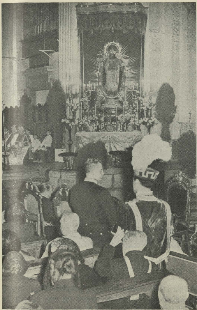
El Alcalde preside la solemnidad religiosa celebrada en la santa iglesia catedral por el aniversario del hallazgo de la sagrada imagen de Nuestra Señora de la Almudena