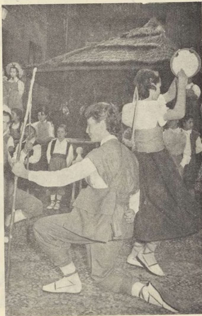
Niñas de los Internados municipales interpretando danzas ante el Belén instalado en la Casa de Cisneros