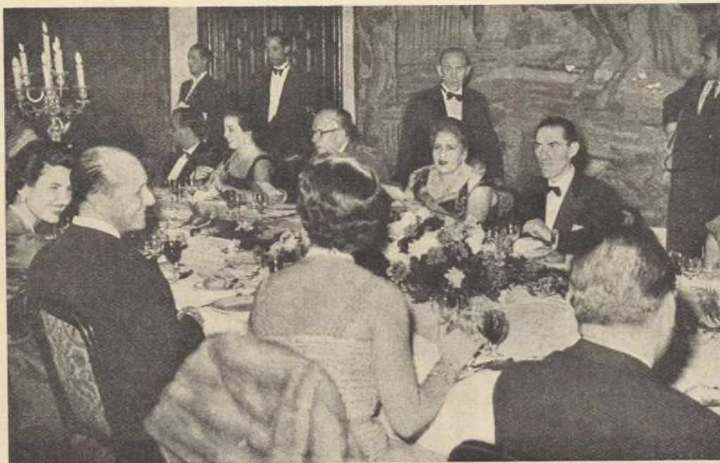
Aspecto del salón de Tapices, habilitado para comedor en la comida ofrecida por el excelentísimo Ayuntamiento al Alcalde y Corporación Municipal de Córdoba