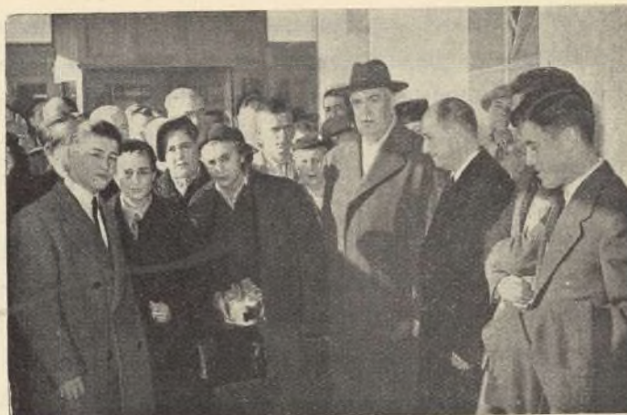
El Alcalde, con su esposa, la Duquesa de Pastrana, y el Ministro de Obras Públicas momentos antes de emprender el viaje a Jordania y Tierra Santa

sido concedida —dijo— por acuerdo municipal, como premio al celo y laboriosidad desplegados en los cincuenta años de servicios prestados al Ayuntamiento, la mayor parte de