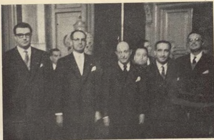
El Alcalde de Medellín (Colombia) visita en la Casa de la Villa al Conde de Mayalde