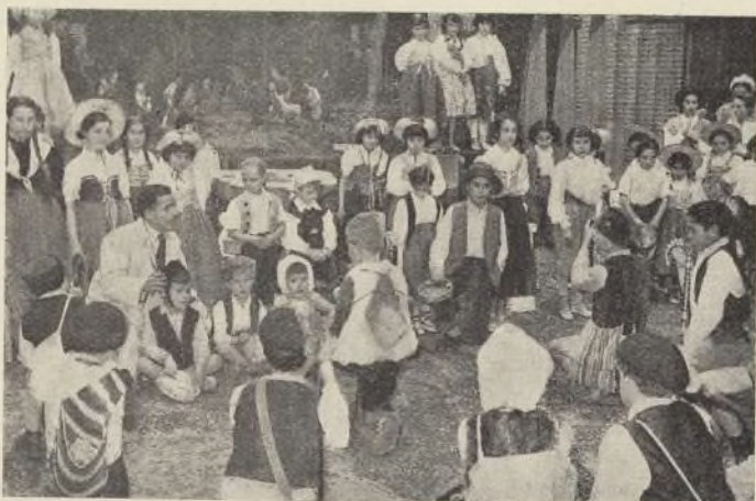
Los niños de las escuelas de Vallecas, con los del Internado Palacio Valdés, ante el Belén del Ayuntamiento