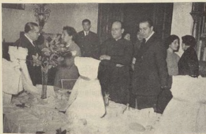
Inauguración de la Exposición de Canastillas en uno de los salones de la Casa de la Villa

Villa la sesión inaugural del ciclo de conferencias que, con el patrocinio del Ayuntamiento, había organizado la Asociación de Belenistas como preparación de las próximas fiestas de Navidad.