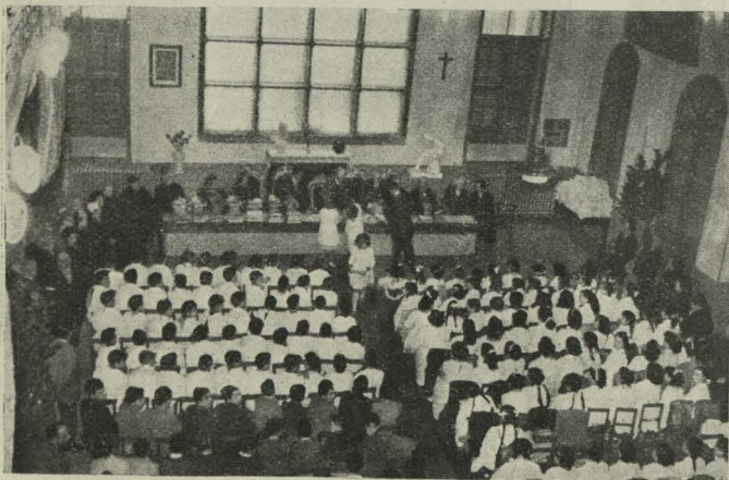
Aspecto del salón de Actos de las Escuelas de Aguirre durante el reparto de ropas y libros, presidido por el Alcalde y el Teniente de Alcalde señor Gutiérrez del Castillo

Día 27. —El Alcalde, Conde de Mayalde, despidió en el aeropuerto de Barajas al Ministro Secretario general del Movimiento, señor Fernández Cuesta, que emprendía viaje