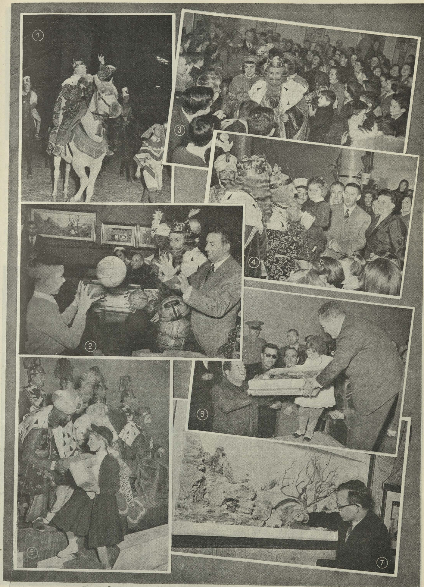
1. Un detalle de la cabalgata de los Reyes Magos.—2. En el Colegio de Nuestra Señora de la Paloma.—3. En el Internado de San Ildefonso.—4. En el grupo escolar Palacio Valdés.—5. En el festival de la Policía Municipal.—6. En la Tenencia de Alcaldía de la Latina.—7. Un detalle del Belén instalado en el Colegio de Nuestra Señora de la Paloma.