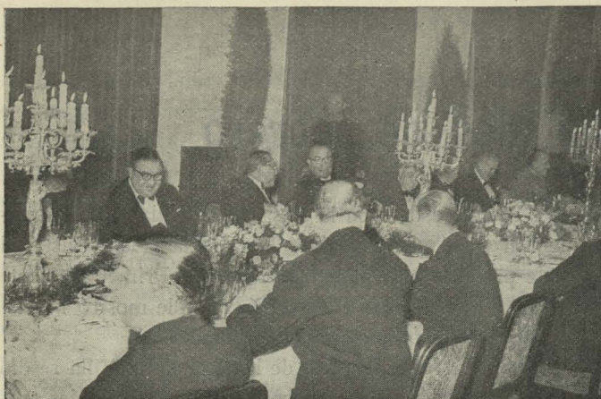
Presidencia de la comida ofrecida por el Alcalde al Embajador de Jordania en Madrid