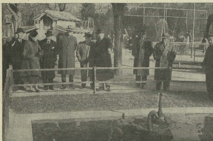
El Embajador de Holanda en Madrid y el Alcalde contemplan los dos cisnes regalados al Ayuntamiento de Madrid por la K. L. M.

— En la Casa de la Villa se celebró una comida, ofrecida por el Alcalde de Madrid en honor del Embajador de Jordania, Emir Hussein Nasser. En el zaguán y escalera de honor figuraba una sección de la Guardia Municipal en traje de gala, y en las galerías altas daban guardia Subalternos de la Casa. La comida se celebró en el salón de Tapices de la Casa de Cisneros, habilitado al efecto; la mesa aparecía adornada con flores y candelabros de plata, con velas encendidas. Con el Alcalde y el Embajador asistieron