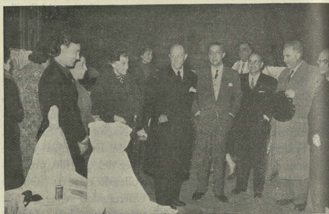
El Alcalde de Madrid, con su esposa, la Duquesa de Pastrana, y el Teniente de Alcalde Marqués de Grijalba durante la inauguración de la Exposición de Canastillas en Tetuán de las Victorias

— Por la tarde, en la Tenencia de Alcaldía del distrito de Tetuán fué inaugurada una Exposición de cien canastillas y veinticinco cunas que, confeccionadas por la Sección Femenina del distrito en colaboración con la mencionada