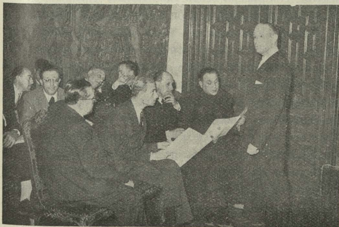
Un momento del acto de la primera audición de las composiciones municipales propuestas para marcha del Concejo madrileño

Día 8. —El Embajador de Irlanda en Madrid, doctor