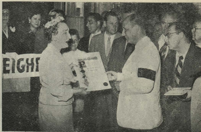
El Alcalde de Madrid recibe el homenaje de la ciudad de San Antonio de Texas