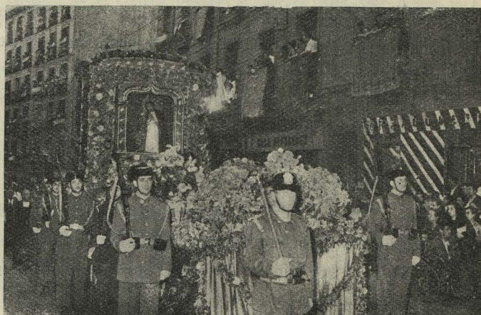
La venerada imagen de la Virgen de la Paloma en las calles madrileñas, en medio del fervor popular