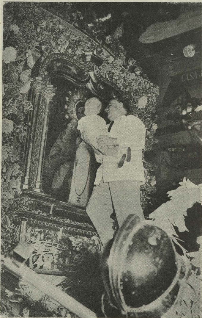
Un momento del ofrecimiento tradicional de niños a la Virgen de la Paloma con motivo de la fiesta titular