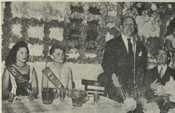
El Alcalde dirige un saludo al vecindario del distrito de Lavapiés en una fiesta verbenera