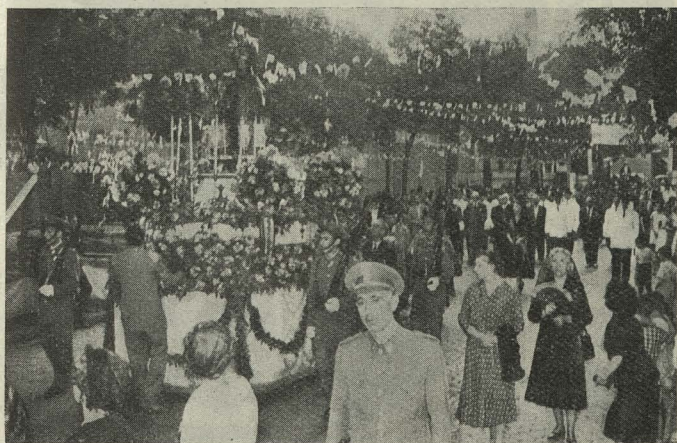
La imagen de San Lorenzo desfila por las calles del distrito del Retiro-Mediodía durante las fiestas patronales

Día 10. —En el distrito de Retiro-Mediodía se celebró