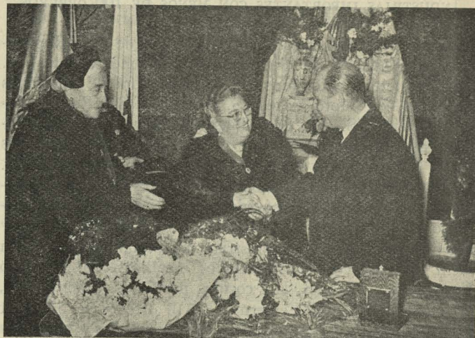
Después de imponer la Cruz de Alfonso X, el Sabio, a la Directora del grupo escolar Ruiz Jiménez, el Alcalde la felicita en presencia de la señora viuda de Ruiz Jiménez, titular del grupo

des reiteraron el pésame a la viuda e hijos del infortunado Guardia.