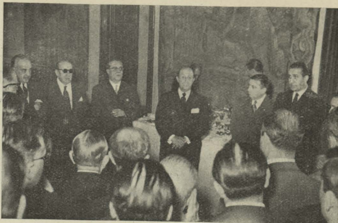
El Alcalde se dirige a los Jefes del Ayuntamiento en la recepción de fin de año

Día 31.—Invitados por el Alcalde se reunieron en uno de los salones de la Casa de Cisneros los Jefes de los Servicios y Secciones municipales; el Conde de Mayalde, después de unas palabras de salutación, felicitó a todos los fun-