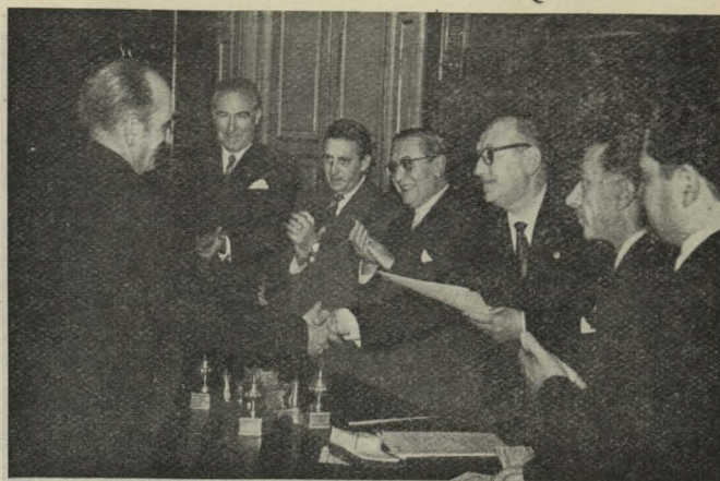
Un momento del acto de entrega de los premios concedidos a los comerciantes e industriales de Madrid en el concurso de escaparates

—En el Círculo de la Unión Mercantil se celebró un acto dedicado a la memoria del ilustre comediógrafo madrileño y premio Nóbel don Jacinto Benavente, con motivo del cuarenta y nueve aniversario del estreno de Los intereses creados .