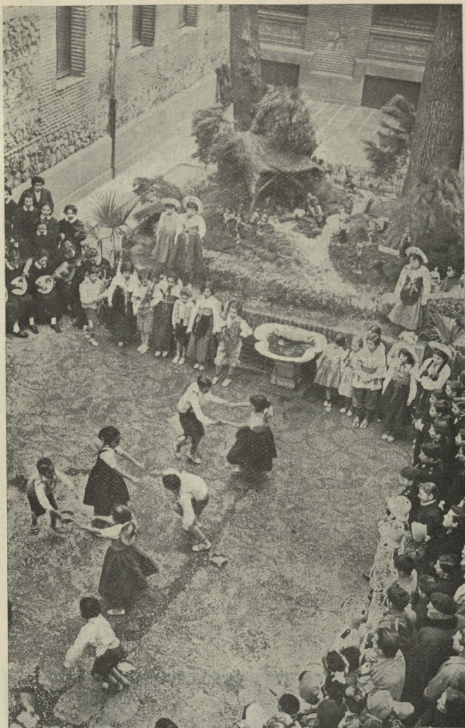
Los niños de las escuelas municipales bailan ante el Belén instalado en el patio de la Casa de Cisneros del Ayuntamiento

tística obra de los comerciantes que en este aspecto ponen a Madrid a la cabeza de las mejores ciudades de Europa.