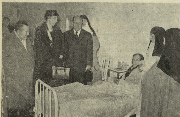
Un momento de la inauguración de una nueva sala en el hospital de la Venerable Orden Tercera, del Patronato de la Latina

Terminada la ceremonia religiosa, y después de entonarse un responso, el Conde de Mayalde y demás autorida-