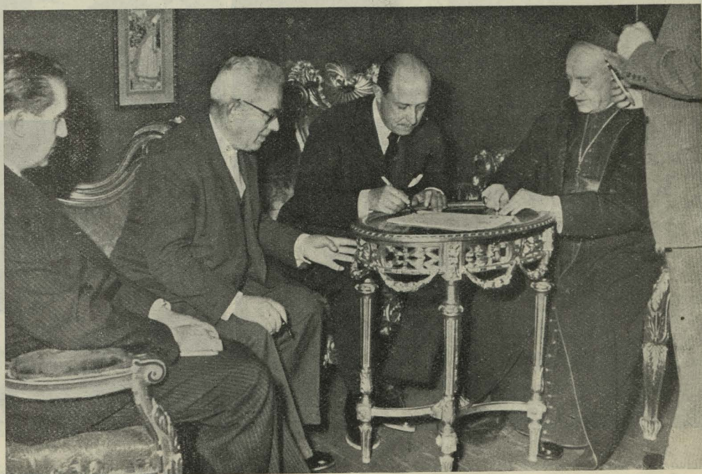
Firma de la escritura de entrega de terrenos al Patronato Virgen de la Almudena