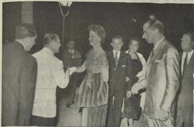
Los representantes de las Municipalidades norteamericanas llegan al Parque del Retiro, siendo saludados por el Conde de Mayalde