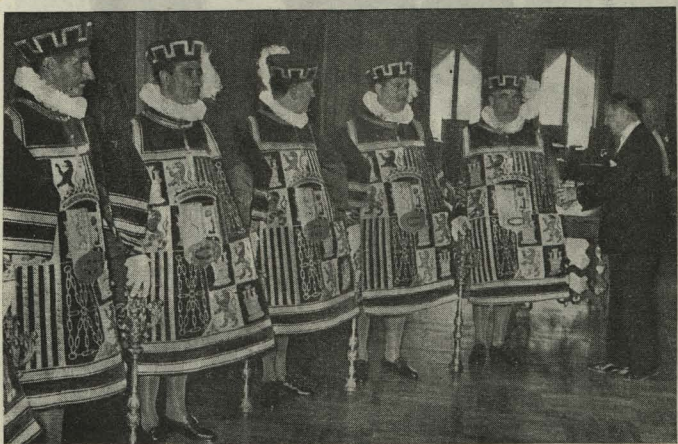
El Alcalde de Madrid viendo las nuevas dalmáticas que han de llevar en lo sucesivo los Maceros de la Villa

la Colegiata, Conde de Romanones, plaza de Benavente, Puerta del Sol y calle y plaza Mayor, desde donde el Obispo Auxiliar de la diócesis, Doctor García Lahiguera, impartió la bendición con el Santísimo Sacramento desde un artístico altar levantado al efecto. En la Procesión figuraban todas las Cofradías, Hermandades y Asociaciones piadosas de Madrid, representaciones del Ejército, Marina y Aire, Hijosdalgo de Madrid, la Diputación y el Ayunta-