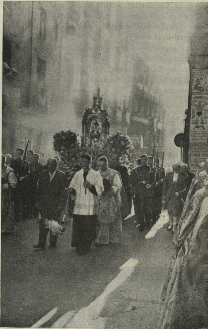
La procesión del Santísimo Corpus Christi, a su paso por las calles de Madrid