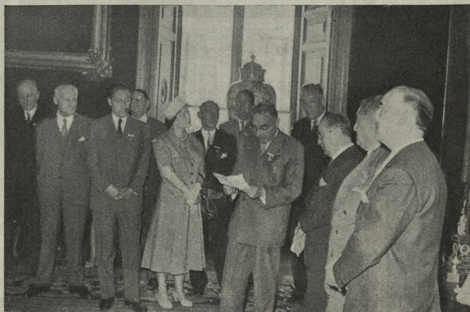
Un momento de la recepción celebrada en honor de los que asistieron al XXXVII Congreso de Higienistas y Técnicos municipales

El Conde de Mayalde le contestó con un brillante discurso, subrayando la acción paralela y providencial confe-