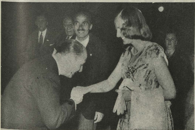
El Alcalde saluda a la Archiduquesa Otto de Austria-Hungría, a su llegada a los Jardines del Retiro

Día 20. —Con el esplendor acostumbrado se celebró en Madrid la Procesión del Corpus, que recorrió las calles de