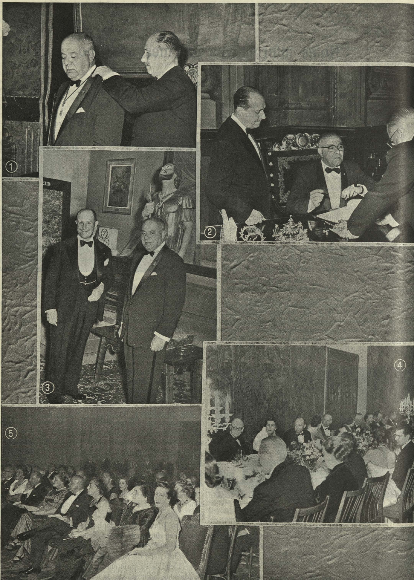
El Alcalde de Lima en el Ayuntamiento de Madrid; 1. El Conde de Mayalde le impone la Medalla de Oro de Madrid.—2. Firmando en el Libro de Oro de la ciudad.—3. Ante la imagen de San Isidro, destinada a una Parroquia peruana.—4. Comida en el salón de Tapices.—5.—Los invitados durante el festival folklórico.