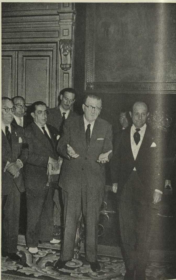
El Presidente de la Asamblea de la Federación de la Prensa, señor Aznar, con el Alcalde de Madrid, durante la recepción celebrada en el Ayuntamiento