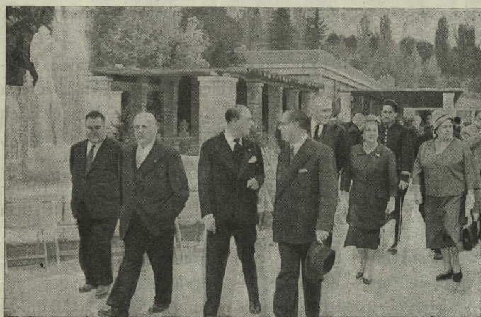
El Alcalde, acompañado de varios señores Concejales, inaugura la Rosaleda instalada en el Parque del Oeste

Día 12.—La Duquesa de Pastrana, esposa del Alcal-