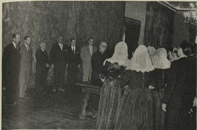
La Capella Clásica de Mallorca interpreta un concierto ante el Alcalde de Madrid