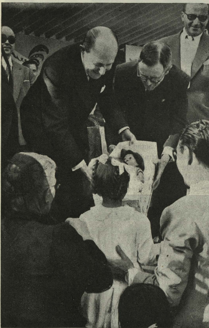
El Alcalde de Madrid distribuyendo juguetes a los alumnos de las escuelas madrileñas

—El Marqués de Grijalba, en representación del Conde de Mayalde, recibió en el aeropuerto de Barajas a va-