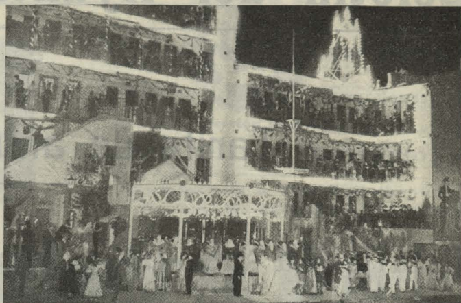
Un momento de la representación de la zarzuela La Gran Vía en el recinto de La Corrala

rias representaciones de Municipalidades norteamericanas que llegaron a Madrid en visita de turismo.