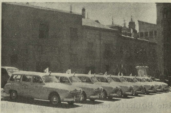
Nuevas ambulancias adquiridas y destinadas a los servicios de Sanidad del Ayuntamiento