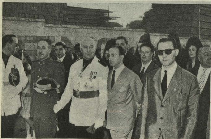
Presidencia de la procesión de Nuestra Señora del Carmen, celebrada en el Puente de Vallecas

Día 12. —En el Colegio de San Ildefonso tuvo lugar la fiesta de fin de curso y reparto de premios de los alumnos del Internado y de las actividades del Centro de Orientación Pedagógica y Extensión Cultural, conjuntamente, con más de trescientos escolares de distintos grupos municipa-