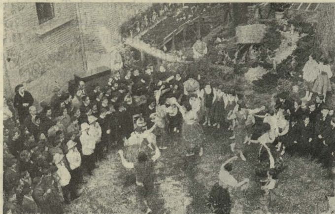
Niños de los Internados municipales bailando ante el Belén instalado en la Casa de la Villa

ros de diferentes Internados y grupos escolares de la capital.