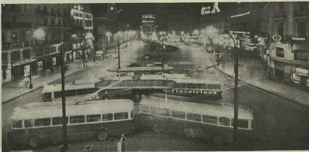
La Puerta del Sol con su nueva iluminación, inaugurada en la noche del 31 de diciembre

Pronunció una conferencia el Catedrático y Director del