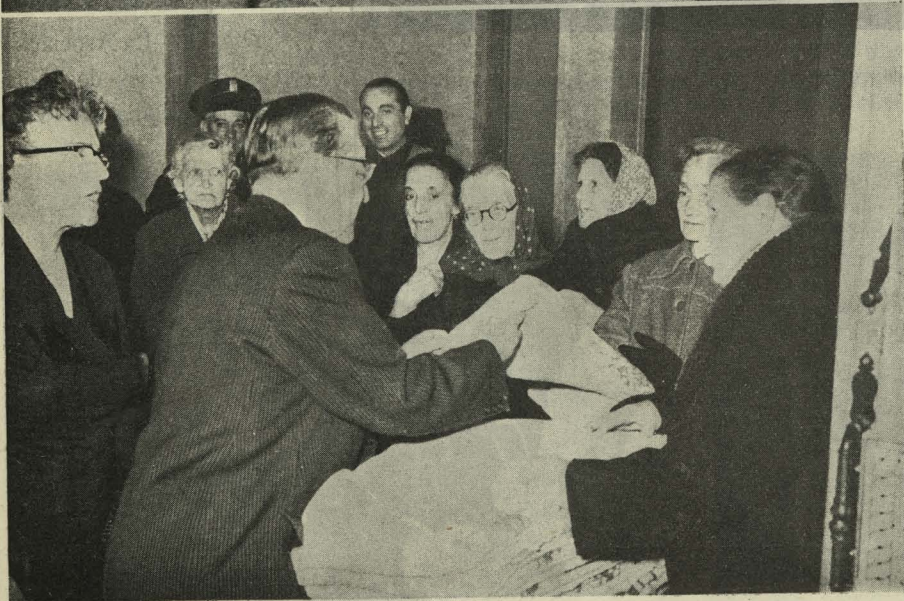
Reparto de comidas, bolsas y prendas de abrigo en las Tenencias de Alcaldía durante las fiestas de Navidad