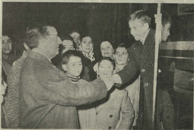
El Teniente de Alcalde Delegado de Enseñanza despide a los alumnos del Intercambio escolar con Barcelona

Categoría B.—Primer premio: Escuelas del Patronato