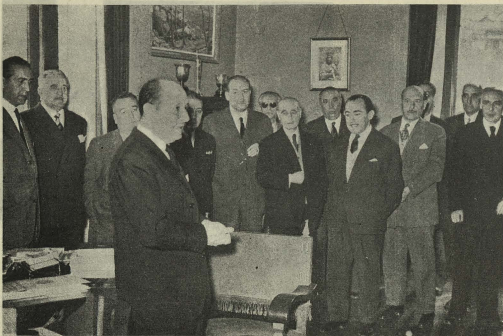
El Alcalde felicita a los Jefes de los distintos Servicios el nuevo año

confeccionadas por las señoritas pertenecientes a la Hermandad de Nuestra Señora de la Almudena y San Isidro Labrador, se destinan a los niños hijos de obreros municipales que nazcan durante el año próximo.