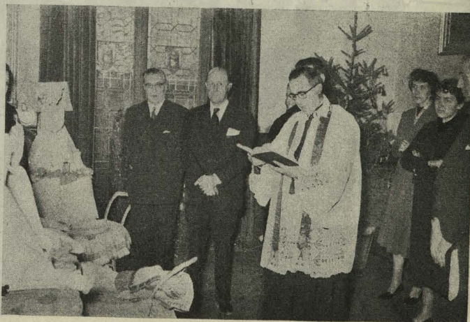
Bendición de las canastillas confeccionadas por las señoritas de la Hermandad Municipal de Nuestra Señora de la Almudena y San Isidro Labrador