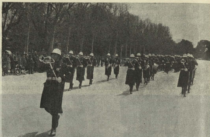
Desfile de la Banda de Trompetas y Tambores de la Policía Municipal en el paseo de Coches del Retiro

de tambores y trompetas para los servicios de Policía Municipal.