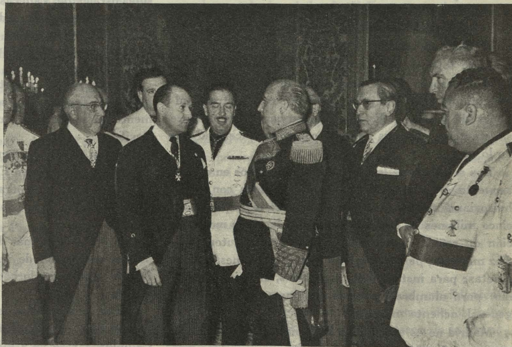
Su Excelencia el Jefe del Estado, rodeado de los Concejales madrileños, en el aniversario de la liberación de Madrid

Celebramos otra vez el aniversario de la Victoria Nacional, fecha trascendental para la vida de la Patria;