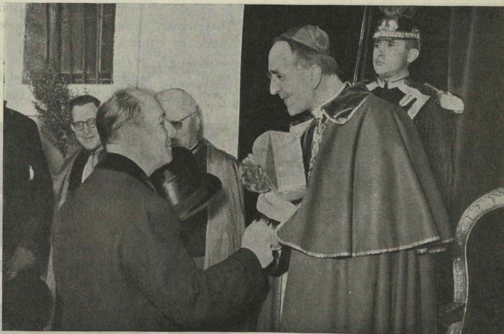
El Alcalde de Madrid cumplimenta al Nuncio de Su Santidad en el XIX aniversario de la exaltación al Pontificado de Su Santidad Pío XII

—El Alcalde asistió en El Escorial al traslado de los restos de Su Alteza real Doña Eulalia de Borbón, Infanta