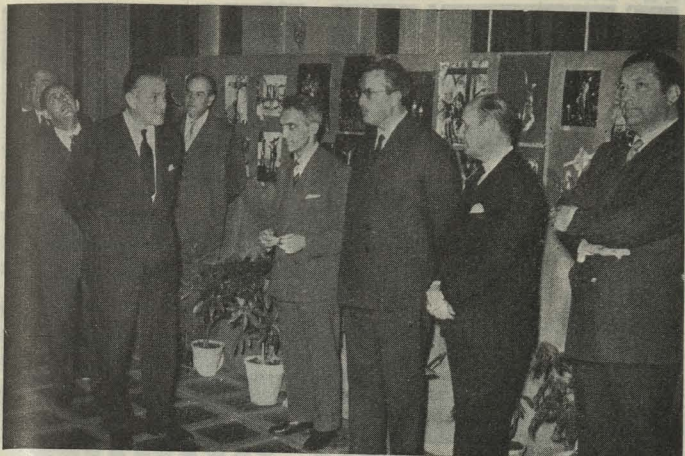
Un momento de la clausura de la Exposición de Fotografías de la Semana Santa y Museo vallisoletanos

De tipo político son más difíciles los problemas que hay que resolver, y al Gobierno de la Nación corresponde hacerlo. Uno de los puntos a dilucidar será el de la inevitable transformación del Concejo, que indudablemente puede afectar en el orden personal a los que hoy hemos tenido el honor de ser recibidos por Vuestra Excelencia.