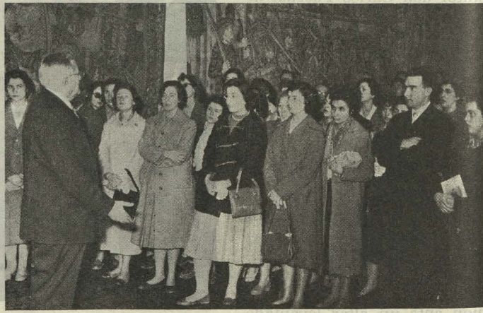
El Orfeón de Gracia, de Barcelona, actuando en el Ayuntamiento madrileño

Día 20. —En el patio de Cristales del Ayuntamiento se inauguró una Exposición de fotografías de la Semana Santa de Valladolid. Con el Teniente de Alcalde Delegado de En-