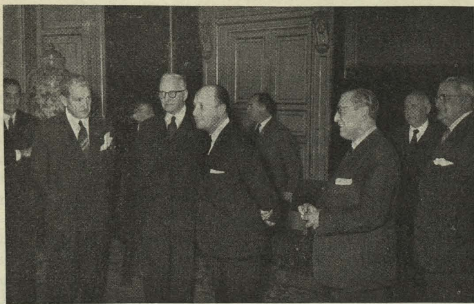
El Alcalde saluda al Comité Ejecutivo Internacional de Organización Científica del Trabajo

de España, y al solemne funeral celebrado en la basílica del Monasterio.