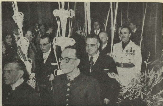
La Procesión de las Palmas en la Santa Iglesia Catedral, con asistencia de la Corporación Municipal