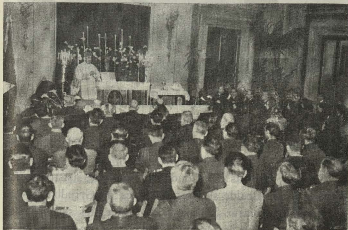
Un momento de la misa celebrada en el patio de Cristales como final de los Ejercicios Espirituales para funcionarios