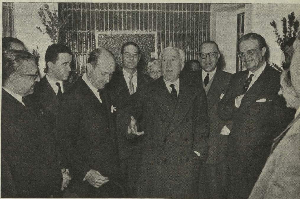
El Ministro de la Gobernación, señor Alonso Vega, en el acto de inaugurar el Centro de Especialidades Médicas

Día 31. —Los escolares barceloneses que, en intercambio patrocinado por los Institutos Municipales de Educación de Madrid y Barcelona, se encontraban en Madrid, estuvieron en la Casa de la Villa para entregar al Alcalde un mensaje del de la Ciudad Condal.