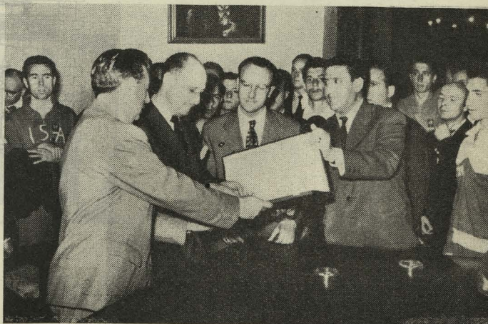
Representantes de los Juegos Deportivos Sindicales entregan al Alcalde una artística placa

— A las ocho de la noche, el Alcalde recibió a los Presidentes de los Círculos deportivos, directores de periódicos, cronistas y periodistas, y les hizo entrega del programa de las fiestas de San Isidro, organizadas por el Ayuntamiento de Madrid.