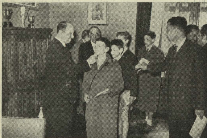
El Alcalde saluda a los niños barceloneses del III Intercambio Escolar