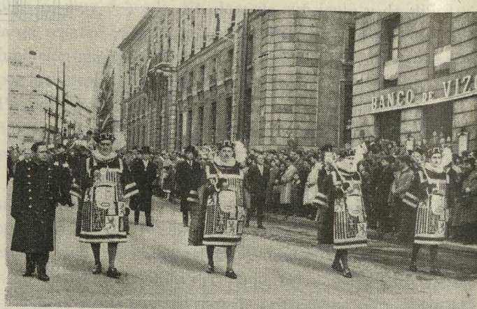
La Corporación Municipal en la presidencia de la Procesión del Santo Entierro

Jueves y Viernes Santos. —En la Santa Iglesia Catedral se celebraron las solemnidades religiosas de la Semana Santa. A la misa del jueves y a los Divinos Oficios del