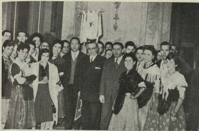
Coros y Danzas de Igualada en el Ayuntamiento

viernes asistió la Corporación Municipal, bajo mazas, y terminadas las ceremonias del jueves se verificó la visita a los Sagrarios, bajo la escolta de la Guardia Municipal.