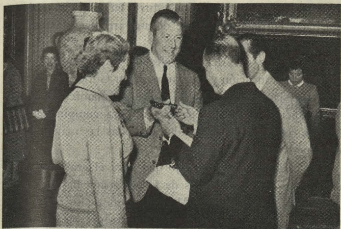
El Alcalde de Madrid recibe la llave de la ciudad de Camden (Nueva Jersey)