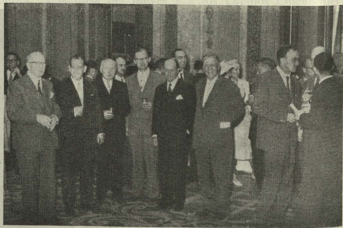
Los asambleístas de la IV Conferencia Internacional de Tecnología de la Madera en la Casa de la Villa