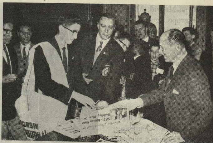
El Alcalde con los repartidores de periódicos norteamericanos