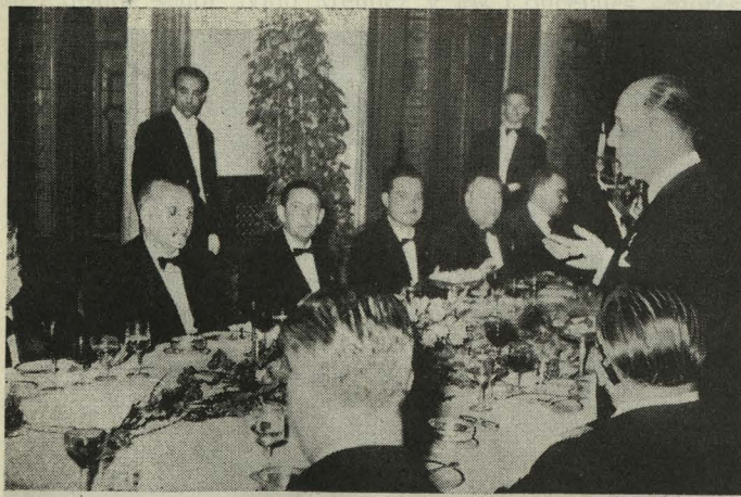
Un detalle de la cena ofrecida por el Ayuntamiento al Alcalde de Barcelona y autoridades de Cataluña