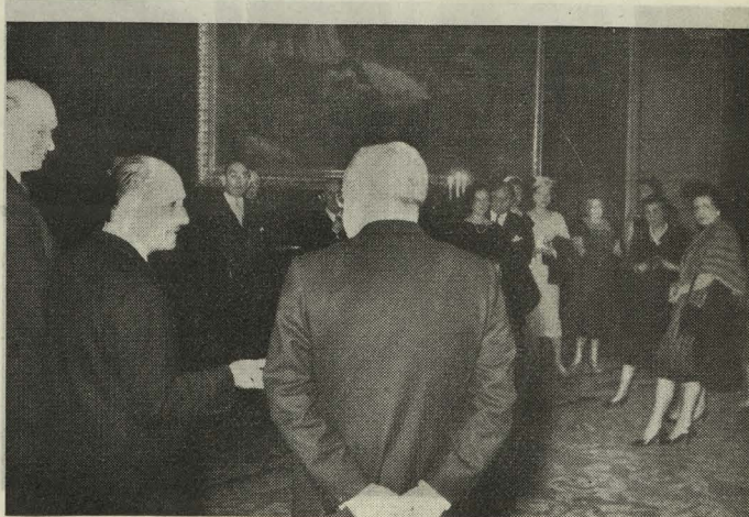
Recepción en honor de los Presidentes del Canadian Pacific y del Canadian Airlines

— El Alcalde recibió en la Casa de la Villa a los sesenta repartidores de periódicos norteamericanos que se encon-