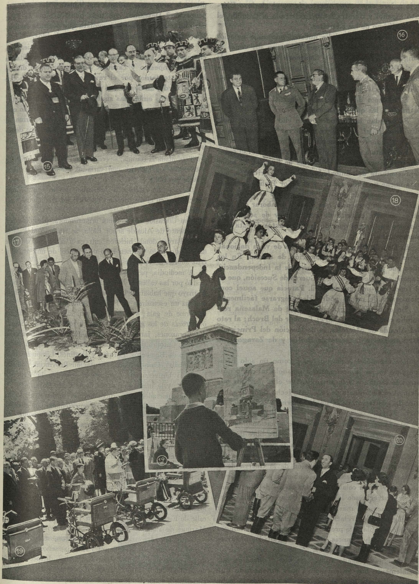
15. Las autoridades estatales y municipales al salir de la ceremonia religiosa celebrada en la Catedral el día de San Isidro.—16. Equipos participantes en el Primer Torneo Internacional de Hockey, en el Ayuntamiento.—17. El Conde de Mayalde inaugura la Exposición de Flores y Plantas de Primavera. en el patio de Cristales de la Casa de la Villa.—18. Los Coros y Danzas de Educación y Descanso, en el patio de Cristales de la Casa de la Villa.—19. Un momento de la bendición de los coches para inválidos entregados por la Junta de Beneficencia de Retiro-Mediodía.—19-b. En la plaza de Oriente se celebra el III Certamen de Dibujo y Pintura Escolares; y 20. Recepción ofrecida por el Ayuntamiento a los participantes en el Concurso Típico Internacional.