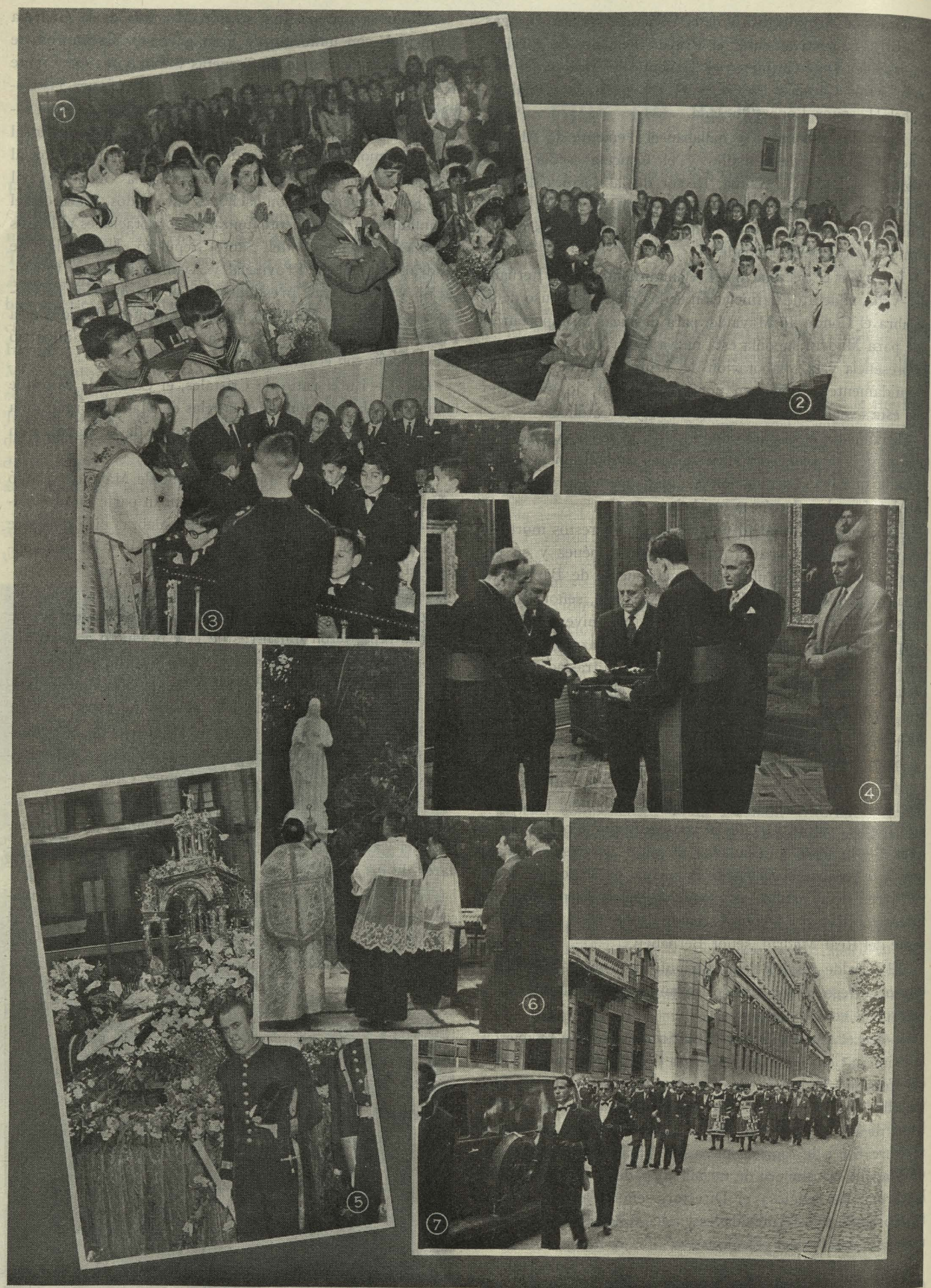
Primera Comunión en colegios municipales: 1. En las Escuelas de Aguirre.—2. Las niñas del Internado femenino Palacio Valdés en el acto de recibir la Primera Comunión.—3. Los niños del Internado de San Ildefonso reciben la Primera Comunión.—4. En la Nunciatura Apostólica, el Alcalde y una representación municipal reciben las insignias de la Orden de San Silvestre de manos del Nuncio de Su Santidad.—5. La Custodia con el Santísimo Sacramento en las calles de la capital el día de la fiesta del Corpus Christi.—6. En el Albergue de Ancianos, de Alcalá de Henares, se entronizó la imagen del Sagrado Corazón de Jesús.—7. Traslado de los restos de don Miguel Otamendi, hijo adoptivo de Madrid