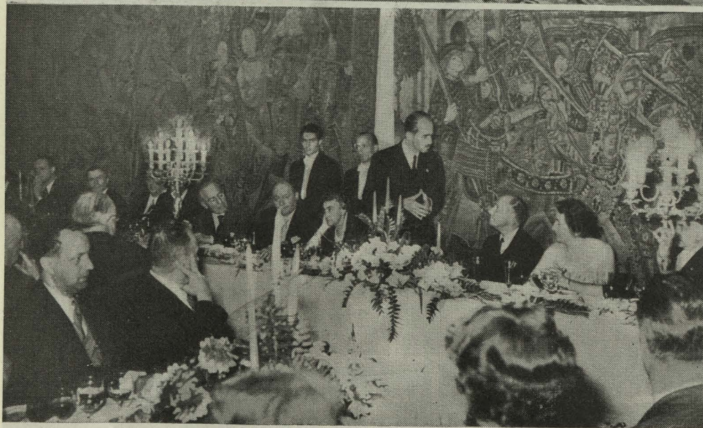
El Archiduque Otto de Austria-Hungría, con los Condes de Mayalde, en la recepción del Centro de Documentación. Aspecto del salón de Tapices durante la comida ofrecida a los asistentes al VII Congreso del Centro Europeo de Documentación