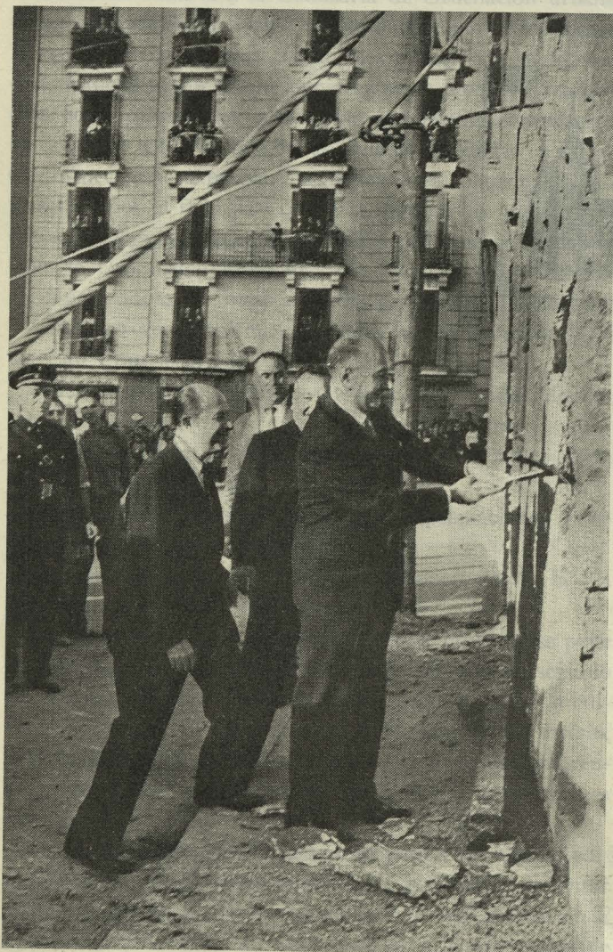
El Ministro de la Vivienda inicia las obras de la nueva Gran Vía de los Reyes Católicos, en presencia del Alcalde

— En los locales de la nueva Nunciatura, el representante diplomático de Su Santidad, Monseñor Antoniutti, impuso al Alcalde de Madrid, Conde de Mayalde, las insignias