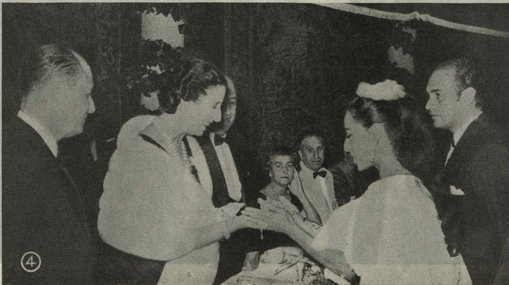
1. El Jefe del Estado y su esposa, doña Carmen Polo de Franco, saludan a los Concejales madrileños a su llegada a los Jardines del Retiro.—2. Presidencia de la cena ofrecida por el Ayuntamiento al Generalísimo Franco y su esposa.—3. Un momento de la fiesta celebrada en honor del Generalísimo Franco, en el Retiro.—4. Los dirigentes del Ballet Mejicano saludan a doña Carmen Polo, esposa del Generalísimo Franco