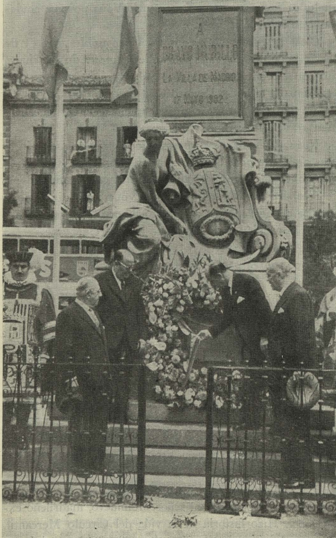
El Conde de Mayalde durante el acto conmemorativo del centenario de la traída de aguas a Madrid.—El Alcalde de Madrid deposita una corona ante el monumento de Bravo Murillo.

discurso hizo entrega de la Medalla de Oro de la Villa al Presidente del Círculo de la Unión Mercantil e Industrial e impuso al mismo la Medalla de Plata.