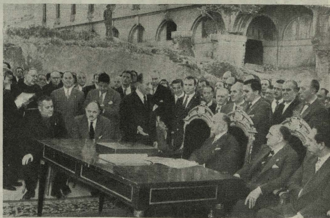
Autoridades y personalidades asistentes a la inauguración de la Gran Vía de los Reyes Católicos

Día 12.—Los Ministros de la Vivienda y Obras Públicas, señores Arrese y Vigón; el Alcalde de Madrid y el Comisario de Ordenación urbana hicieron una visita a lo largo del recorrido de las obras de canalización del Manza-