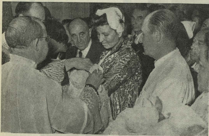
El Alcalde de Madrid, padrino de bautismo de uno de los cuatrillizos nacidos en la capital

Día 28. —En el Instituto Provincial de Obstetricia y Ginecología se celebró el bautizo de los cuatro niños gemelos nacidos en Madrid días antes. Siendo padrino de uno de ellos el Alcalde, Conde de Mayalde, quien terminado el acto hizo entrega al padre de los recién nacidos de un donativo del Ayuntamiento.