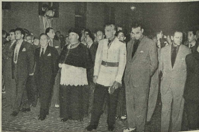
Presidencia de la Procesión de Nuestra Señora del Carmen, en el distrito de Chamberí