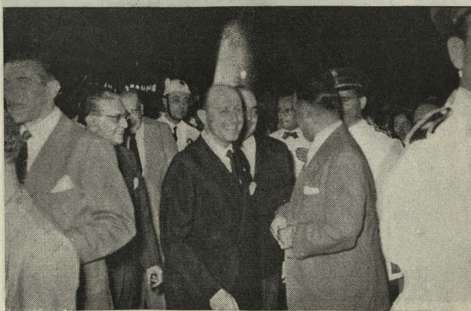
Inauguración por las Autoridades municipales de la plaza del Conde del Valle del Súchil

— El Alcalde asistió a la fiesta que en conmemoración del glorioso Alzamiento Nacional ofreció el Jefe del Estado al Gobierno de la Nación, Autoridades estatales y Jerarquías del Movimiento y Cuerpo Diplomático acreditado en Madrid, en los Jardines de La Granja.