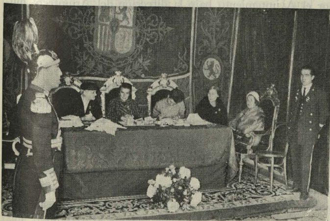
La mesa instalada en la plaza de la Villa durante la recaudación de la Fiesta de la Banderita