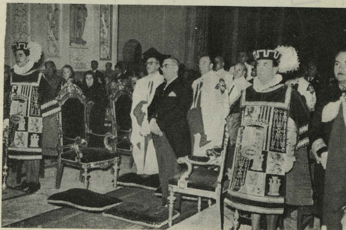
La Corporación Municipal y los Hijosdalgos de Madrid en la fiesta de la Almudena