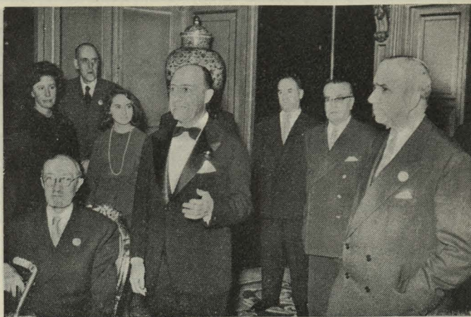
El Conde de Mayalde se dirige a los participantes en el XXIV Congreso Luso-Español de Ciencias

El Conde de Mayalde les dirigió palabras de salutación, a las que contestó el Presidente del Congreso, señor Lora