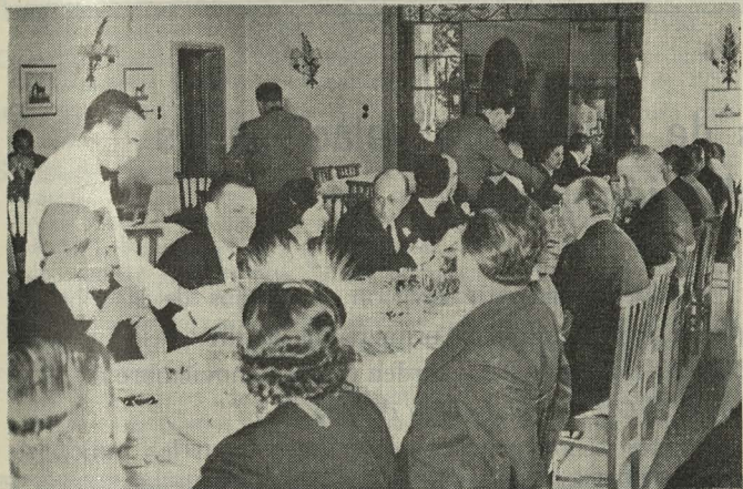
Almuerzo ofrecido por el Alcalde de Madrid en honor de la señora viuda de Castillo Armas

Día 27. —El Jefe del Estado, Generalísimo Franco, inauguró el Centro de Energía Nuclear Juan Vigón, en la