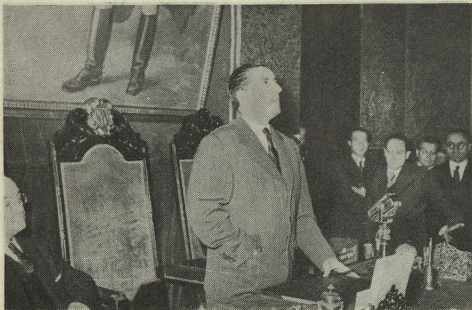
El Teniente de Alcalde Delegado de Enseñanza en la recepción de los Maestros de Madrid