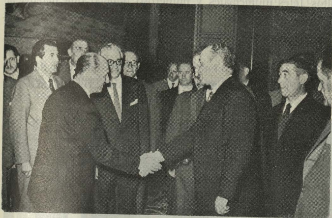
El Alcalde saluda a los directivos de la Primera Exposición de la Industria Nacional