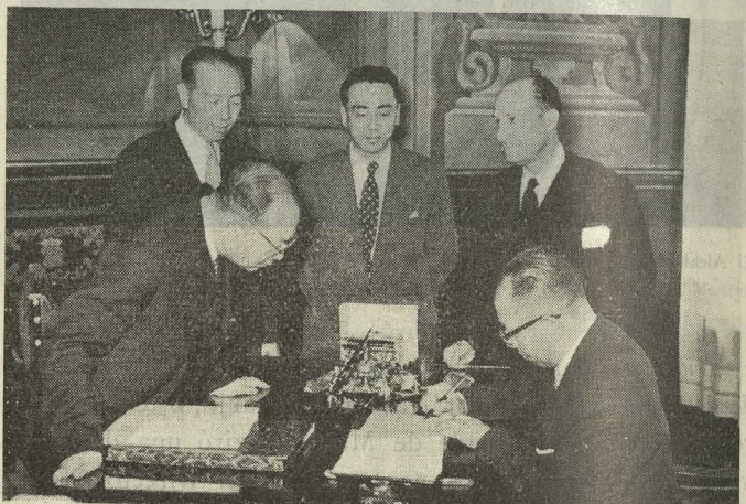
El Ministro de Asuntos Exteriores de la China nacionalista firma en el Libro de Oro de Madrid en presencia del Embajador de su país y del Alcalde de Madrid