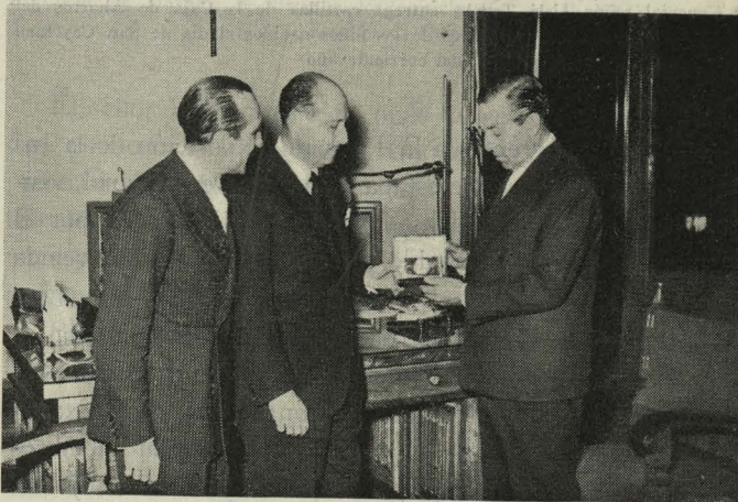
El Alcalde recibe un obsequio de la Asociación de Charros Mejicanos

—El Alcalde de Madrid asistió en la Santa Iglesia Catedral de Madrid a un Tedeum, en acción de gracias por la exaltación al solio pontificio del Cardenal Angel José Roncalli, Juan XXIII de pontificado. Previamente se dijo una misa, a la que asistieron el Patriarca Obispo, los