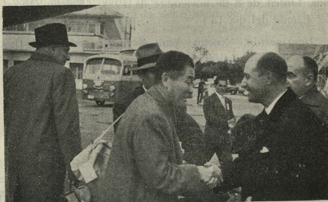
El Alcalde de Madrid saluda en el aeropuerto de Barajas al Presidente de la Asamblea Metropolitana de Tokio