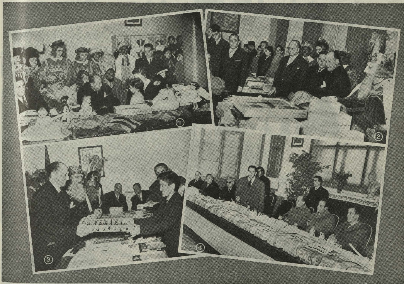
Reparto de juguetes en los Internados municipales: 1. En el Internado femenino Palacio Valdés.—2. En el de la Paloma.—3. En el de San Ildefonso. 4. El Alcalde con el Concejal Delegado de Enseñanza en las Escuelas de Aguirre.

Día 21. —El Alcalde ofreció una recepción al Real Cuerpo de Caballeros Hijosdalgo de la Nobleza de Madrid con motivo de haber sido nombrado Presidente de la entidad Su Alteza Real el Infante Don Luis Alfonso de Baviera. El Conde de Mayalde, después de evocar la personalidad de