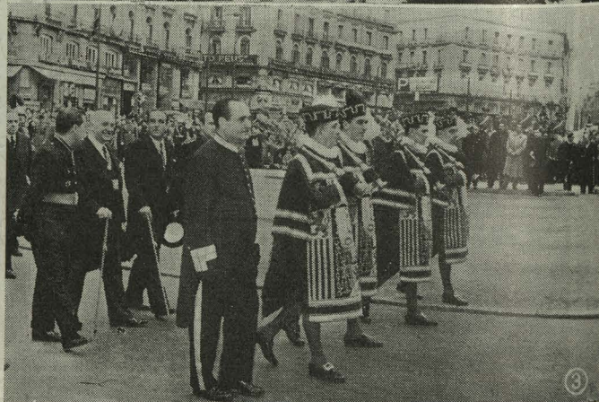
1. La Corporación Municipal saliendo de la Santa Iglesia Catedral el Domingo de Ramos.—2. El Alcalde y el Presidente de la Diputación durante la visita a los Sagrarios en la tarde del Jueves Santo.—3. Presidencia de la Procesión del Santo Entierro