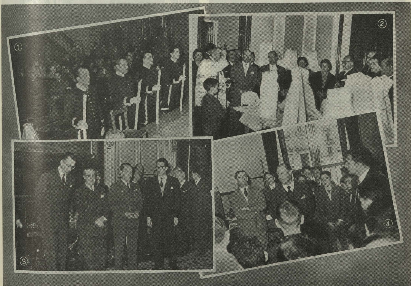
1. Un momento de la misa celebrada en la iglesia de Santa Cruz en la fiesta del Santo Angel de la Guarda.—2. Bendición de la Exposición de Canastillas, en el distrito de la Arganzuela.—3. El Primer Teniente de Alcalde, señor Soler Díaz-Guijarro, con los participantes en el II Gran Premio de Esquí.—4. El Conde de Mayalde y el señor Gutiérrez del Castillo reciben a los escolares de Barcelona.

Día 6. —En el Colegio Mayor Universitario de San Pablo se efectuó un acto académico, durante el cual les fueron impuestas las becas de colegial Mayor de Honor al Conde de Vallengano, al Subsecretario de Educación Nacional, don