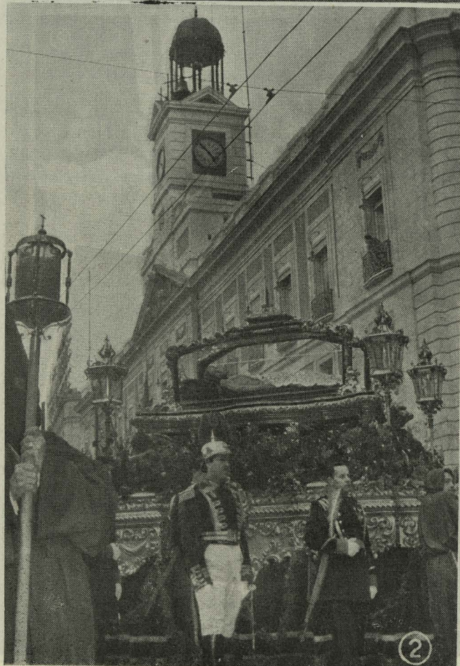
1. Misa celebrada en el Patio de Cristales como final de los Ejercicios Espirituales para funcionarios municipales.—2. La Procesión del Santo Entierro a su paso por la Puerta del Sol

José Maldonado, y al Alcalde de Madrid, Conde de Mayalde.