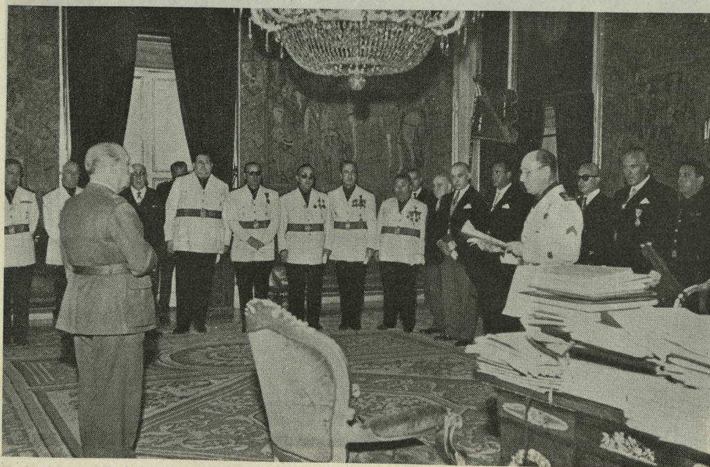
La Corporación Municipal ante el Caudillo en el aniversario de la Liberación de Madrid

Del presupuesto ordinario se destinan algo más de 134.000.000 de pesetas, como aportación establecida por la ley, para el presupuesto especial de Urbanismo, presupuesto especial con el que, al mismo tiempo que se cumplen en una mínima parte las más elementales disposiciones de la vigente ley del Suelo y Or-