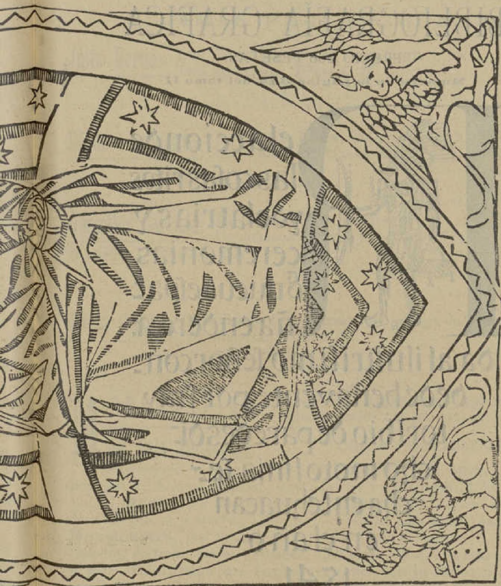
I.124. Jesús, redentor del mundo, con los cuatro evangelistas.—Grabado que con gran orla se halla en el Misal Tarraconense . Vol. II, bbb. verso.