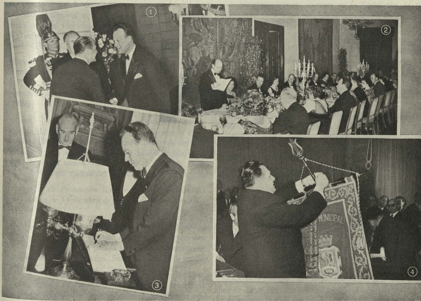
1. El Ministro de la Construcción de Francia es saludado por el Conde de Mayalde a su llegada al Ayuntamiento.—2. Cena ofrecida en la Casa de la Villa en honor del Ministro de la Construcción de Francia y del de la Vivienda de España.—3. Los Ministros de la Construcción de Francia y de la Vivienda de España firman en el Libro de Oro de la Ciudad.—4. El Concejal Delegado de la Banda Municipal, señor Muñoz Lusarreta, impone una corbata a la bandera de la Agrupación.

El Alcalde de Madrid, Conde de Mayalde, envió dos docenas de rosas, vía aérea, para que fueran depositadas a los pies de Nuestra Señora de Guadalupe, en el templo de Tepeyac, como ofrenda del pueblo madrileño a la Patrona de Méjico.