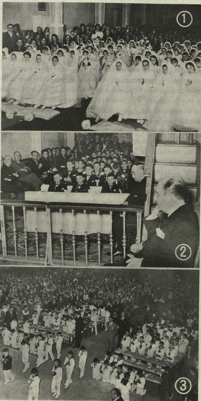
Primera Comunión de los Internados municipales: 1. Palacio Valdés.—2. San Ildefonso.—3. Nuestra Señora de la Paloma.

Día 15. —Con asistencia del Alcalde, Conde de Mayalde;