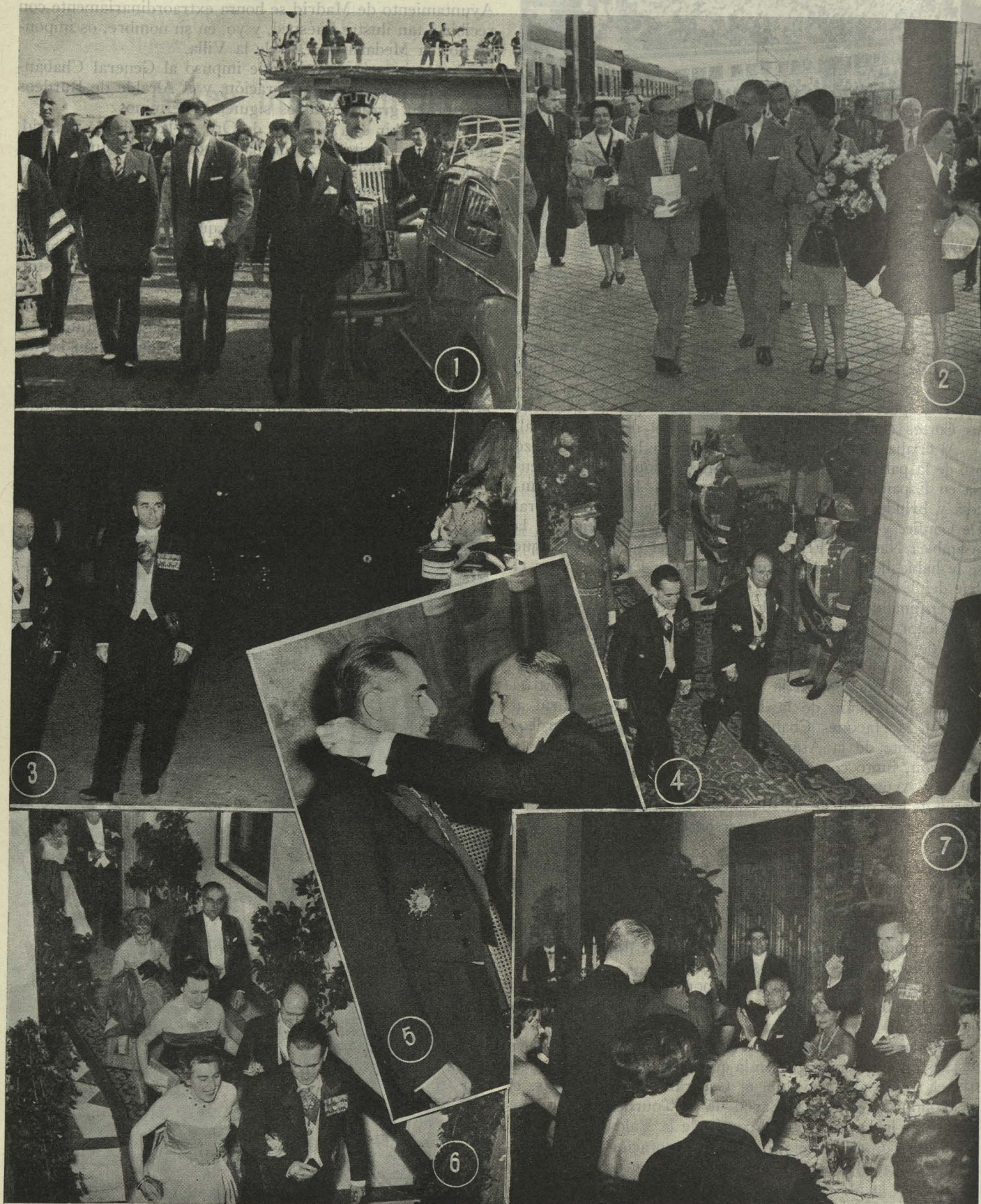
Estancia del Presidente de la Asamblea Nacional Francesa y Alcalde de Burdeos en Madrid: 1. Llegada al Aeropuerto de Barajas.—2. Llegada de los Concejales de Burdeos a la Estación del Norte.—3. El Alcalde de Madrid con el de Burdeos pasan revista a la Policía Municipal.—4. Los dos Alcaldes llegan al Palacio Municipal.—5. Imposición de la Medalla de Oro de Madrid.—6. Los invitados se dirigen a la cena de gala en el Salón de Tapices.—7. Momento del brindis a los postres de la cena.

esposas, pasaron al salón de Tapices, en el que se había habilitado un suntuoso comedor, profusamente adornado, como toda la casa, con plantas y flores, donde fué servida una comida de gala. Ocupó la Presidencia el Conde de Mayalde,