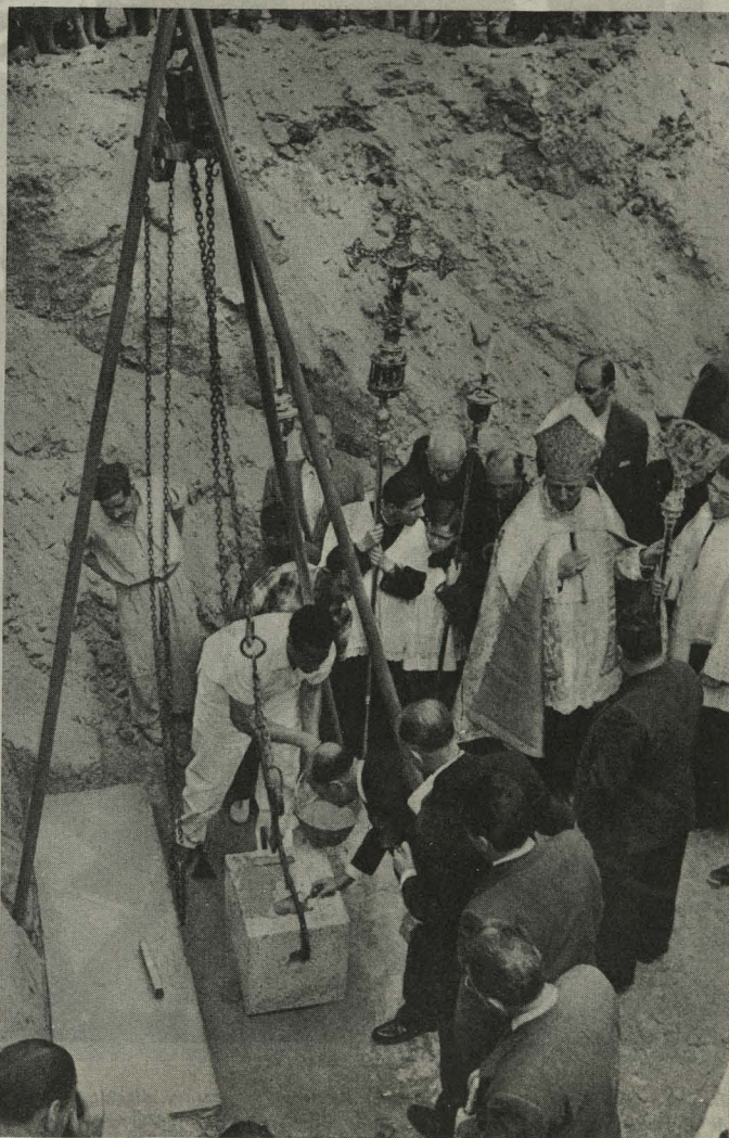
Bendición y colocación de la primera piedra del nuevo Mercado de la Cebada

Después los asistentes, entre los que se hallaban tam-