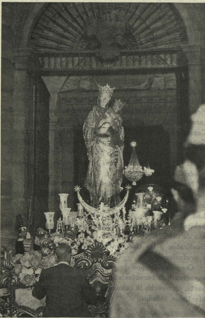
La venerada imagen de Nuestra Señora de la Almudena sale de la Santa Iglesia Catedral en el día de su fiesta