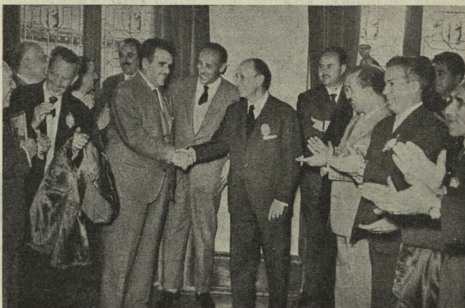
El Alcalde saluda a los asistentes a la Primera Asamblea Nacional del Taxi durante la recepción ofrecida en su honor en la Casa de la Villa

Los visitantes fueron obsequiados después con una copa de vino español.