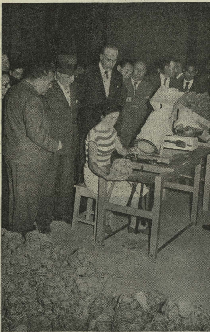
El Teniente de Alcalde Delegado de Abastos presencia el nuevo modelo de envase automático de patatas