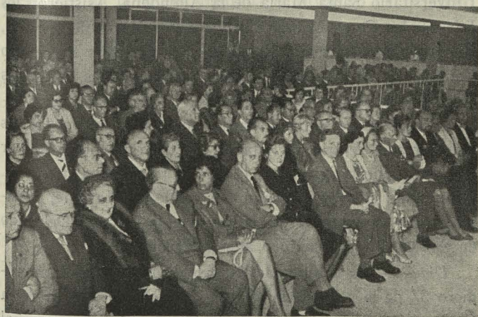
Grupo de asistentes al XXVI Congreso Internacional de Fundición en la fiesta ofrecida por el Ayuntamiento en el Retiro