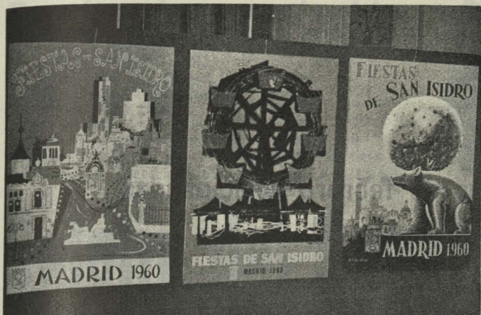
Carteles premiados en el concurso para anunciar las fiestas de San Isidro.

de Asuntos Exteriores y la señora de Castiella, a la que asistió el Alcalde con su esposa, la Duquesa de Pastrana.