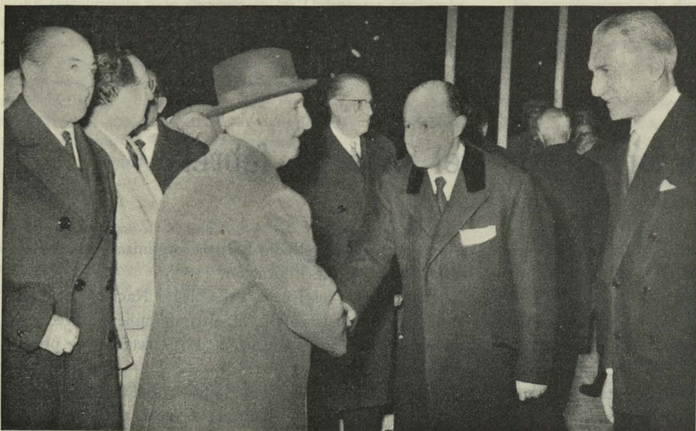
El Alcalde de Madrid, Conde de Mayalde, saluda al Jefe del Estado, Generalísimo Franco, al llegar al nuevo Palacio de los Deportes